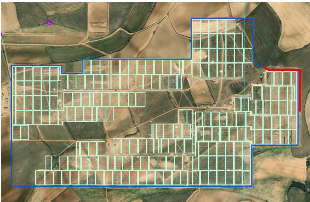
Se resalta en rojo la zona afectada