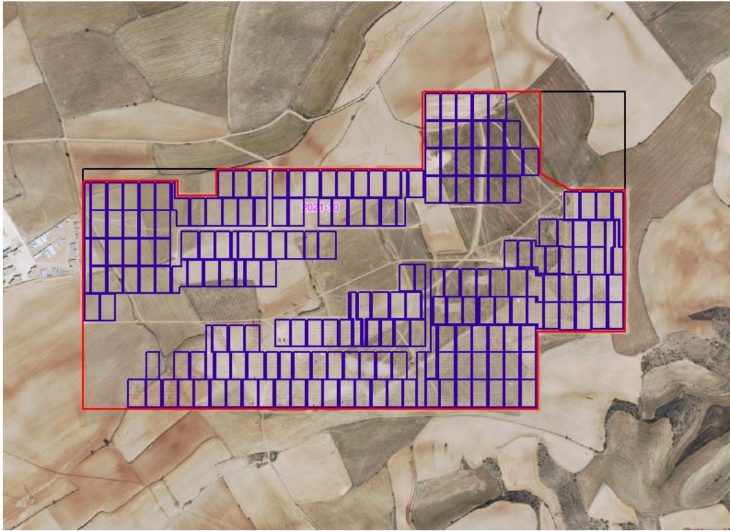
Figura 1: Ubicación del perímetro y de los paneles fotovoltaicos sobre fotografía por satélite.