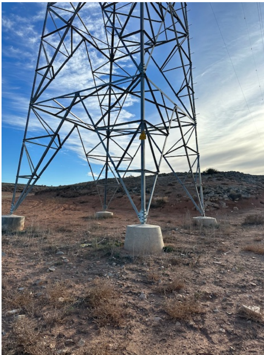
Imagen 12. Se aprecia el correcto anclaje de los postes.