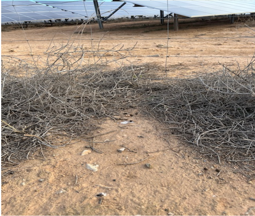
Imagen 7. Zona de entrada de conejo, se observan los excrementos de conejos.