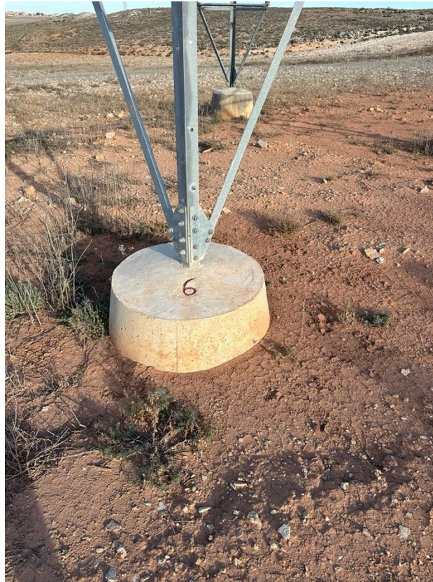
Imagen 5. Apoyo donde se localizó el ave accidentada.