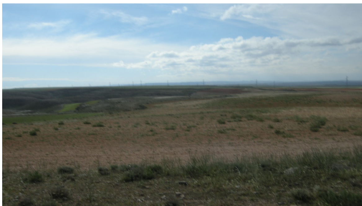
Imagen 2. Complejo de Val

Se encuentran caracterizadas por la presencia de los romerales y matorrales gipsícolas. Entre las aves pueden citarse Calandrella rufescens , Galerida theklae , Anthus campestris , Lanius excubitor , Sylvia conspicillata , Oenanthe hispanica , Carduelis cannabina . Entre los mamíferos, Oryctolagus cuniculus y Vulpes vulpes . Entre los reptiles, Acanthodactylus erithrurus y Lacerta lepida , y entre los anfibios, Bufo calamita .