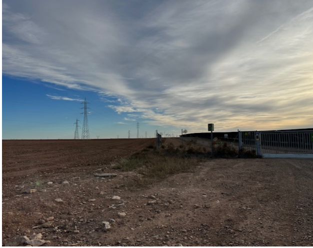
Imagen 14. Oteadero 1.