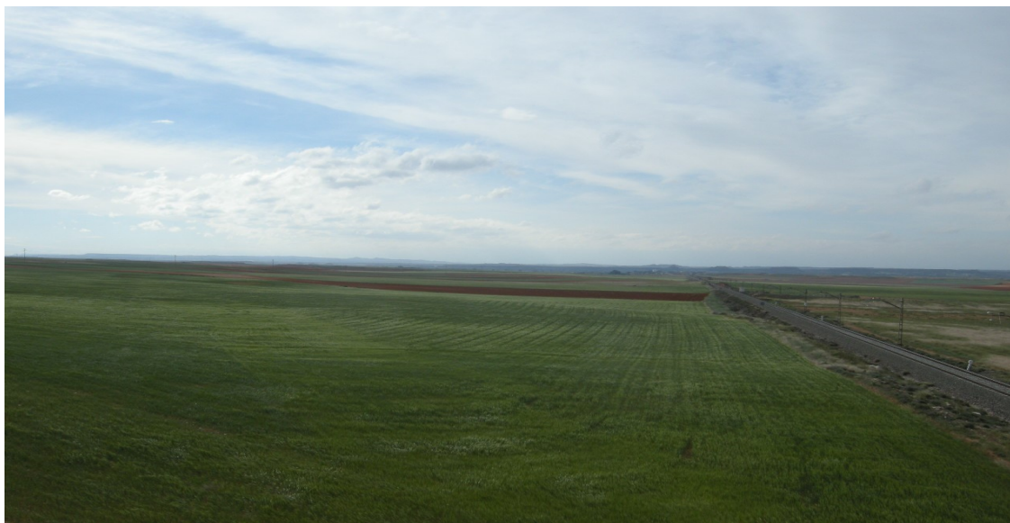
Imagen 3. Llanura cerealista