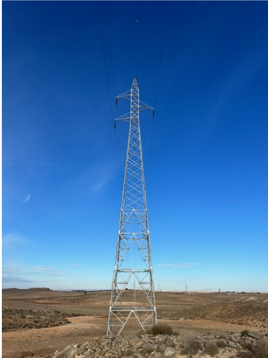
Imagen 9. Se observan salvapajaros.