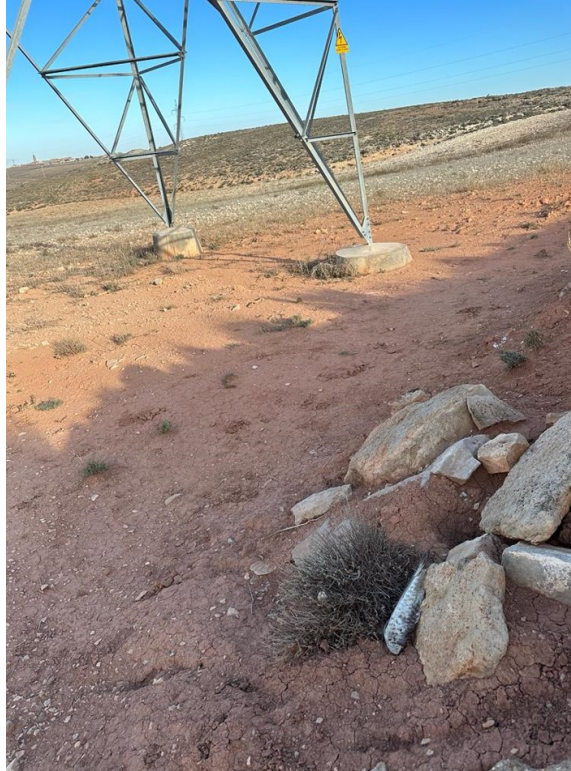
Imagen 4. Restos de cernicalo al lado de las piedras