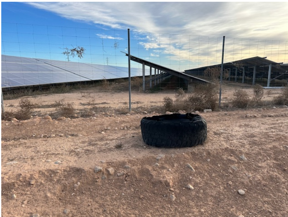
Imagen 13. Se aprecia una rueda en el exterior de la planta no perteneciente a las instalaciones.