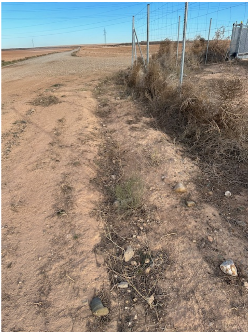
Imagen 10. Se aprecia el surco donde se plantaron las especies y ha crecido algunas retamas.