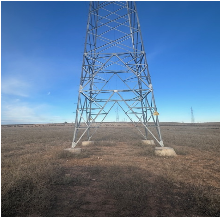
Imagen 16. Transecto