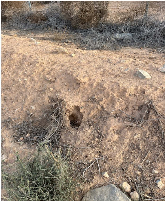
Imagen 6. Zona de entrada de conejo, se observan los excrementos de conejos.

Aunque la zona de estudio es un secano profundo y la disponibilidad de alimentación no es tan abundante como en otras zonas de Aragón, se considera necesario que durante la temporada de caza próxima se realicen batidas para controlar la población de Conejo.