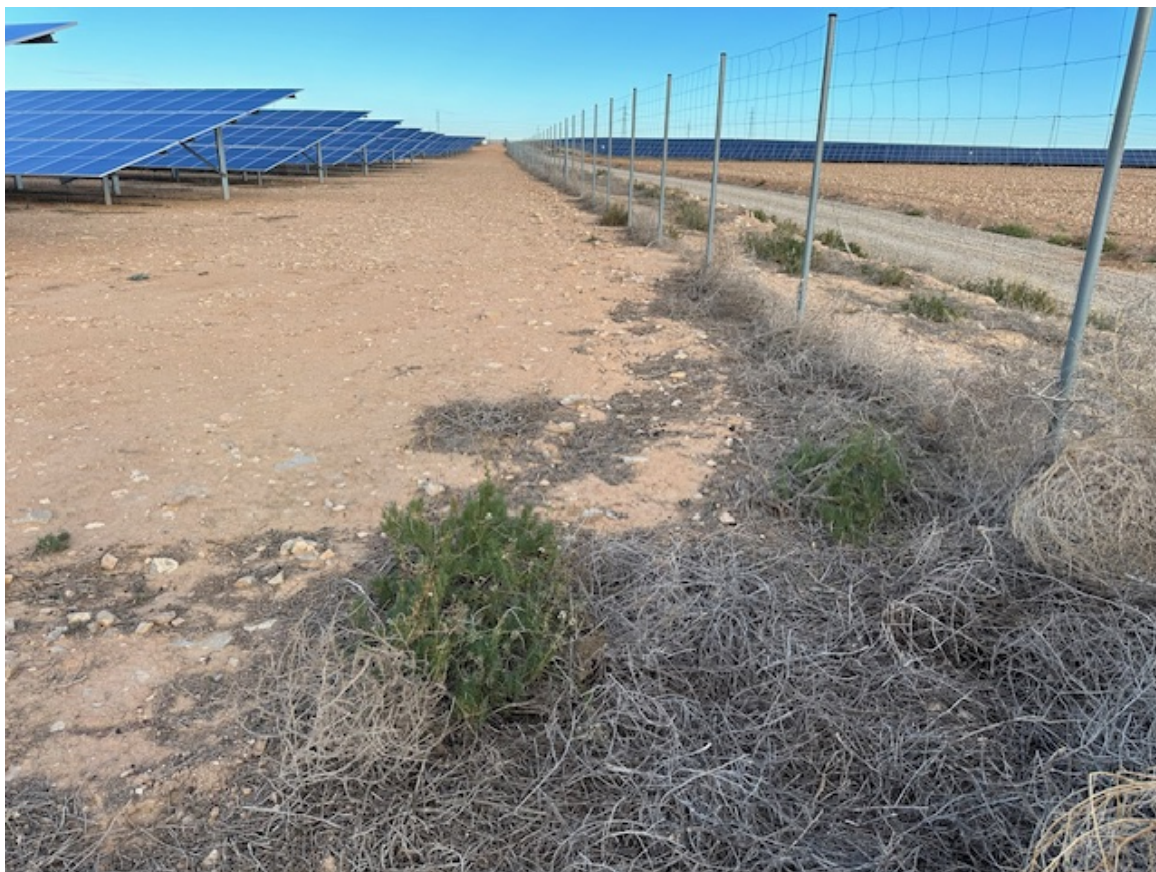
Imagen 11. Se aprecia el surco donde se plantaron las especies y ha crecido romero.