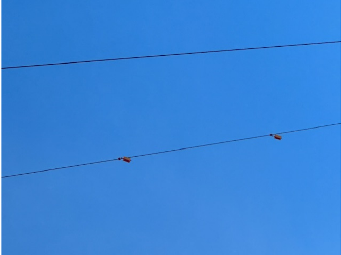
Imagen 8. Se observan salvapajaros.