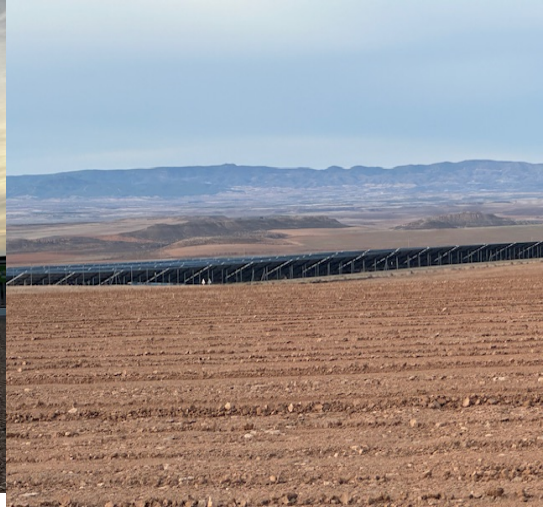
Imagen 15 Oteadero 2.