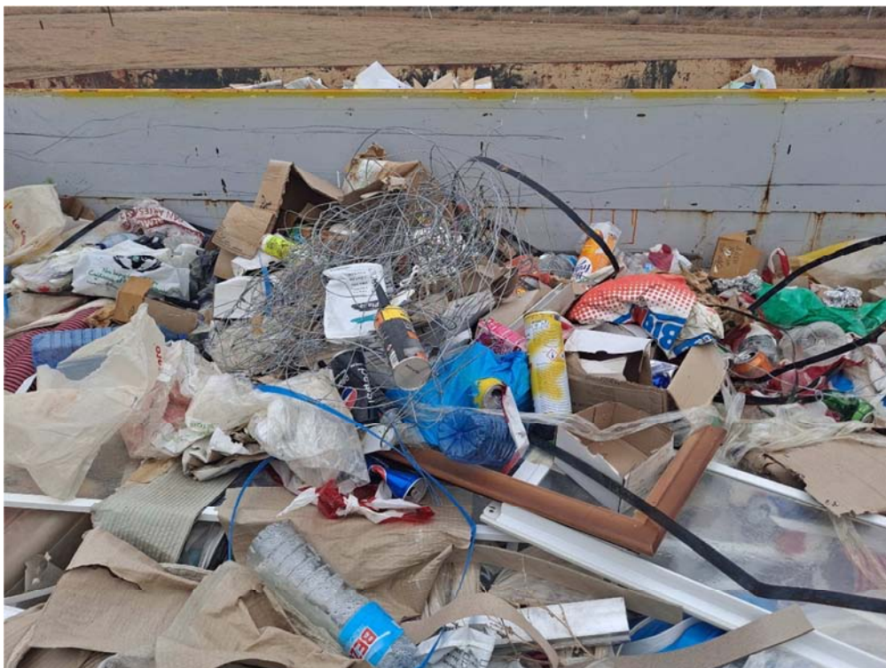
Figura 8.5. Contenedor de plásticos donde se identifican también alambres y cartones