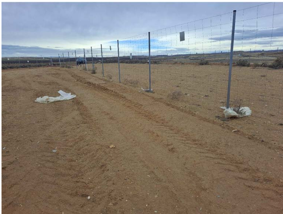
Figura 8.7. Restos de plástico fuera del contenedor, junto al vallado de “San Pedro B”