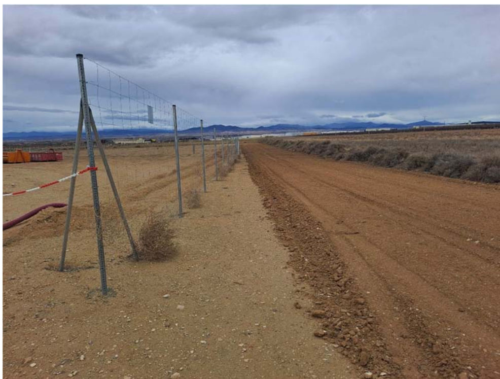
Figura 8.1. Suelo descompactado en el límite norte de la parcela donde se ubica la planta “San Pedro B”