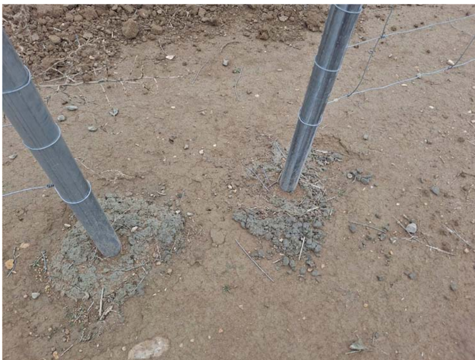
Figura 8.8. Alambres en el suelo junto a los pasos de fauna, observados en los dos recintos de la planta a fecha 15-01-24