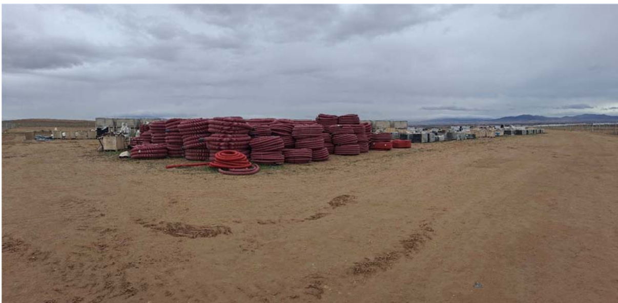
Figura 4.2. Acopios de materiales para la construcción de la planta contigua “Épila”