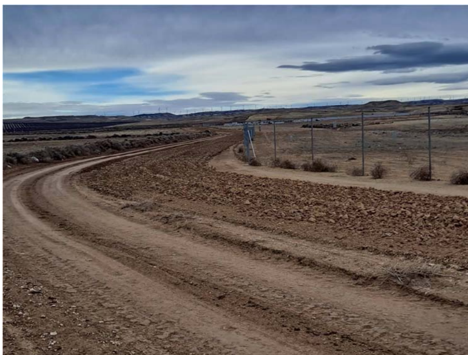
Figura 8.2. Suelo descompactado en los límites norte y oeste de la parcela donde se ubica la planta “San Pedro A”