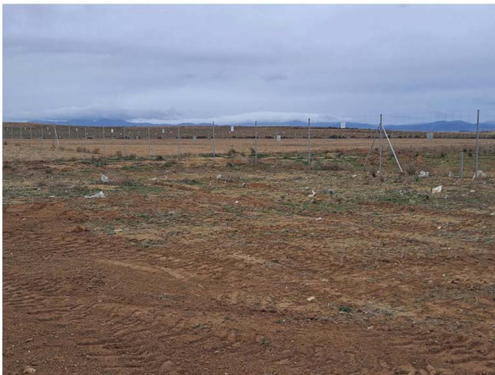
Figura 8.9. Plásticos dispersos entre las plantas “San Pedro” y Épila”