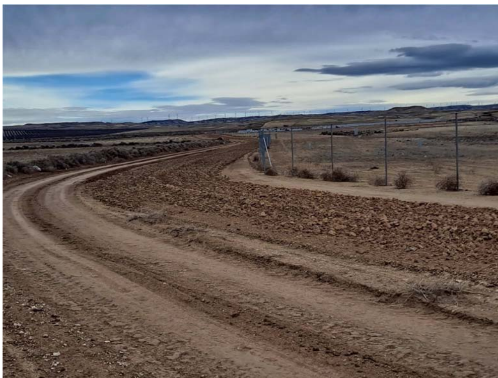
Figura 4.1. Suelo descompactado alrededor de la parcela donde se ubica la planta “San Pedro A”

Apenas se han realizado trabajos en la planta en este periodo, más allá de servir de zona para el acopio de materiales que se usan para la construcción de la planta fotovoltaica colindante “Épila” y el almacenamiento de los residuos que se generan en la misma. También se han realizado labores de descompactación del suelo en algunas zonas del perímetro exterior al vallado.