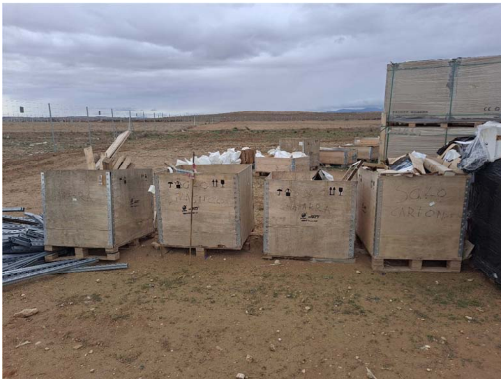
Figura 8.3. Cajones de residuos situados en “San Pedro A” para la agrupación de residuos previamente a su depósito en los contenedores situados en “San Pedro B”