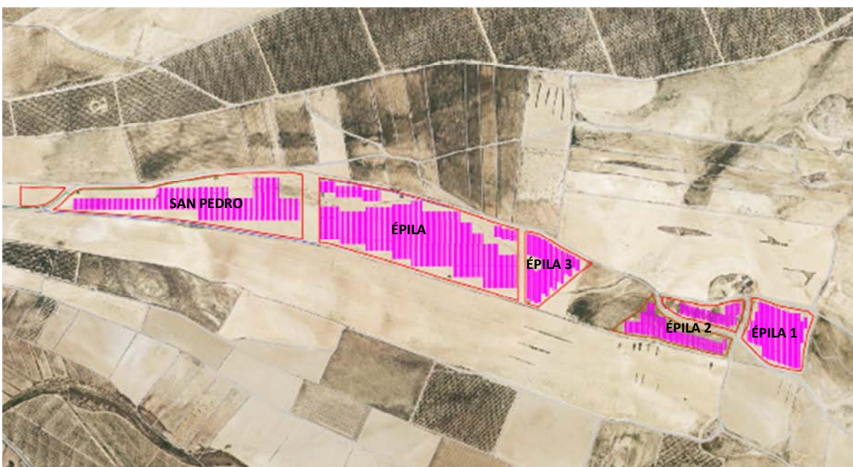
Figura 3.3. Ubicación de las dos plantas fotovoltaicas proyectadas junto a la planta “San Pedro”. Base cartográfica PNOA 2021.