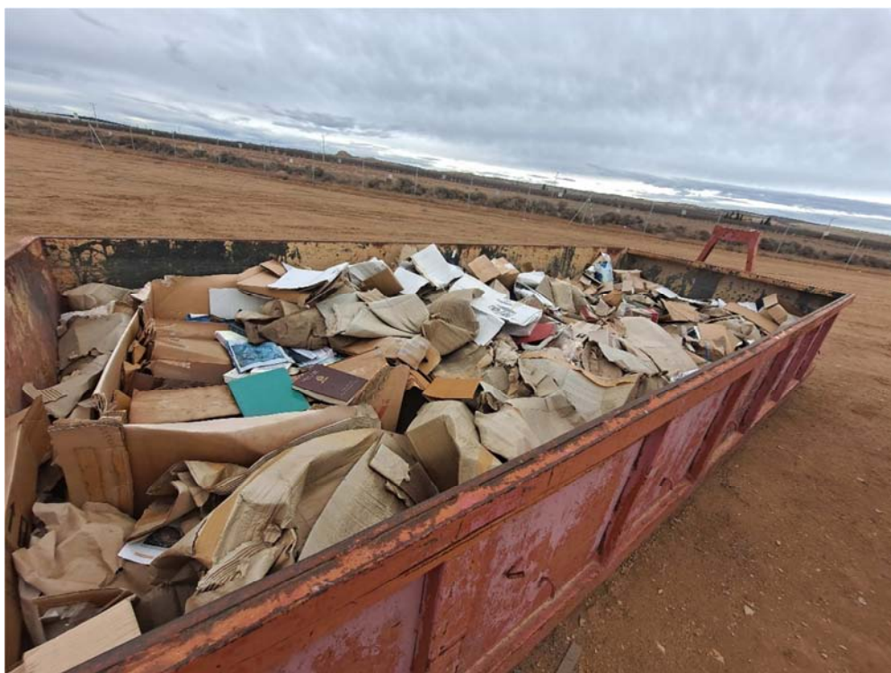
Figura 8.6. Contenedor de cartón donde se han depositado libros ajenos a la planta