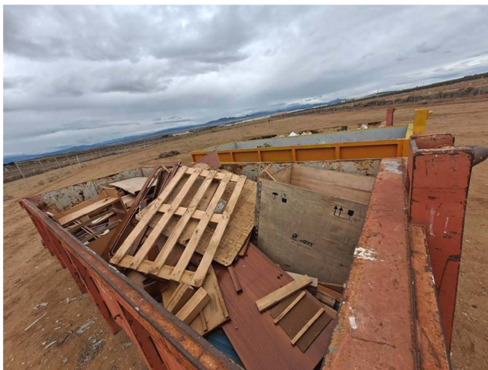
Figura 8.4. Contenedor de madera donde aparecen restos de muebles ajenos a la planta