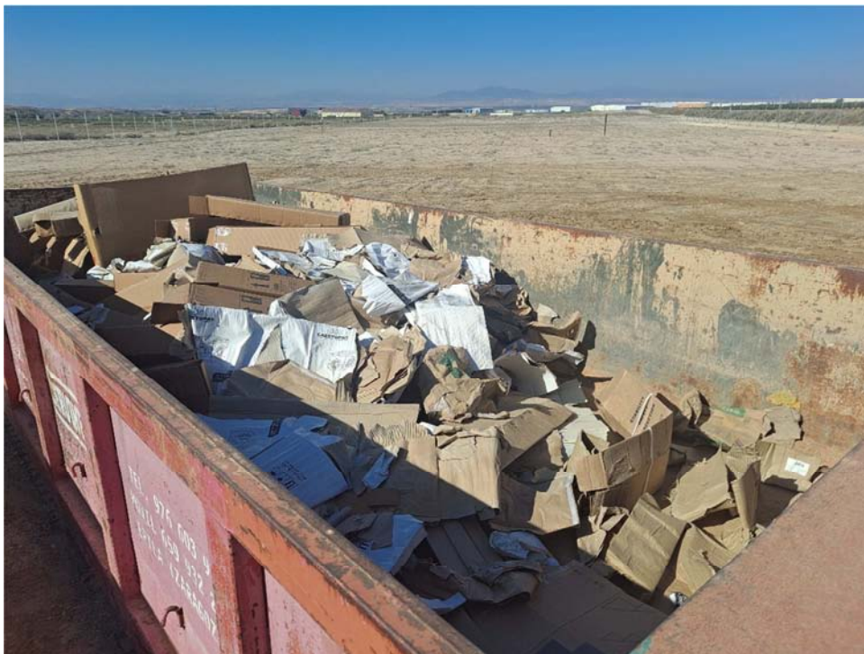
Figura 8.7. Contenedor de residuos con cartones