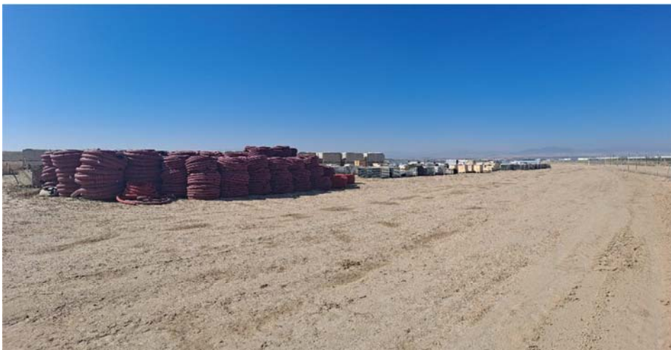
Figura 8.1. Área de acopio de material en el recinto “San Pedro A”