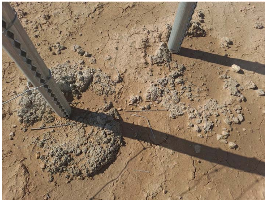
Figura 8.3. Alambres en el suelo en los pasos de fauna, identificados tanto en “San Pedro A” como “San Pedro B”