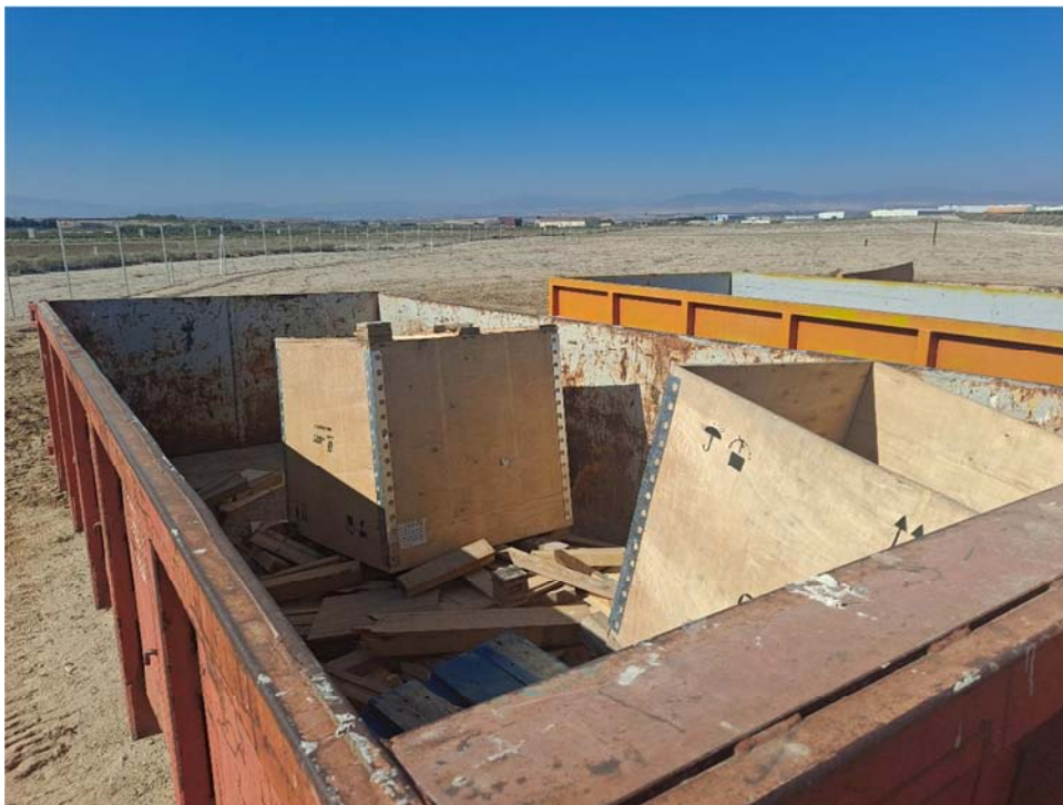
Figura 8.5. Contenedor de residuos con maderas