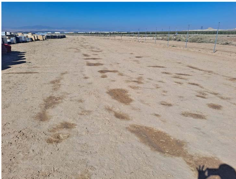
Figura 8.2. Evidencias del riego de las zonas de trasiego de vehículos para evitar la generación de polvo