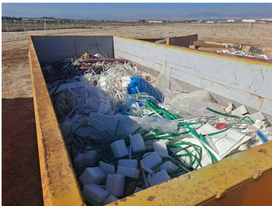
Figura 8.6. Contenedor de residuos con plásticos