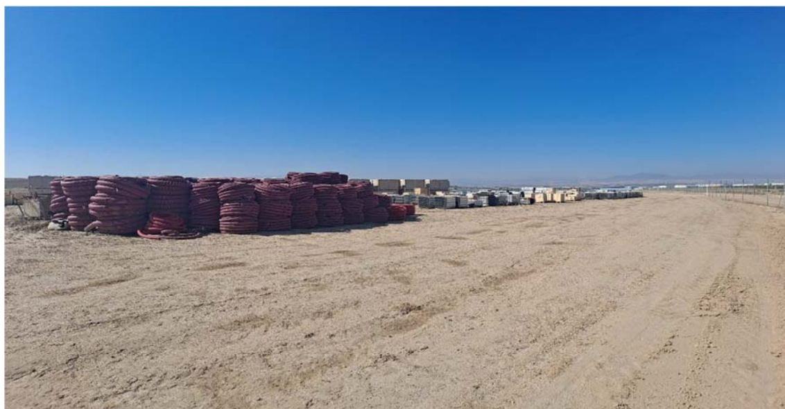
Figura 4.1. Acopios de materiales que se usan en la planta contigua “Épila”

Las únicas labores realizadas en la planta en este periodo corresponden al acopio de materiales que se usan para la construcción de la planta fotovoltaica colindante “Épila”, así como el almacenamiento de los residuos que se generan en la misma.