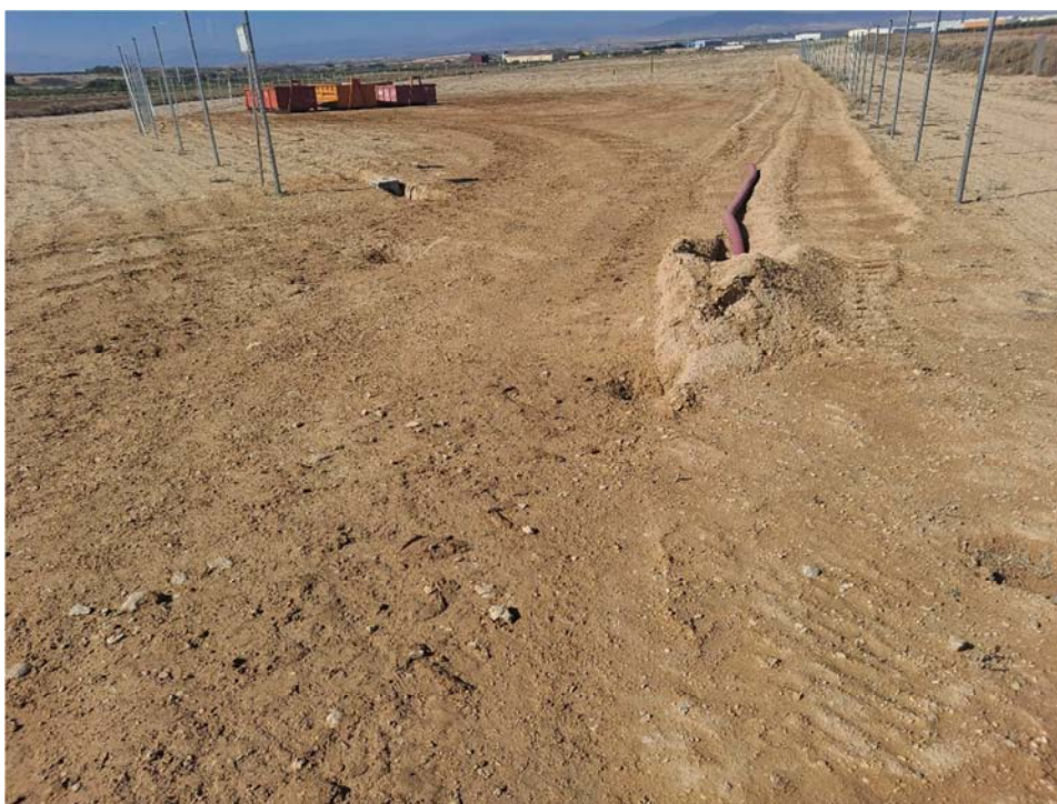
Figura 8.4. Entrada al recinto “San Pedro B”, donde se localizan los contenedores de residuos. Se observa cierta compactación en las zonas de trasiego de vehículos