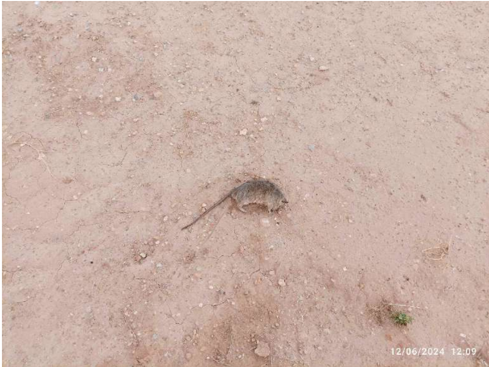
Fotografía 2 fauna identificada en la planta fotovoltaica