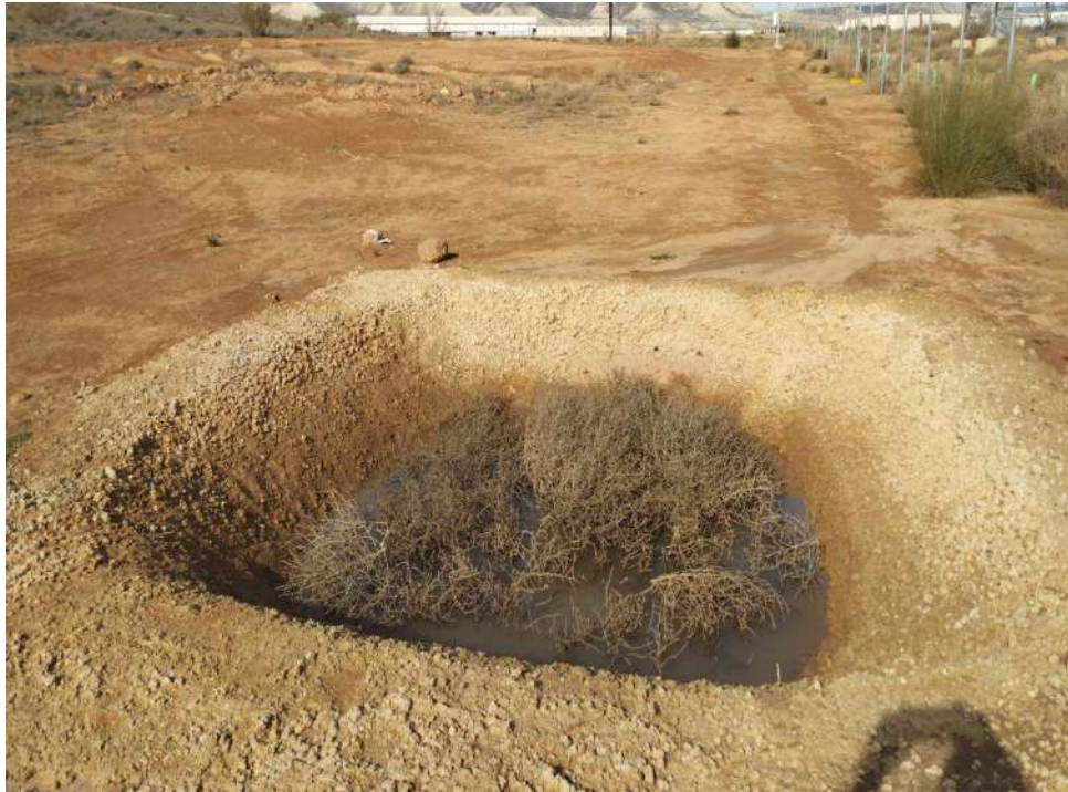
Fotografía 6. Balsa para reptiles con anfibios