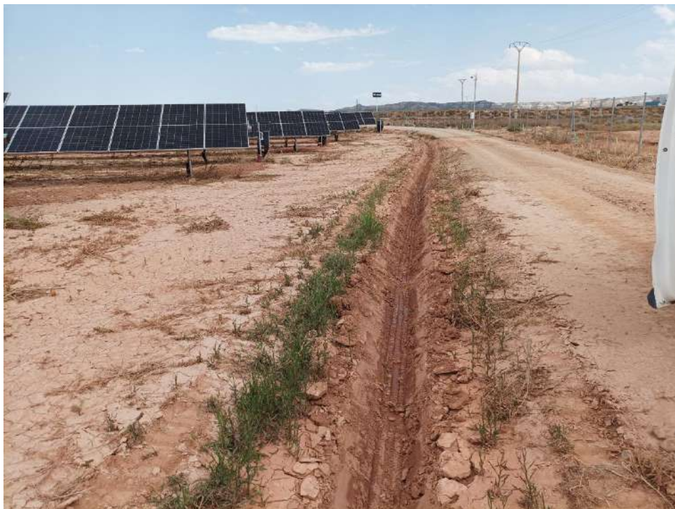
Fotografía 4. Cunetas