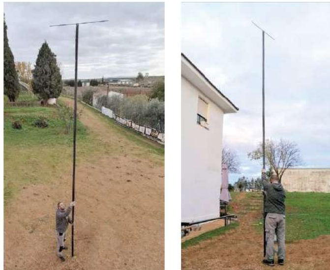
Posaderos. Abajo con tadadera para evitar agua de lluvia

Al presentar forma cilíndrica, muy poco diámetro e ir enterrado con seguridad en el suelo, el posaderen ofrece mínima resistencia a fuertes rachas de viento.