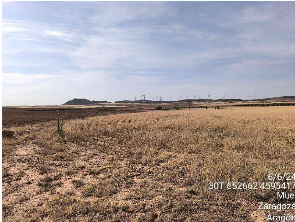
Fotografía 12. Seguimiento avifauna en los alrededores de la planta solar