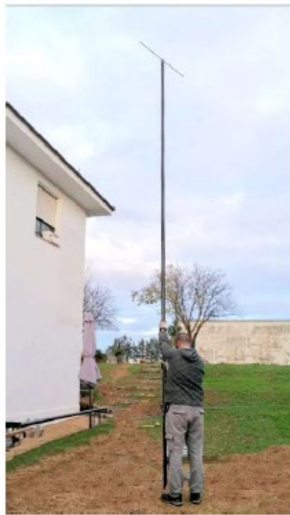
Posaderos. Abajo con tadadera para evitar agua de lluvia