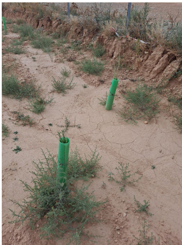
Fotografía 9. Capitanas ( Salsola Kali ) afectando la valla perimetral