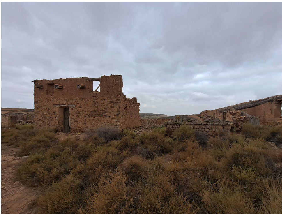
Fotografía 4. Parcela 142, polígono 22 seleccionada para ubicar el primillar