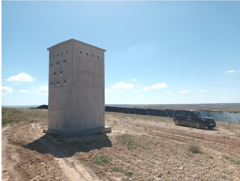
Primillar construido dentro del proyecto

debe a que, por una cuestión de plazos, no se pudo dilatar la construcción del mismo. Durante este mes se ha registrado memoria de propuesta de complementarias a espera de que se regularice la situación.