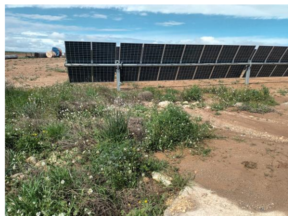
Zonas en las que la vegetación está obstruyendo u ocupando infraestructuras de drenaje.