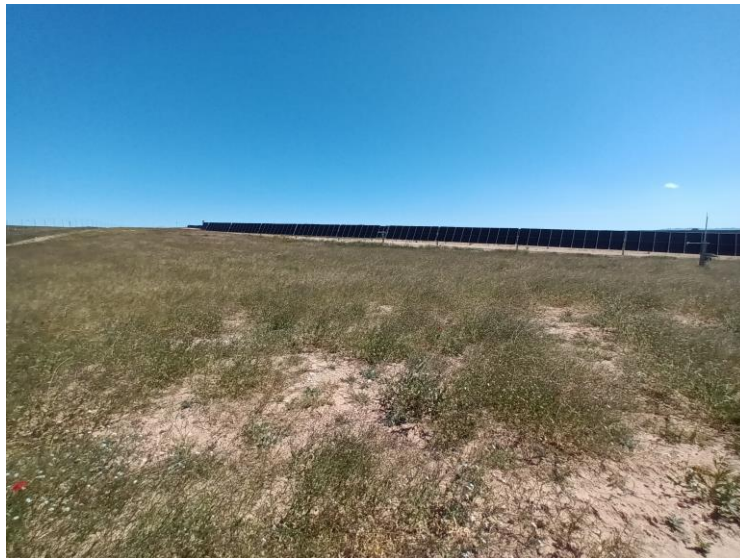
Muestra de la evolución de la vegetación en la superficie no ocupada por los seguidores.

Si bien no toda la superficie de la planta está recuperada, la evolución del proyecto es positiva en este sentido, ya que buena parte presenta cobertura vegetal. Teniendo en cuenta que la superficie del proyecto está en cuesta, este hecho es muy positivo de cara a la prevención de procesos erosivos.