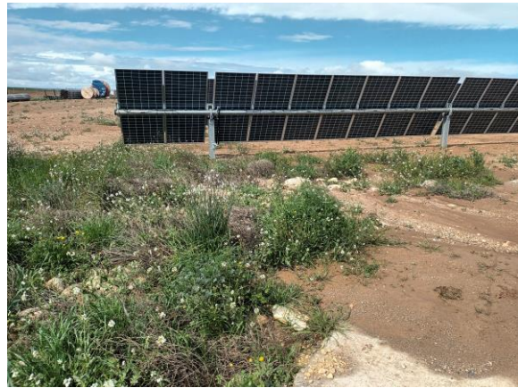
Zonas en las que la vegetación está obstruyendo u ocupando infraestructuras de drenaje.