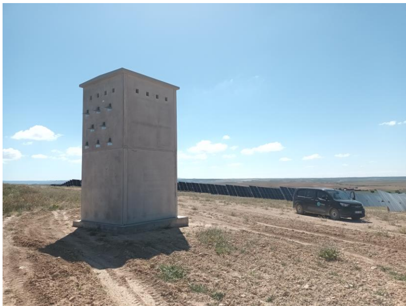
Primillar construido dentro del proyecto

Durante la visita de este mes se realiza la revisión de las cajas nido instaladas en el proyecto, observando que una de ellas ha sido ocupada, si bien no por la especie objetivo (mochuelo), sino por estorninos.