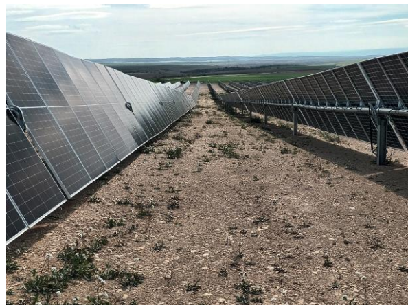
Izqda: drenaje taponado por vegetación. Drcha: estado de la cobertura vegetal en la planta

No se aprecian novedades con respecto al resto de controles y seguimientos realizados.