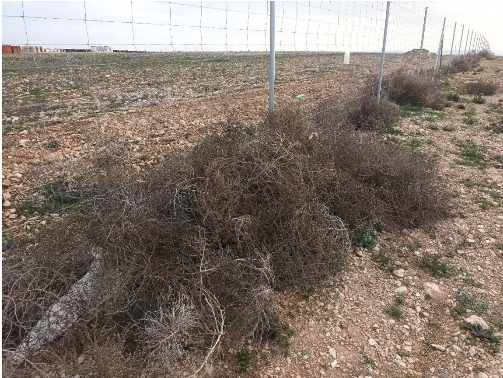
Capitanas en vallado y pantalla vegetal.