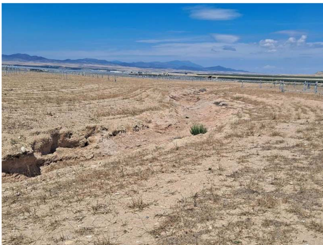
Figura 8.10. Aspecto del barrano que atraviesa la parcela