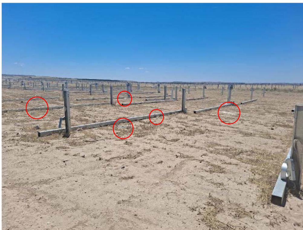
Figura 8.2. Residuos plásticos identificados dentro de la planta