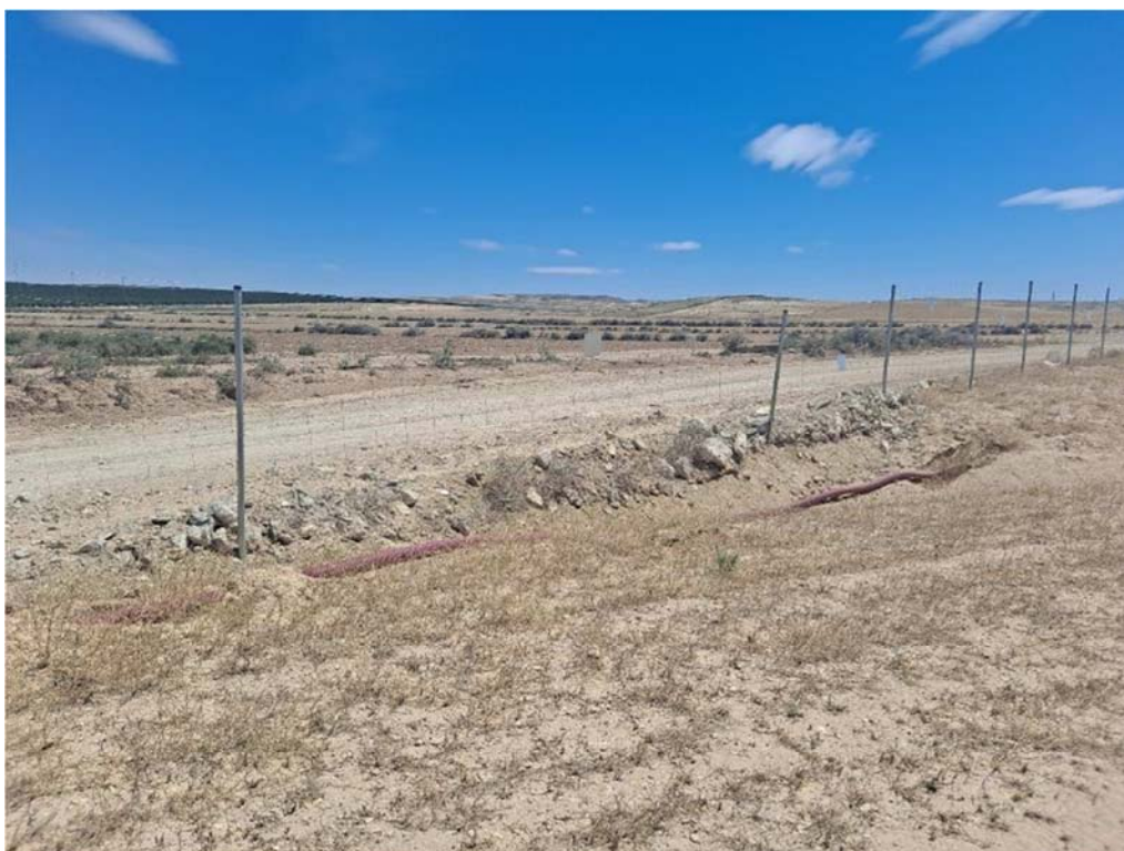
Figura 8.8. Paso inferior del vallado obstruido por los movimientos de tierra