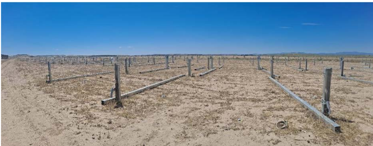
Figura 8.1. Aspecto de la planta a fecha 14-06-24