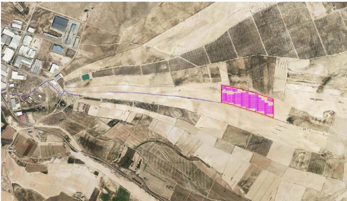
Figura 3.2. Localización de la zona de instalación de la planta solar fotovoltaica "Épila". Base cartográfica PNOA 2021.