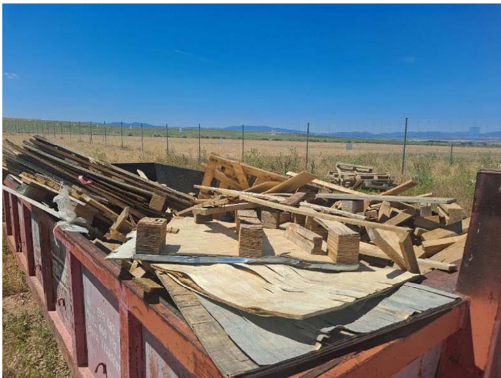
Figura 8.6. Contenedor de madera