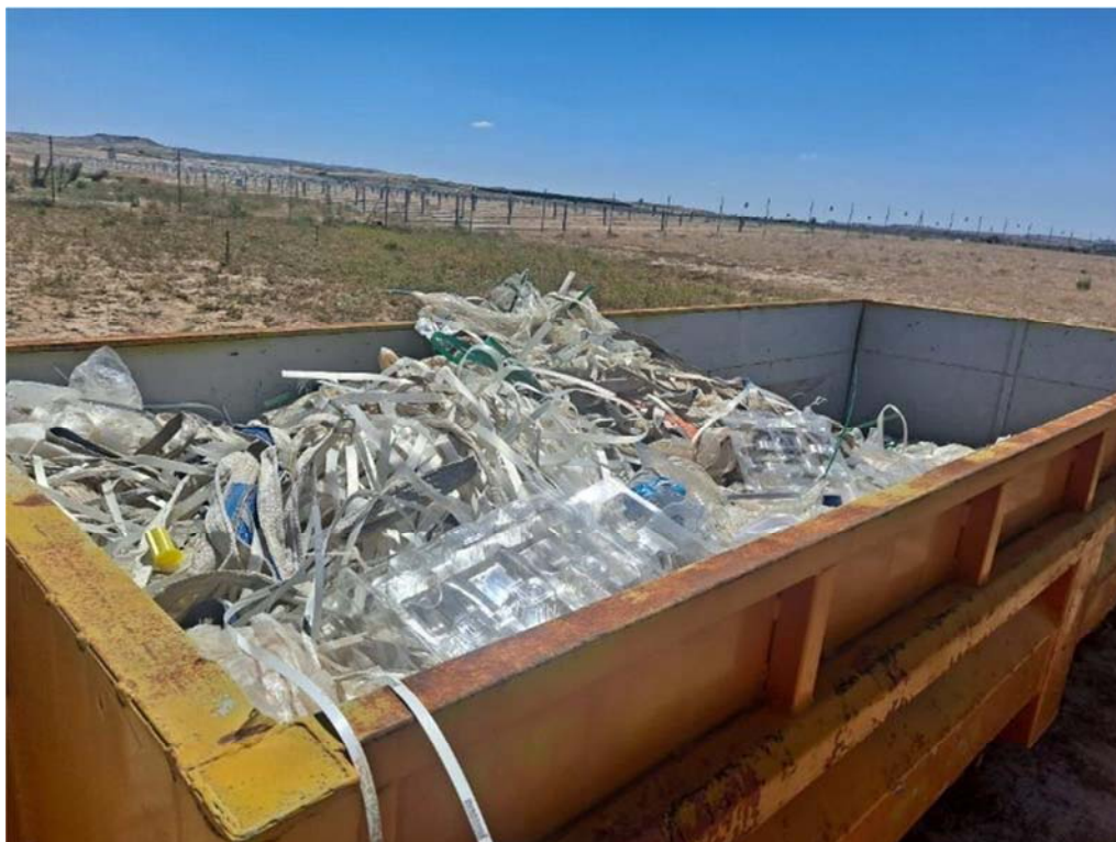
Figura 8.5. Contenedor de plásticos