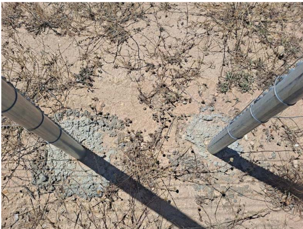
Figura 8.7. Alambres en el suelo junto a los pasos de fauna