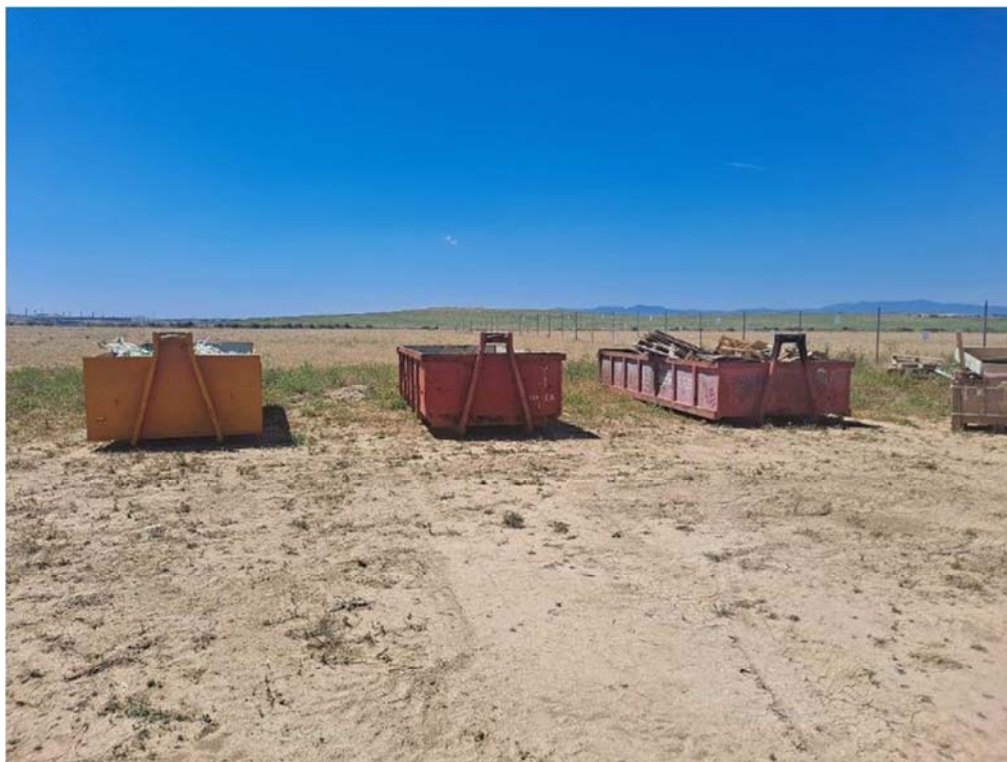
Figura 8.3. Contenedores para residuos, trasladados al espacio existente entre las plantas "San Pedro" y "Épila"