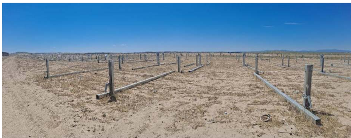
Figura 4.1. Aspecto de la planta

No se tiene constancia de que se hayan realizado trabajos en la planta en este periodo.