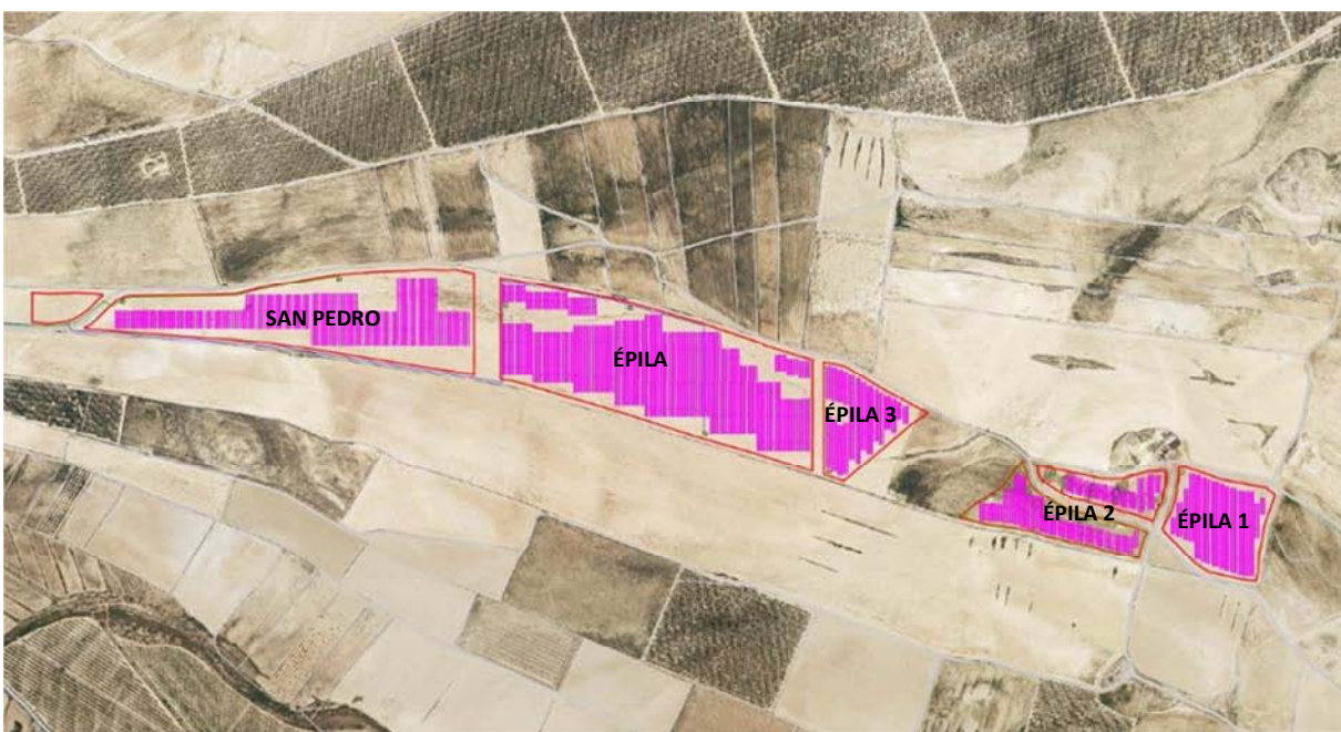
Figura 3.3. Ubicación de las dos plantas fotovoltaicas proyectadas junto a la planta "Épila". Base cartográfica PNOA 2021.