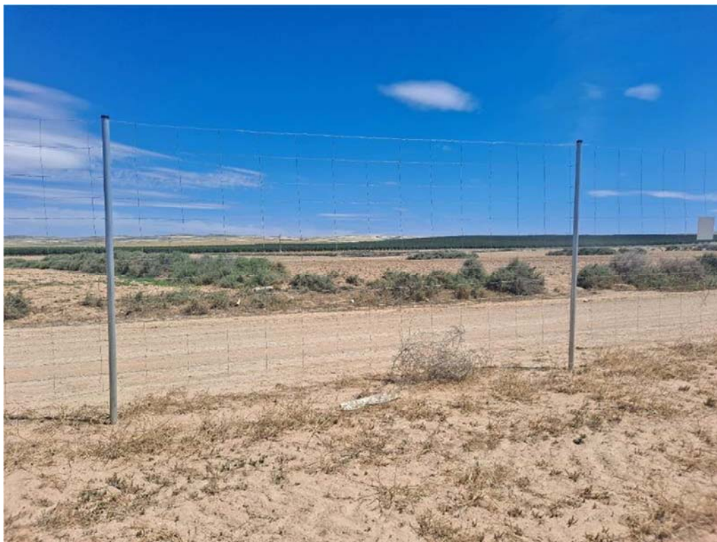
Figura 8.9. Único vano del vallado observado sin placa de visibilidad