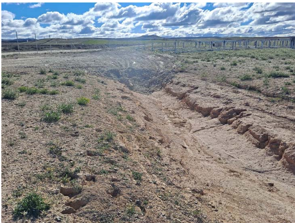
Figura 4.1. Paso sobre el barranco ejecutado en la planta

No se tiene constancia de que se hayan realizado trabajos en la planta en este periodo, más allá de pequeños movimientos de tierra para salvar el barranco que discurre por la planta.