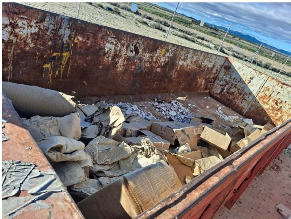
Figura 8.4. Contenedor de cartones