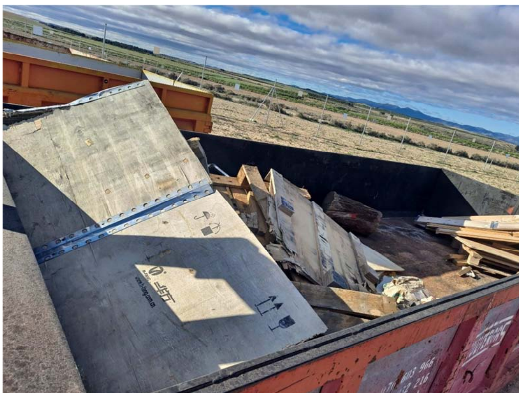
Figura 8.6. Contenedor de madera