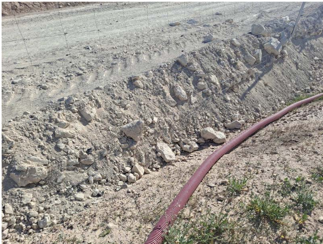
Figura 8.9. Detalle del paso inferior de fauna obstruido