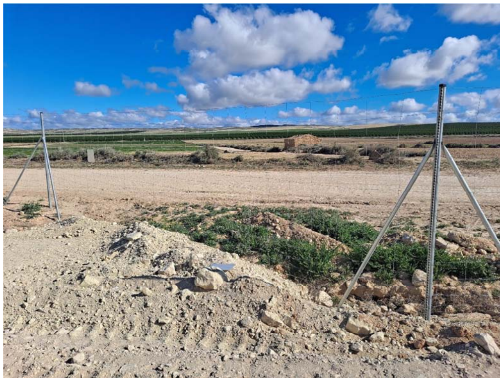
Figura 8.3. Placa de visibilidad caída