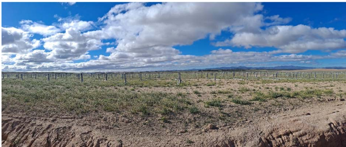
Figura 8.1. Aspecto de la planta a fecha 17-04-24