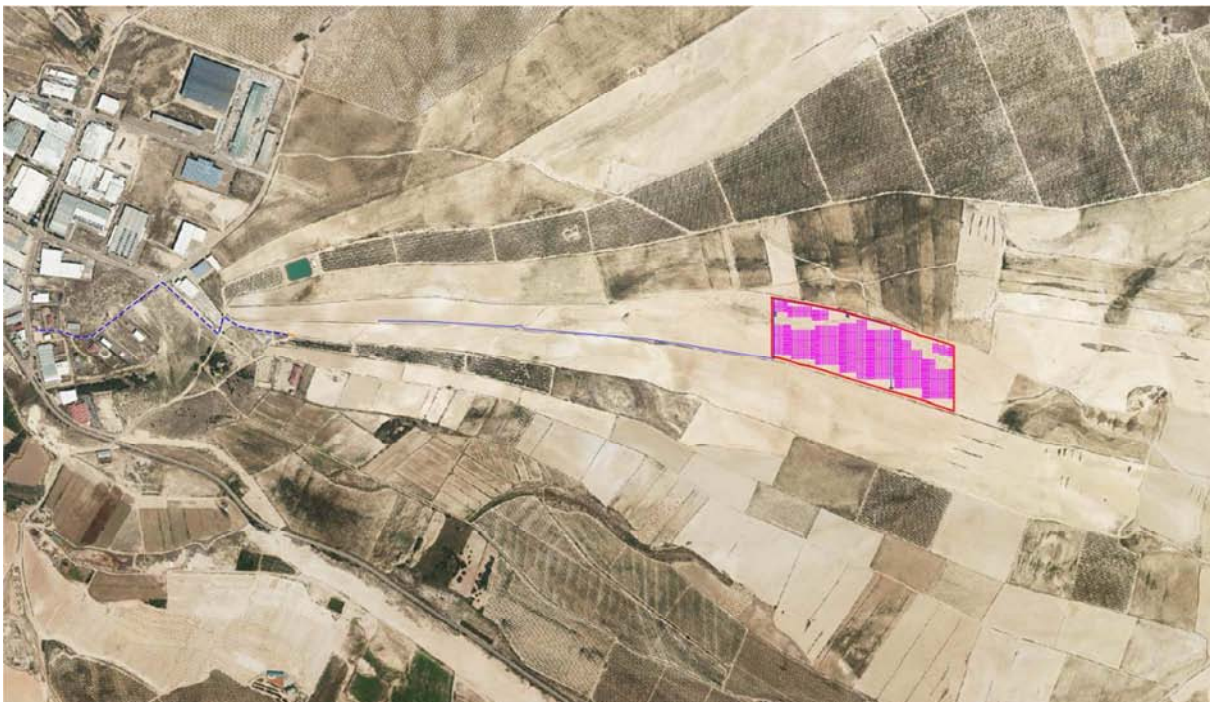
Figura 3.2. Localización de la zona de instalación de la planta solar fotovoltaica "Épila". Base cartográfica PNOA 2021.