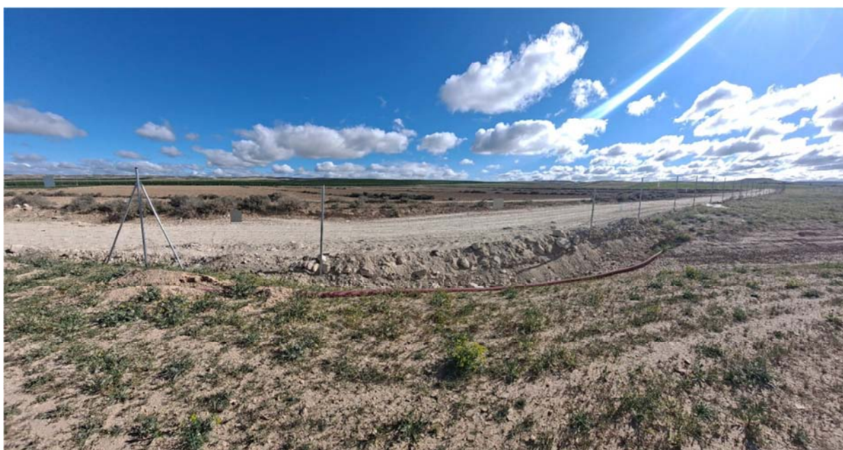
Figura 8.8. Paso inferior del vallado obstruido por los movimientos de tierra