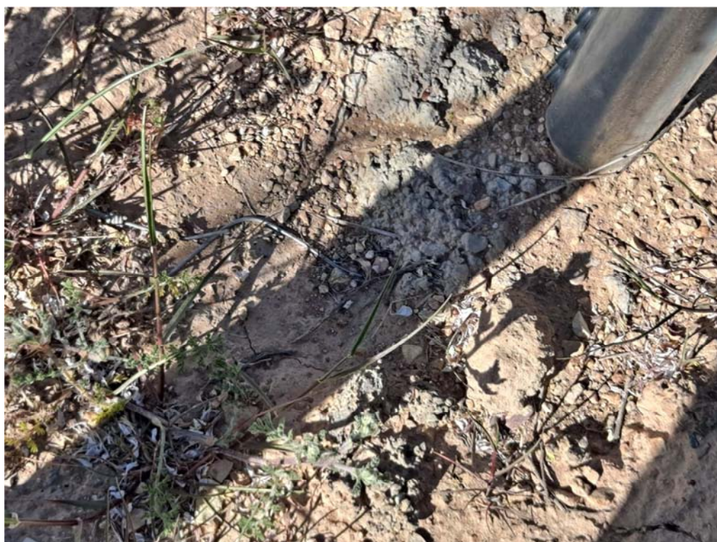
Figura 8.7. Alambres en el suelo junto a los pasos de fauna