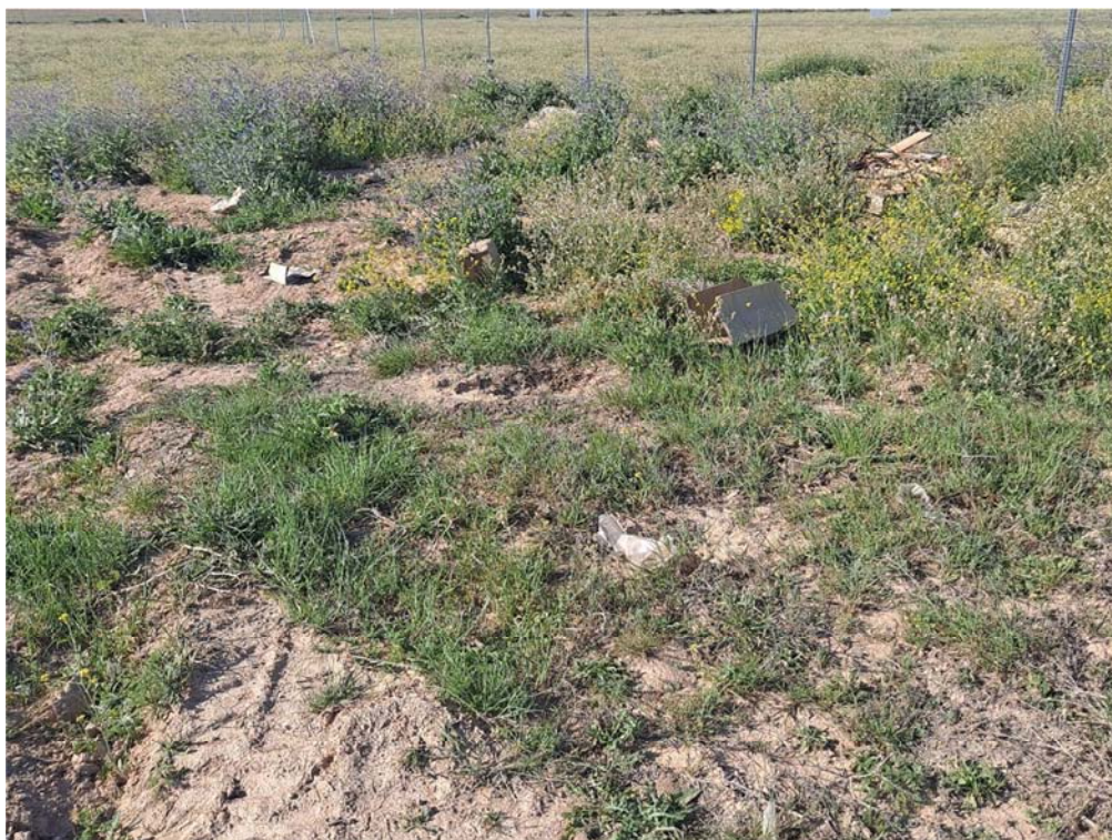
Figura 8.2. Cartones dispersos entre las plantas "San Pedro" y "Épila"