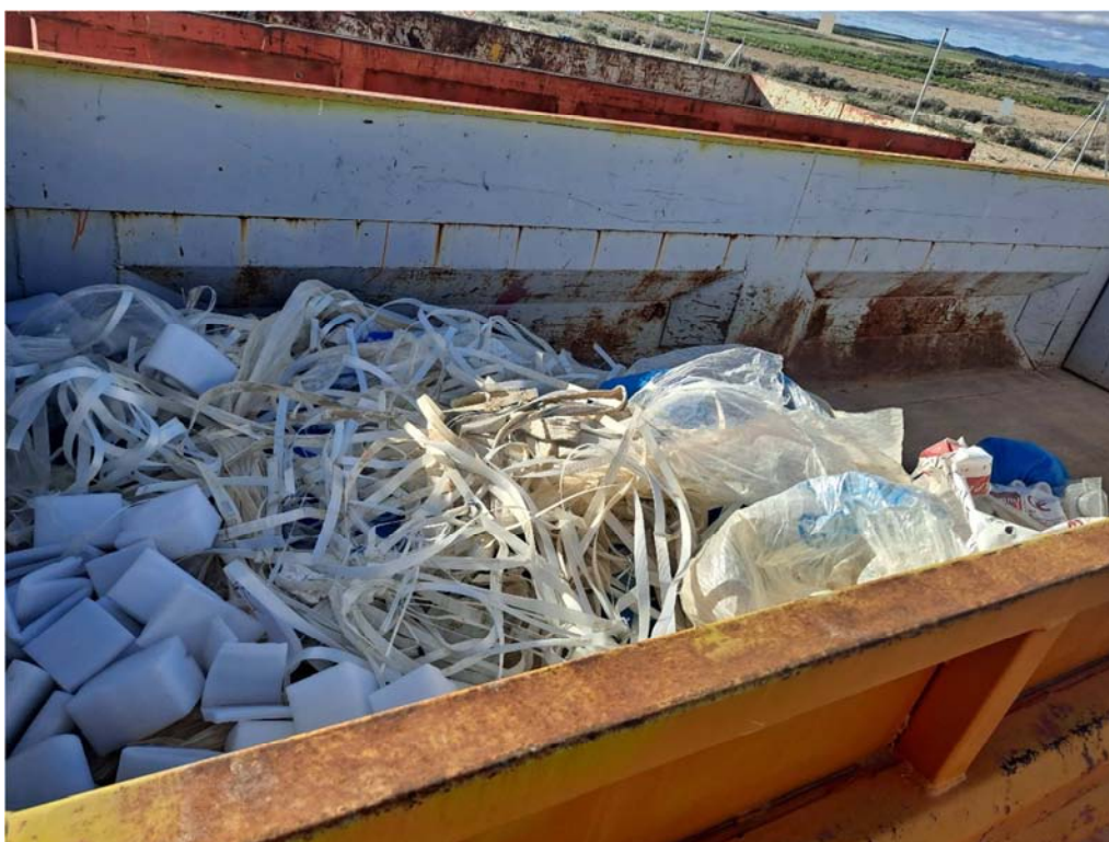
Figura 8.5. Contenedor de plásticos