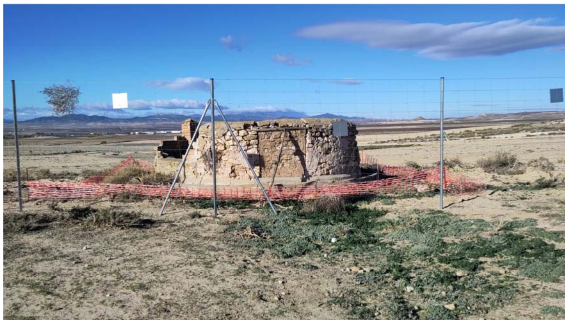
Figura 8.7. Estado de las balizas colocadas para la protección del pozo situado en la planta “Épila 2B”