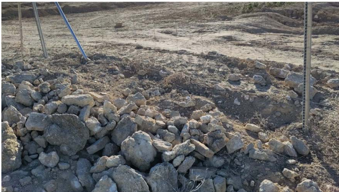
Figura 8.5. Obstrucción del paso inferior del vallado, en el extremo sur del primer ribazo de la planta “Épila 2B”