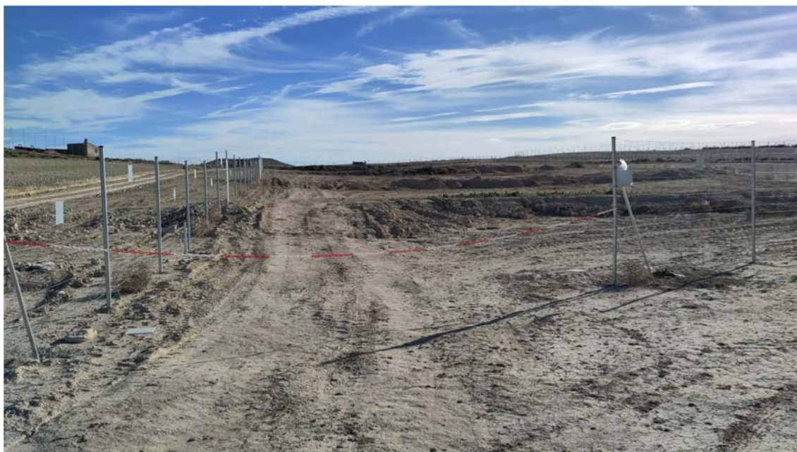
Figura 8.3. Aspecto de la planta “Épila 2B”