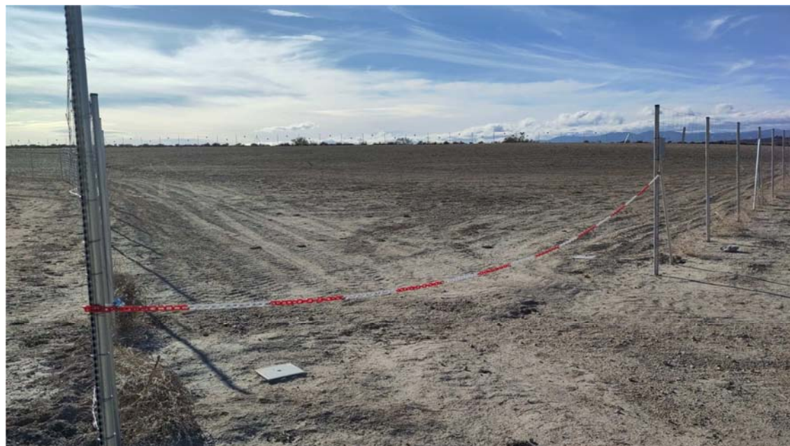
Figura 8.2. Aspecto de la planta “Épila 2A”