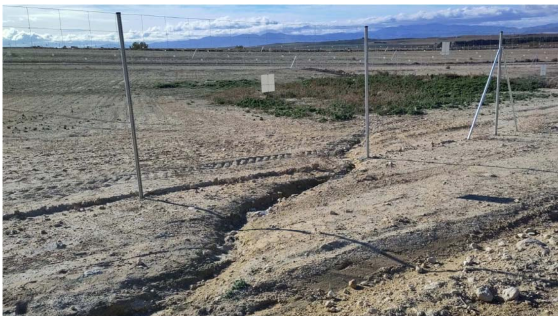
Figura 8.6. Reguero identificado en la planta “Épila 2B” generado por la escorrentía superficial