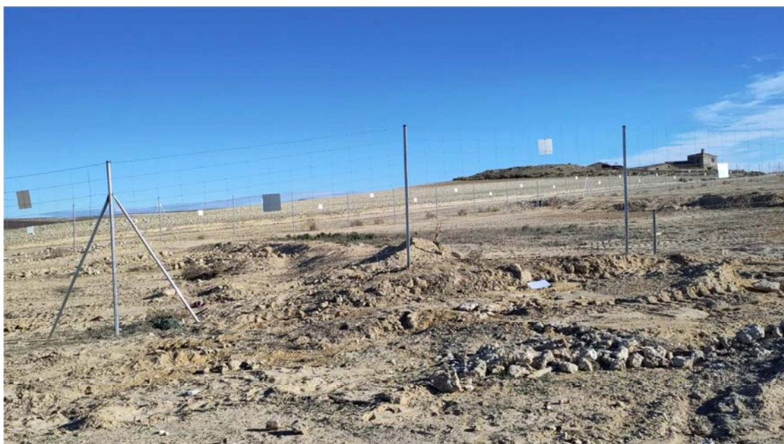
Figura 8.4. Obstrucción del paso inferior del vallado, en el extremo norte del primer ribazo de la planta “Épila 2B”