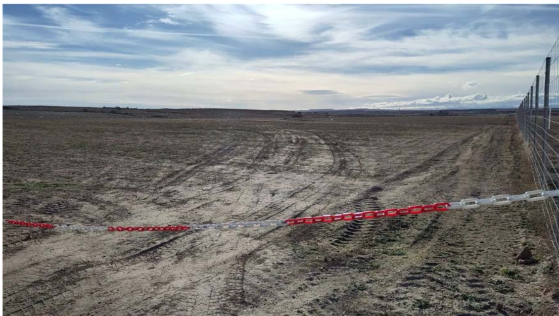
Figura 8.1. Aspecto de la planta “Épila 3”