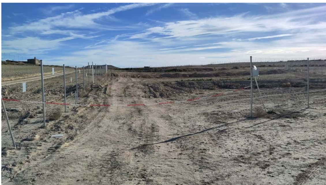
Figura 4.1. Aspecto de la planta “Épila 2B” a fecha 13-12-2023

No se tiene constancia de que se hayan realizado trabajos en la planta en este periodo