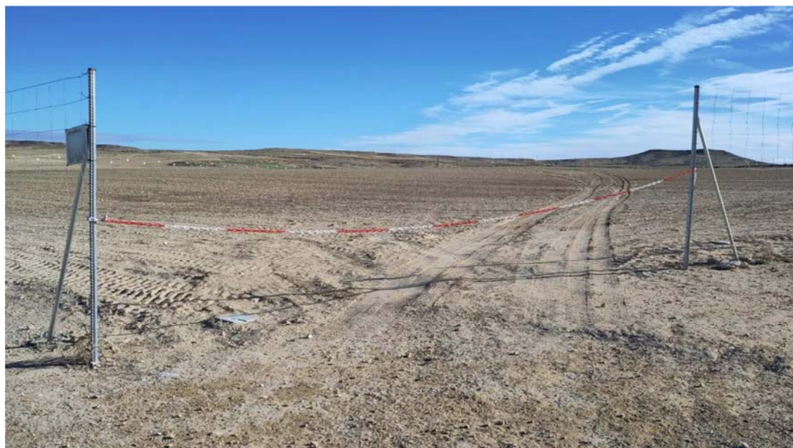
Figura 8.8. Aspecto de la planta “Épila 1”