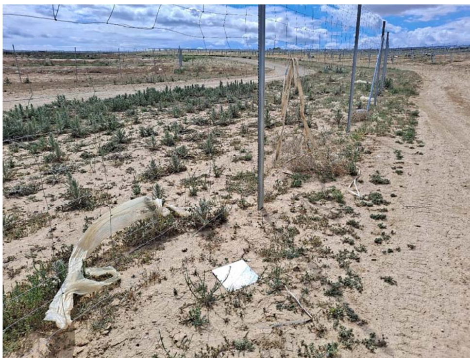
Figura 8.6. Residuos en el suelo de la planta “Épila 2A”