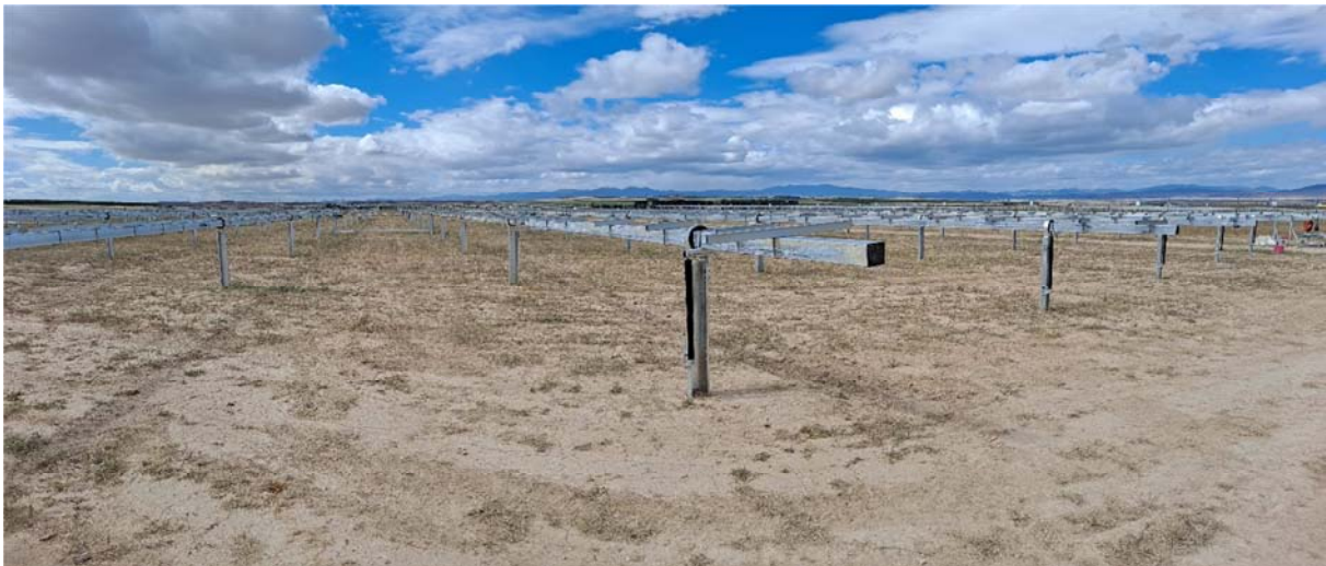
Figura 4.1. Colocación de seguidores en la planta “Épila 3”