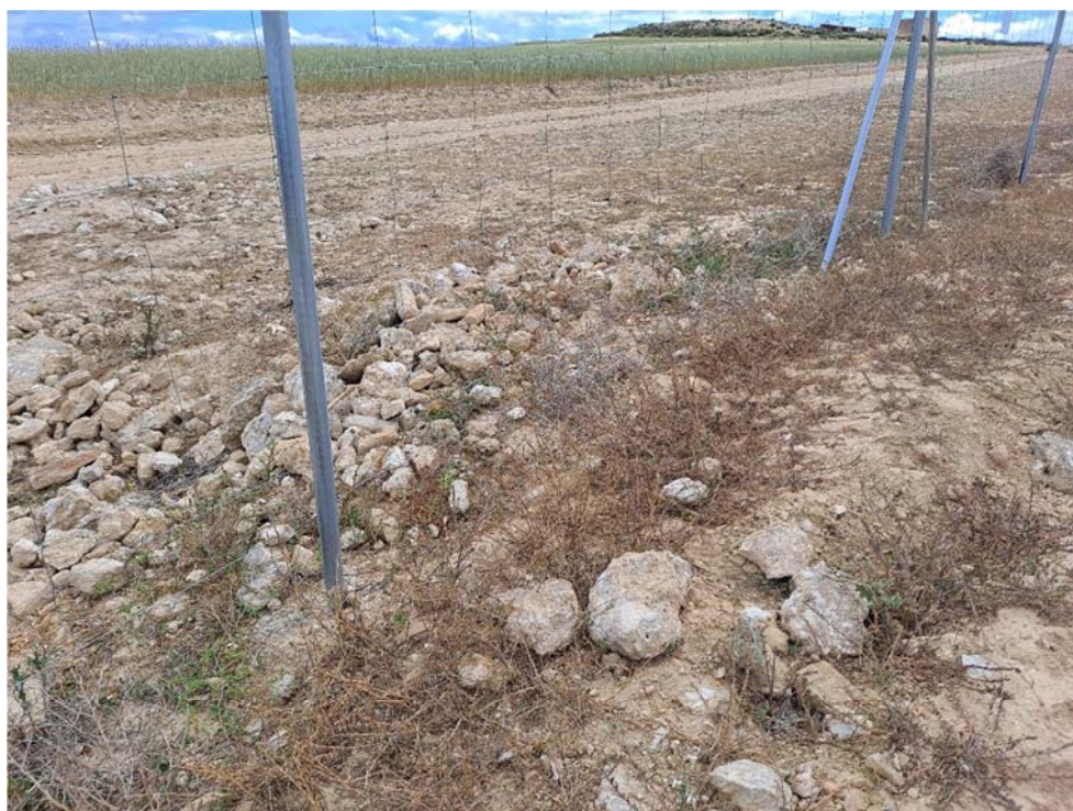
Figura 8.8. Paso inferior del vallado obstruido en la planta “Épila 2B”