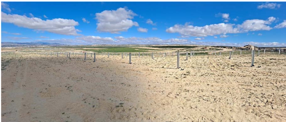
Figura 8.3. Aspecto de la planta “Épila 2A”, con algunos seguidores colocados