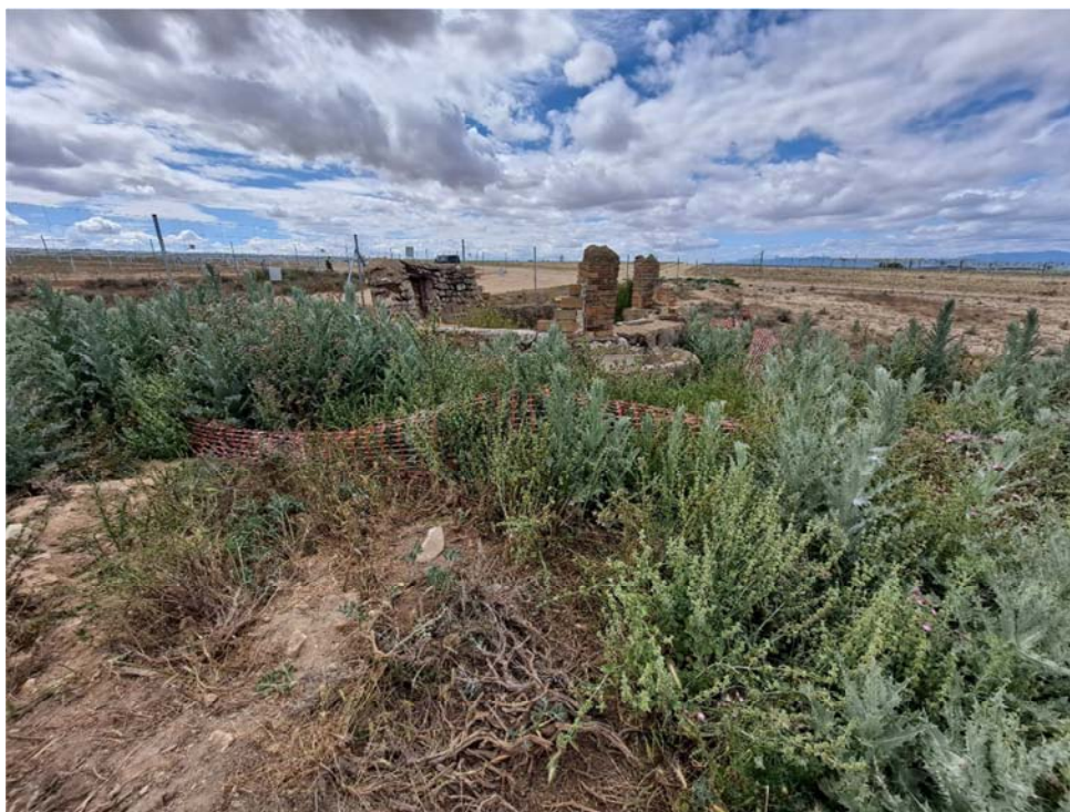
Figura 8.9. Aspecto del pozo y de balizado, casi oculto por la vegetación