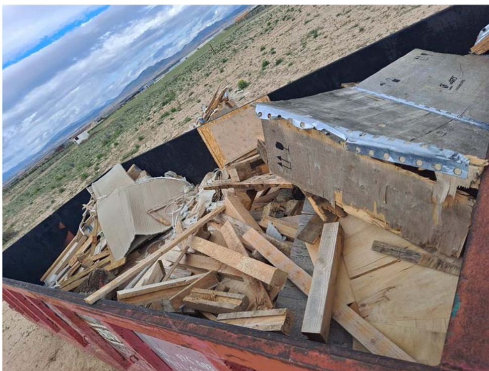
Figura 8.14. Contenedor de madera, situado en la planta cercana “San Pedro B”