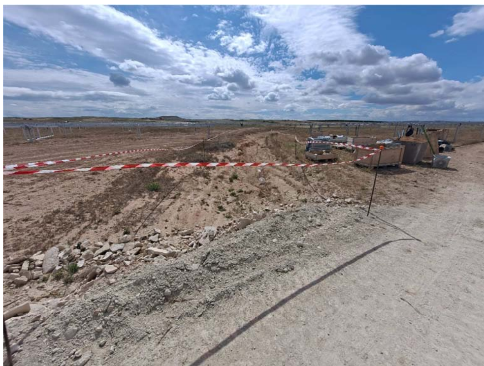
Figura 8.2. Barranco que atraviesa la planta “Épila 3”, balizado. Puntualmente obstruido para permitir el paso