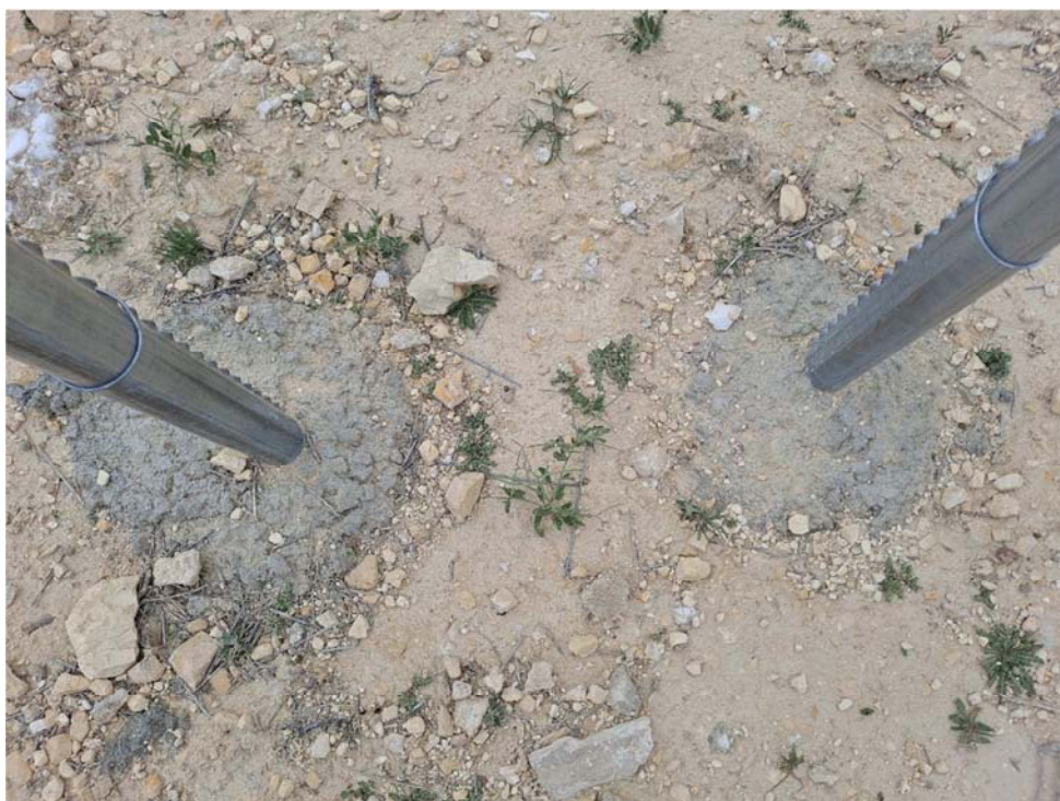
Figura 8.4. Alambres en el suelo en los pasos de fauna en la planta “Épila 3”, aunque también se han identificado en las plantas “Épila 2A” y “Épila 2B”