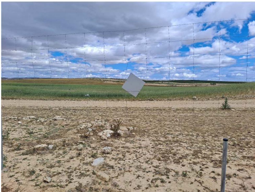
Figura 8.7. Placa con un solo punto de anclaje en la planta “Épila 2B”