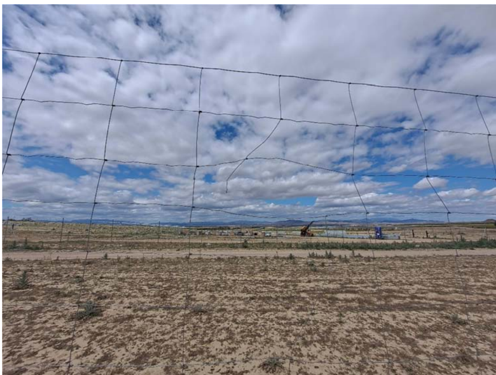
Figura 8.10. Vallado roto al arrancarse una de las placas de visibilidad, dando lugar a elementos punzantes, en la planta “Épila 2B”