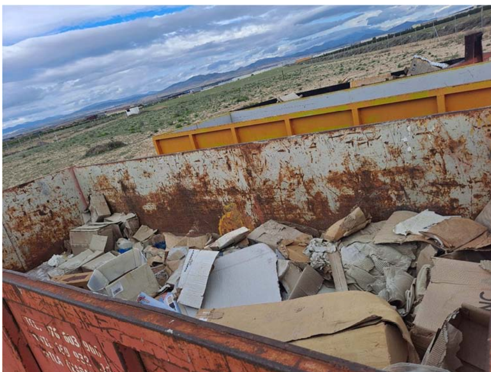
Figura 8.12. Contenedor de cartón, situado en la planta cercana “San Pedro B”