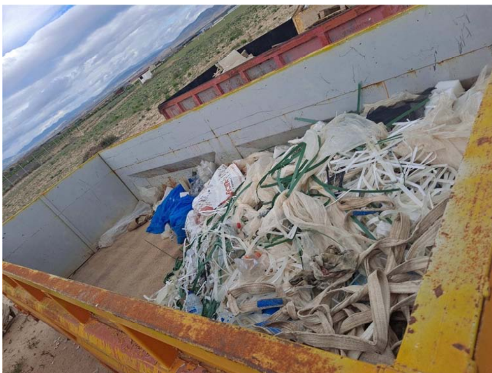
Figura 8.13. Contenedor de plásticos, situado en la planta cercana “San Pedro B”