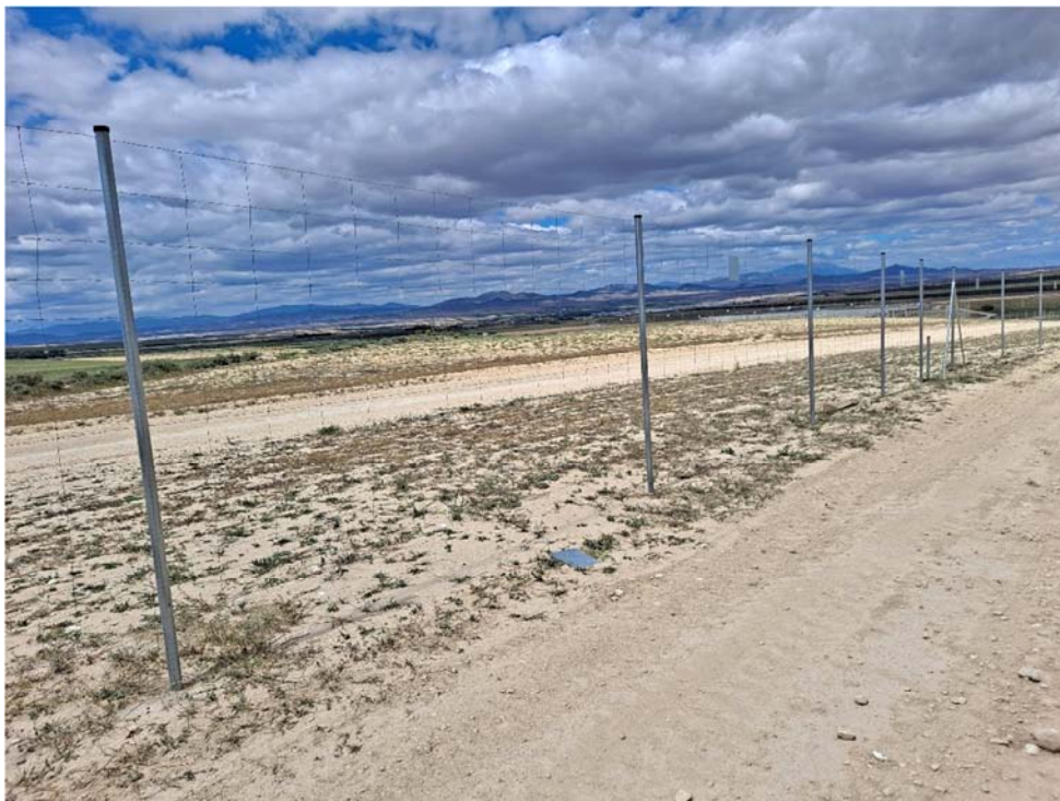
Figura 8.11. Ausencia de algunas placas de visibilidad en la planta “Épila 1”