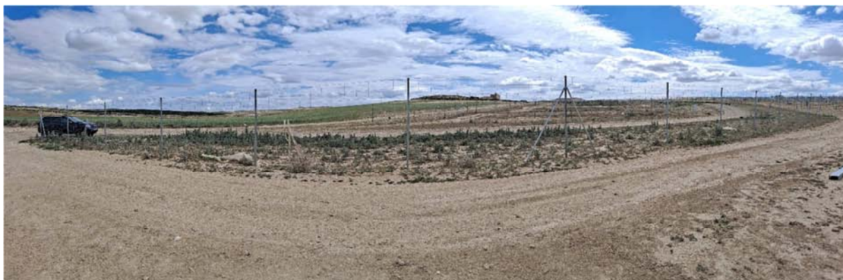
Figura 8.5. Varios vanos del vallado sin placas de visibilidad ausente, en la planta “Épila 2A”