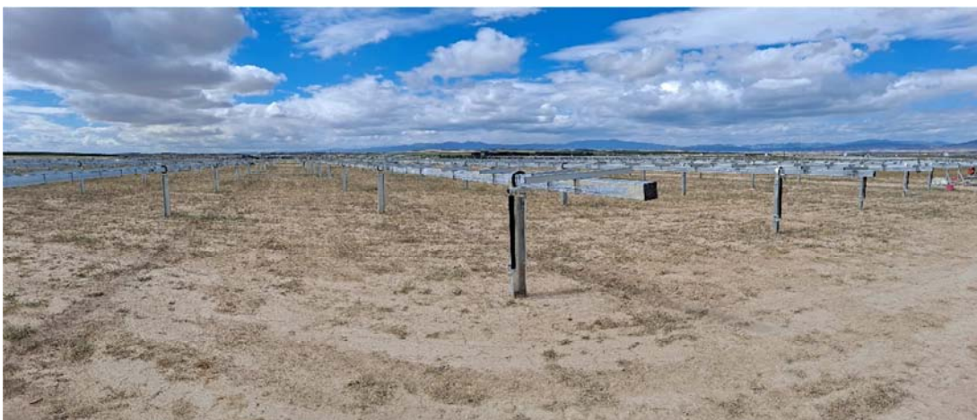
Figura 8.1. Aspecto de la planta “Épila 3”, donde han colocado los seguidores