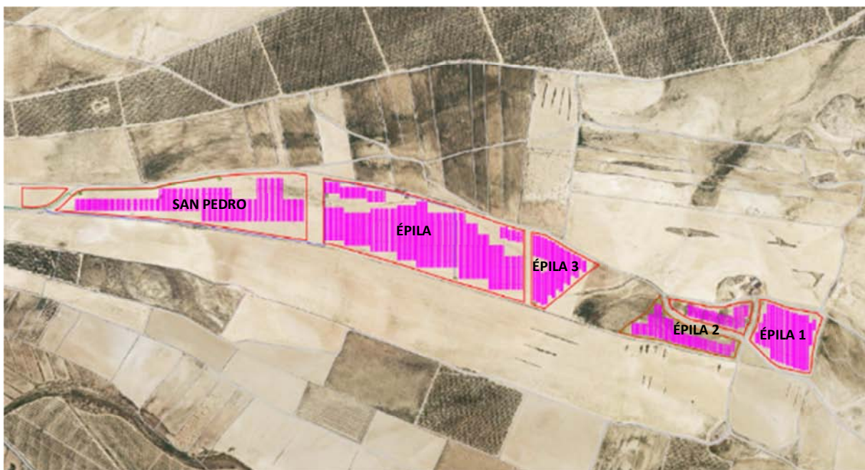
Figura 3.3. Ubicación de las dos plantas fotovoltaicas proyectadas junto a la planta “Épila 123”. Base cartográfica PNOA 2021.