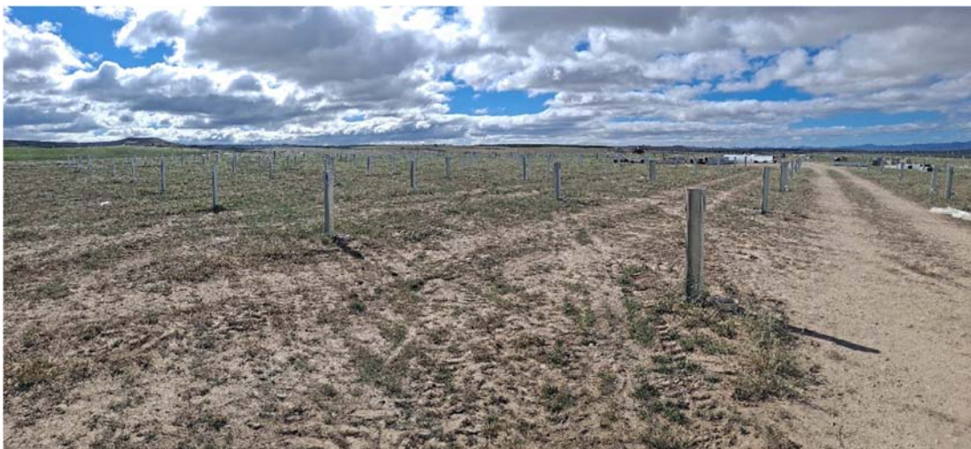
Figura 8.1. Aspecto de la planta “Épila 3”, donde han hincado los perfiles verticales