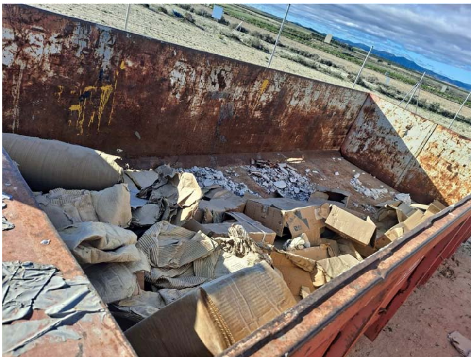
Figura 8.14. Contenedor de cartón, situado en la planta cercana “San Pedro B”