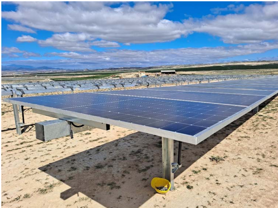
Figura 4.1. Colocación de seguidores y placas fotovoltaicas en la planta “Épila 1”