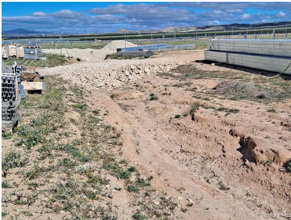
Figura 8.3. Relleno puntual del barranco que atraviesa la planta “Épila 3” para permitir el paso de vehículos