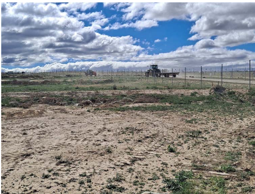
Figura 8.8. Polvo generado por la circulación de vehículos