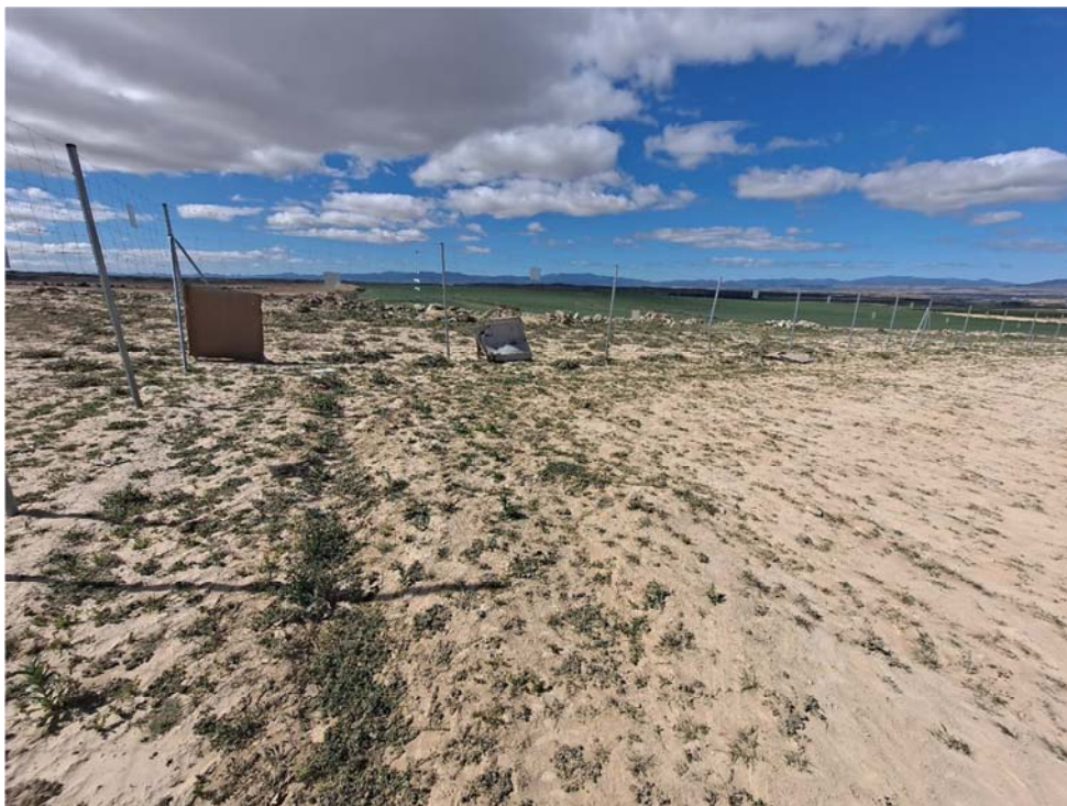
Figura 8.12. Cartones dispersos en la planta “Épila 1”