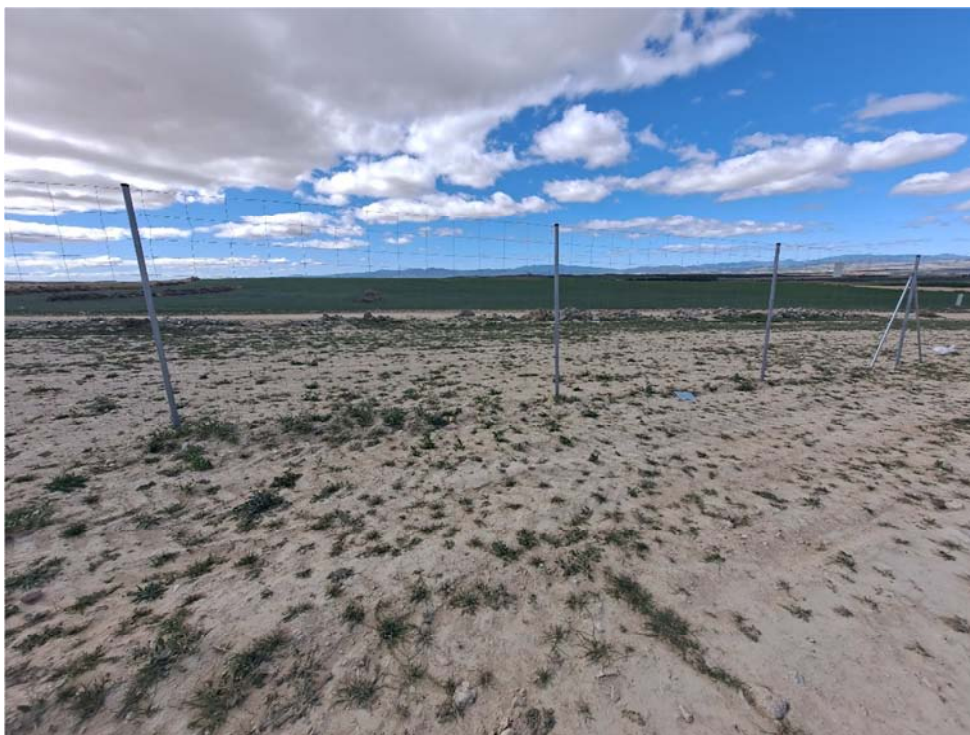
Figura 8.13. Dos vanos consecutivos sin placa de visibilidad en el límite sur del vallado de la planta “Épila 1”