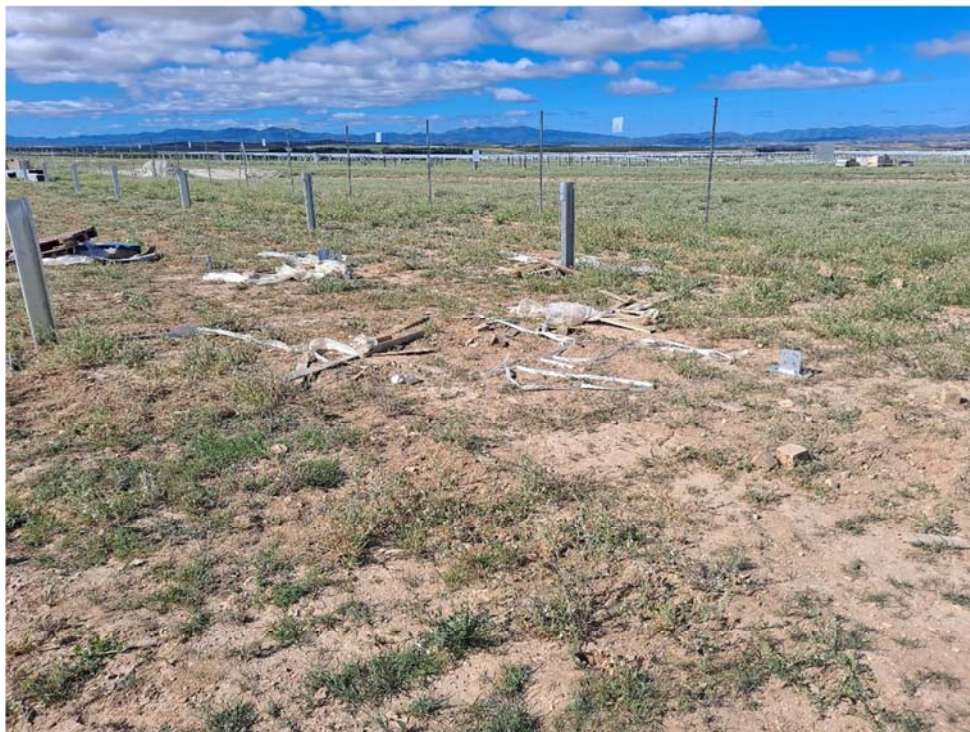
Figura 8.4. Residuos en el suelo de la planta “Épila 3”