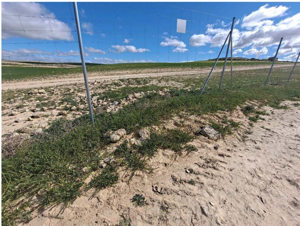
Figura 8.9. Paso inferior del vallado obstruido en la planta “Épila 2B”