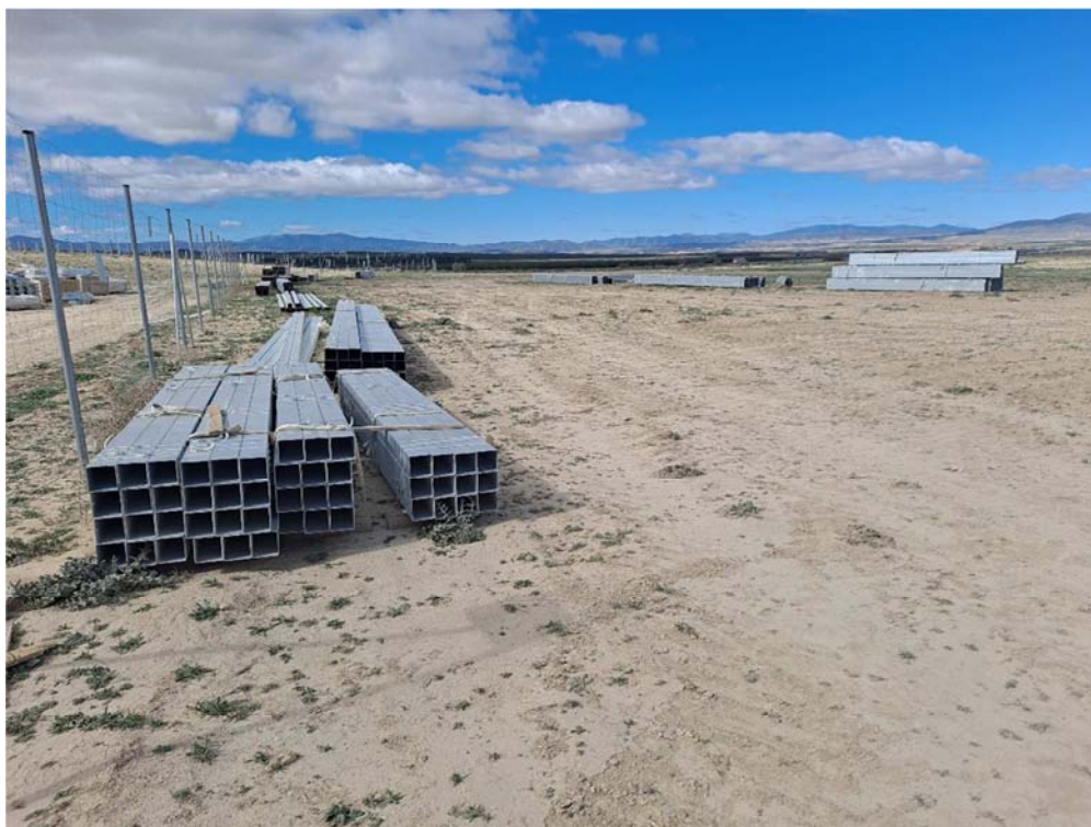
Figura 8.5. Acopios puntuales de materiales junto a la planta “Épila 2A”