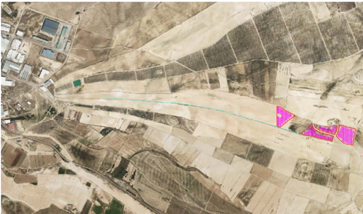
Figura 3.2. Localización de la zona de instalación de la planta solar fotovoltaica “Épila 123”. Base cartográfica PNOA 2021.