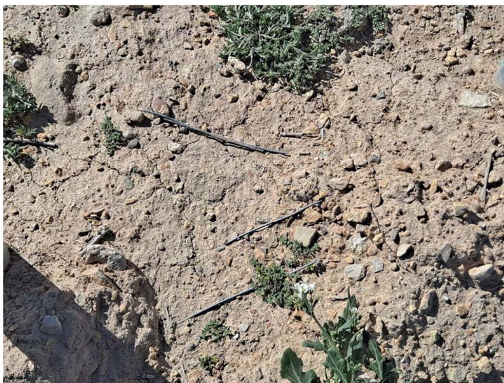
Figura 8.2. Alambres en el suelo en los pasos de fauna en la planta “Épila 3”, aunque también se han identificado en las plantas “Épila 2A” y “Épila 2B”