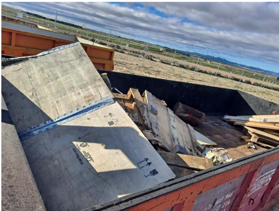
Figura 8.16. Contenedor de madera, situado en la planta cercana “San Pedro B”