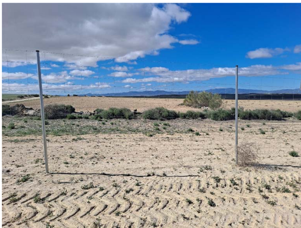
Figura 8.6. Placa de visibilidad ausente, en el límite sur del vallado de la planta “Épila 2A”