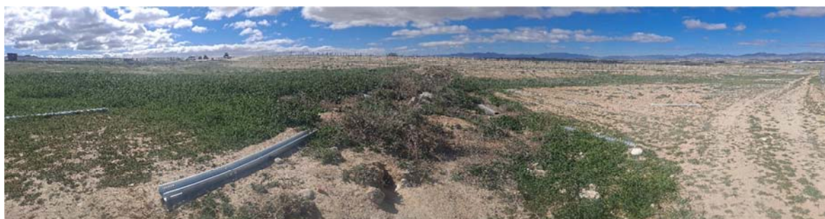
Figura 8.10. Aspecto de la planta “Épila 2B”, con los perfiles repartidos