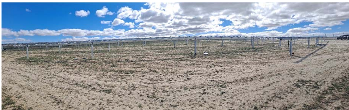
Figura 8.11. Aspecto de la planta “Épila 1”, donde se han instalado los seguidores y algunos paneles fotovoltaicos