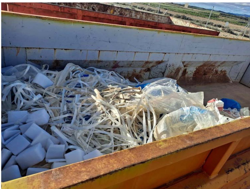
Figura 8.15. Contenedor de plásticos, situado en la planta cercana “San Pedro B”