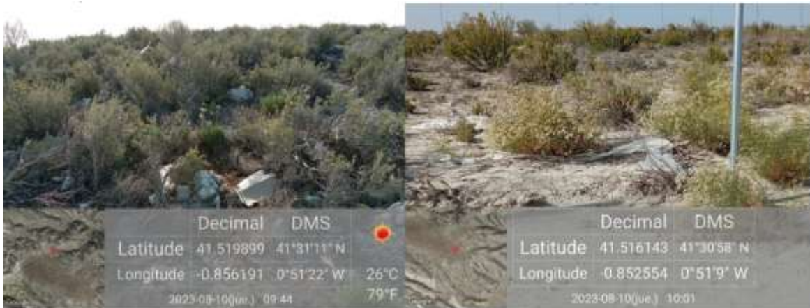
Ilustración 2. Basura del vial al oeste de la parcela 3 (izquierda) y basura de la zona sur de la parcela 3 (derecha).