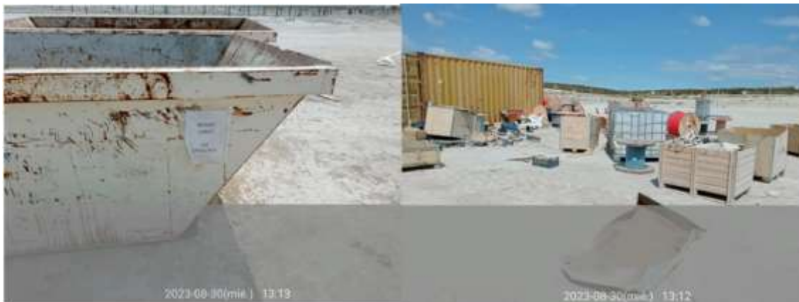
Ilustración 7. Cartón en el límite de vegetación del vial que recorre la zona este de la parcela sur.