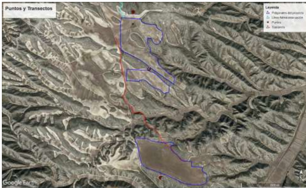
Ilustración 10. Puntos de observación y transectos para el informe preliminar de avifauna.

Los transectos se han realizado en coche a una velocidad inferior a 20 km/h y se ha anotado cada ejemplar avistado y/o escuchado. Los puntos seleccionados se han realizado con una duración de 10 minutos de espera en la cual también se anotan todos los ejemplares avistados y/o escuchado.