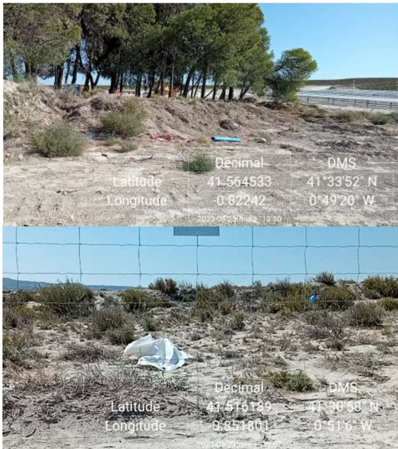
Ilustración 6. Residuos desperdigados por la parcela 1 (arriba) y residuos en la zona sur de la parcela 3.