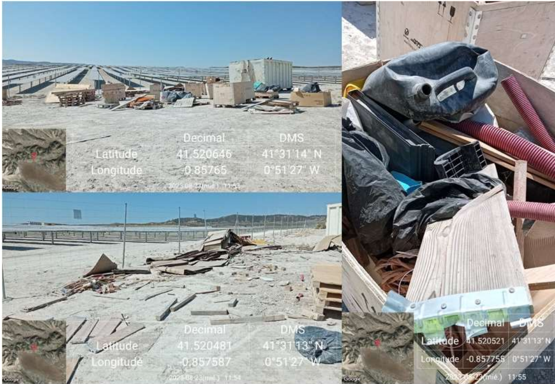
Ilustración 5. Estado del punto limpio de la parcela 3, sin señalizar y con residuos mezclados.