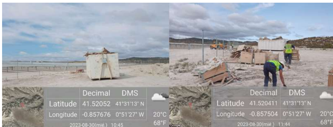
Ilustración 8. Punto limpio de la parcela 3 señalado y parte del equipo de IASOL recogiendo y separando los diferentes residuos en sus correspondientes contenedores.