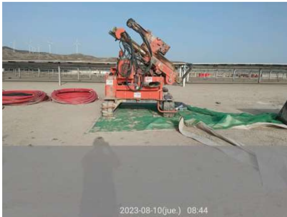
Ilustración 3. Máquina correctamente estacionada en la zona de parking con plástico protector.