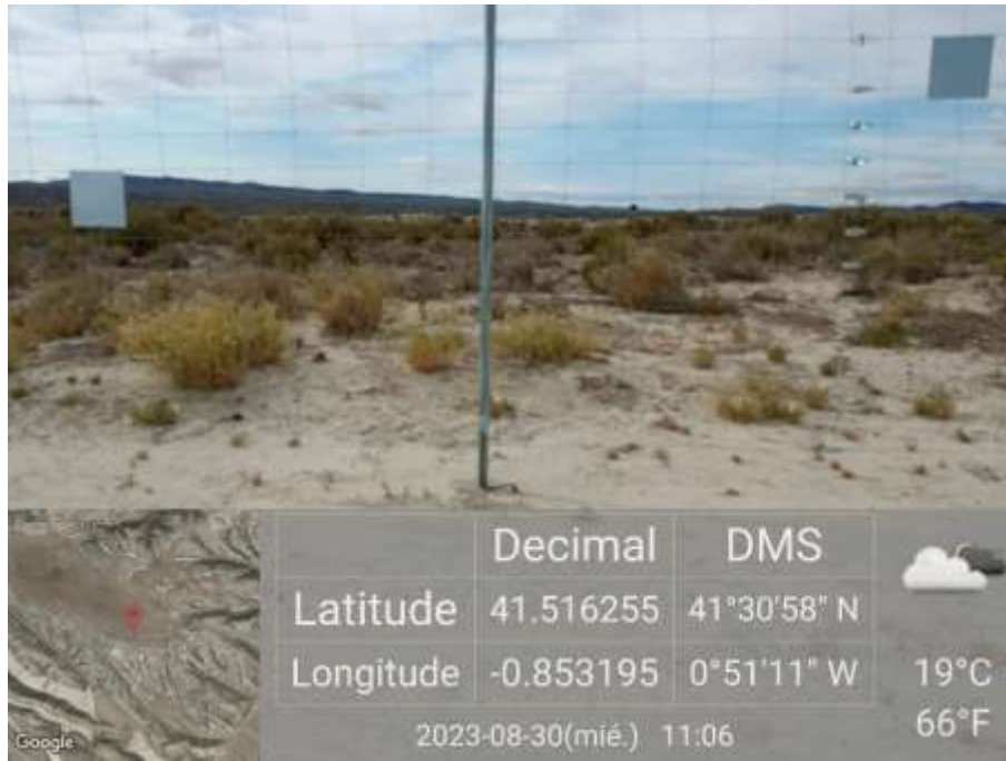
Ilustración 9. Zona sur de la parcela 3 notablemente más limpia.