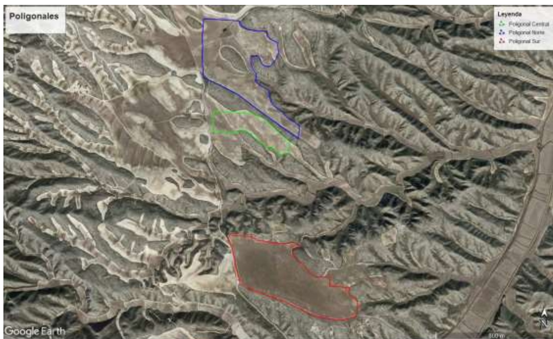
Ilustración 1. Poligonales del parque solar Acampo Estrén.

El PFV “Acampo Estrén” evacuará su energía generada en una subestación transformadora “Acampo Estrén” 45/30 kv que se construirá dentro de la planta del norte. Se prevé un edificio de control y celdas con una sola planta de 250 m 2 de superficie, que dispondrá de sala de control, sala de celdas de 30 kv y sala de comunicaciones. De la subestación transformadora 30/45kv de la planta solar partirá una línea aérea subterránea de 45kv al punto de entrega, situado en la subestación eléctrica Cartujos 45kv, propiedad de la compañía eléctrica. La línea soterrada en el tramo inicial desde la acometida de la SET Cartujos comprende dos tramos que en total presentan una longitud de 327 m, el segundo tramo estará formado por una línea aérea de 2544 m, y un último tramo soterrado hasta la SET “Acampo Estrén” de 5403,6 m.