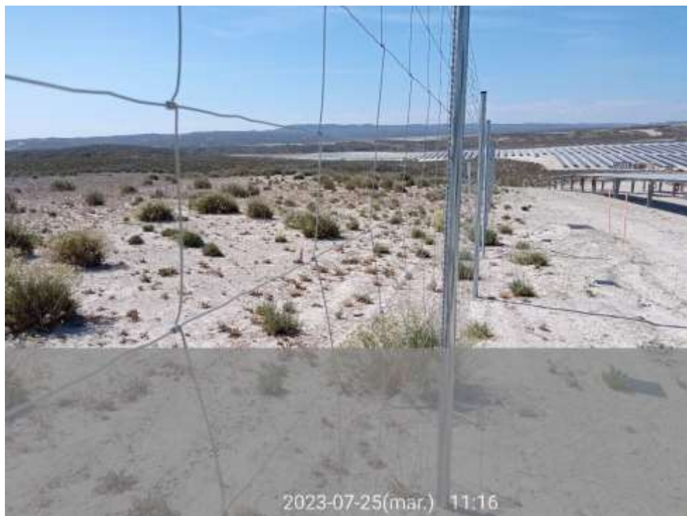
Ilustración 7. Franja de vegetación alrededor del vallado rebrota de manera natural en la parcela norte.