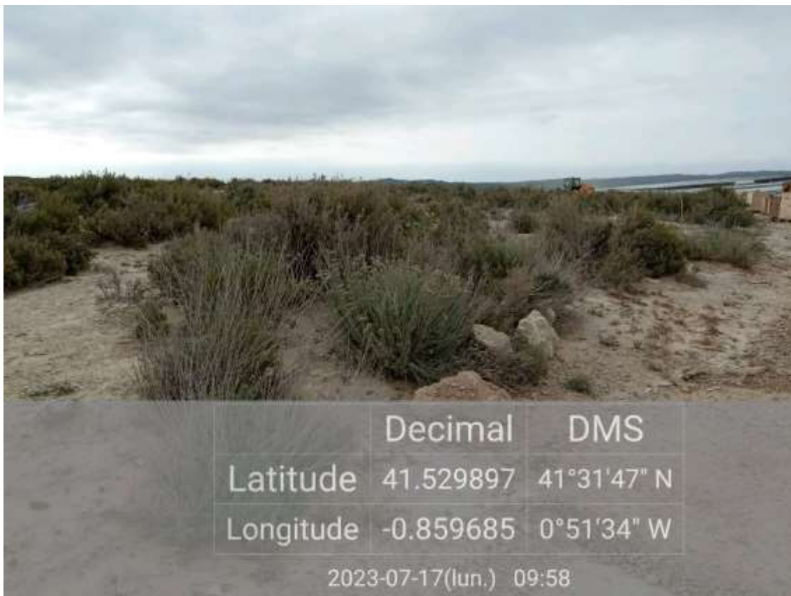
Ilustración 4. Islote de vegetación natural completamente limpio.