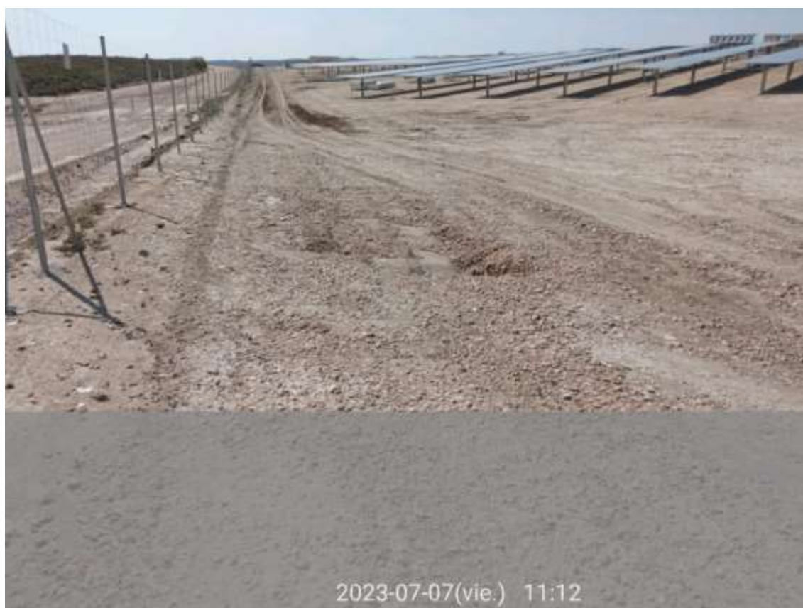
Ilustración 2. Vial de entrada de parcela sur con cárcava por erosión.