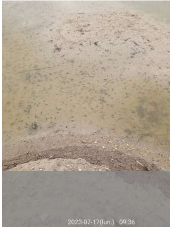
Ilustración 5. Larvas de sapo corredor en el balsete de la poligonal norte.