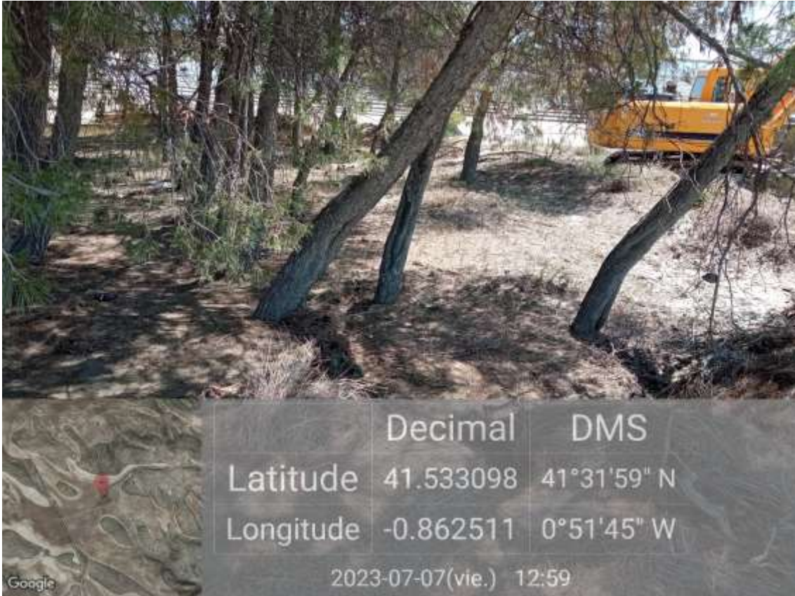
Ilustración 3. Bosquete de pinos de la parcela norte completamente limpio.