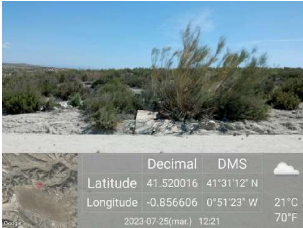
Ilustración 6. Cartón en el límite de vegetación del vial que recorre la zona este de la parcela sur.