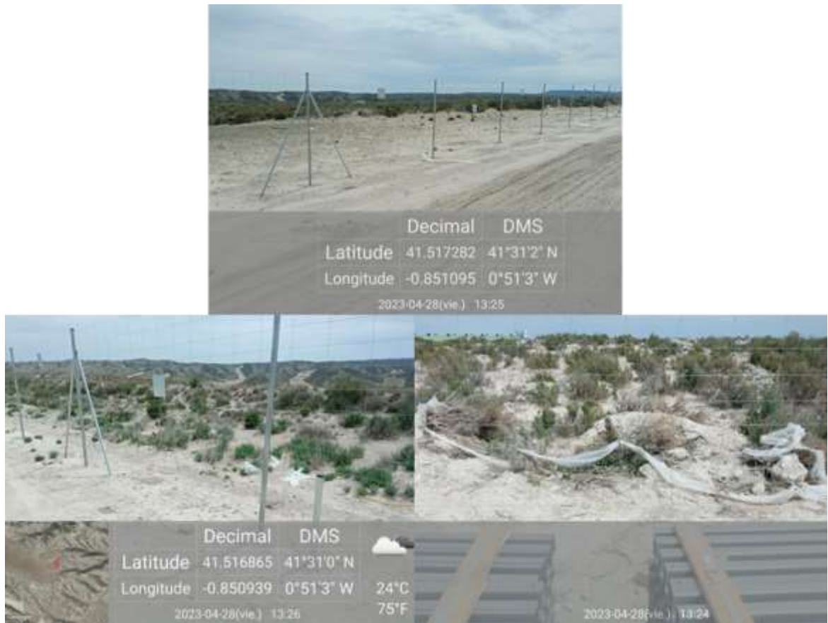
Ilustración 2. Acumulación de residuos plásticos encontrados durante la visita 15.