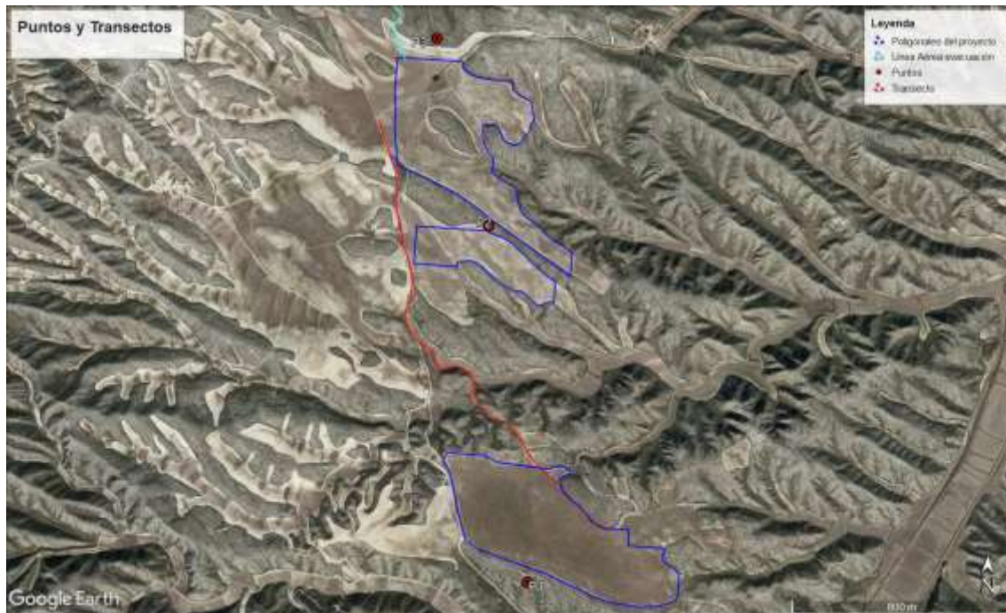
Ilustración 9. Puntos de observación y transectos para el informe preliminar de avifauna.

Los transectos se han realizado en coche a una velocidad inferior a 20 km/h y se ha anotado cada ejemplar avistado y/o escuchado. Los puntos seleccionados se han realizado con una duración de 10 minutos de espera en la cual también se anotan todos los ejemplares avistados y/o escuchado.