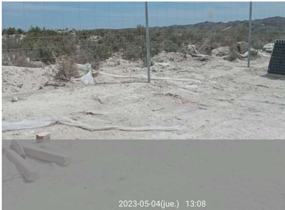
Ilustración 4. Fotos detalladas de residuos acumulados, visita 16.