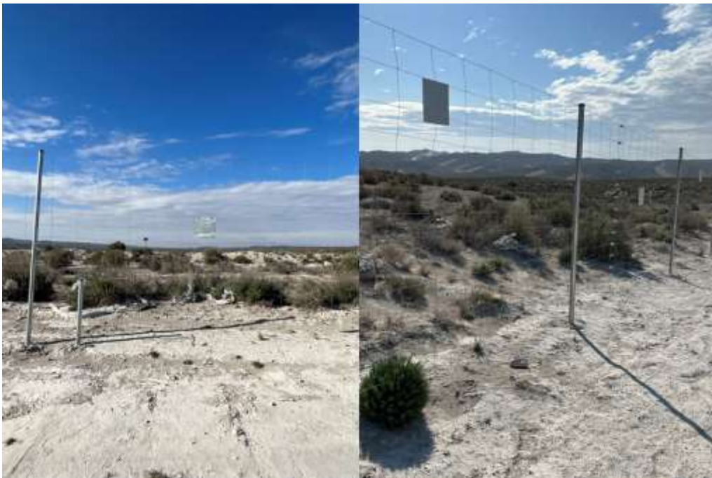
Ilustración 6. Continuidad de residuos plásticos de la visita 17.