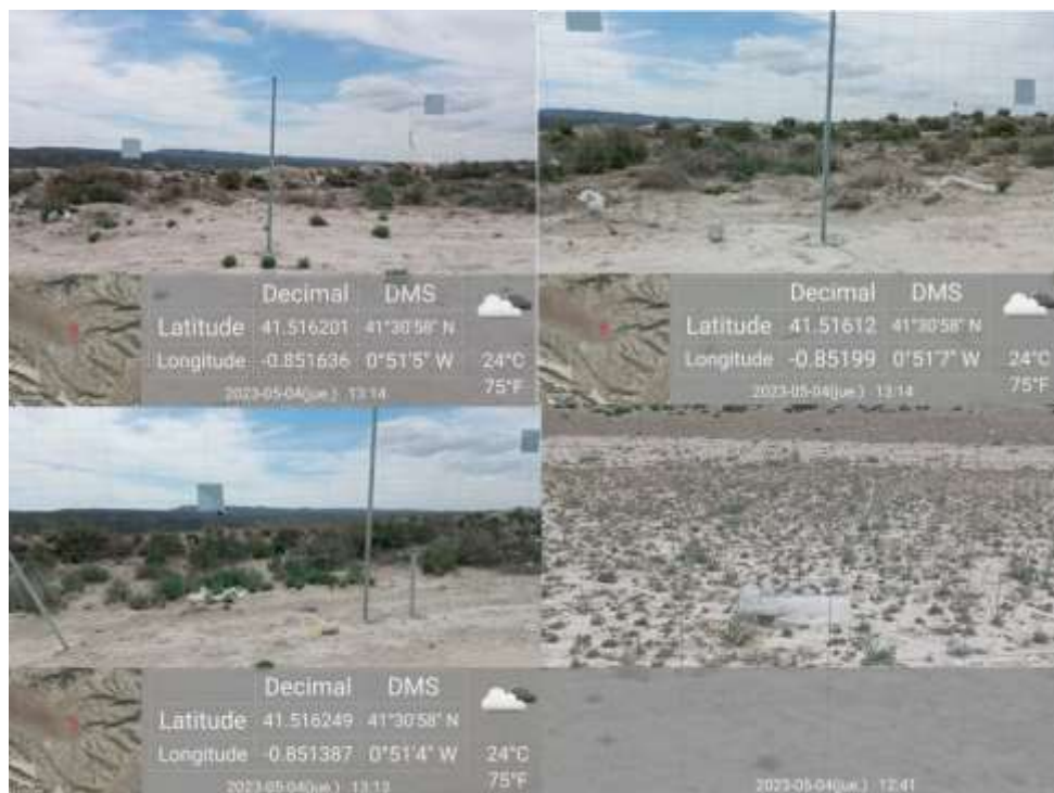
Ilustración 3. Fotos detalladas de residuos acumulados, visita 16.