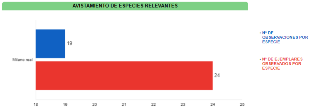
Ilustración 10. Gráfico de avistamiento de especies relevantes observadas durante todas las visitas realizadas a campo.

Por último, en la visita 16 se ha visto una cierta actividad de milano negro ( Milvus migrans ), correspondiente a ejemplares campeando por la zona, observados durante el transecto.