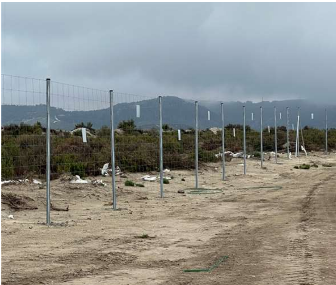
Ilustración 8. Gran acumulación de plásticos en el sur de la poligonal 3 detectado en la visita 18.

Se prevé que se realizará una batida de limpieza la última semana de mayo, y que, por lo tanto, se podrá cerrar la INCIDENCIA GRAVE en la próxima visita, correspondiente al mes de junio