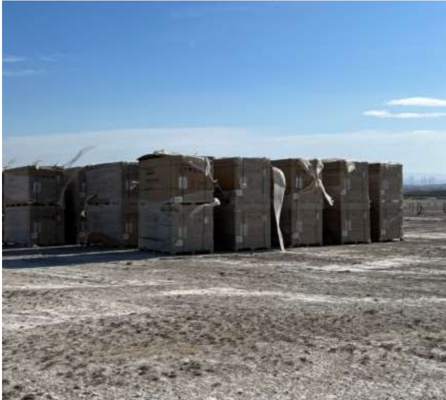
Ilustración 5. Lugar de origen de los plásticos de embalaje.