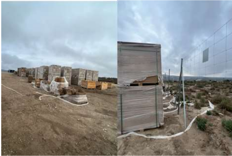
Ilustración 7. Plásticos de embalaje desprendidos y acumulados en la vegetación y el vallada, visita 18.