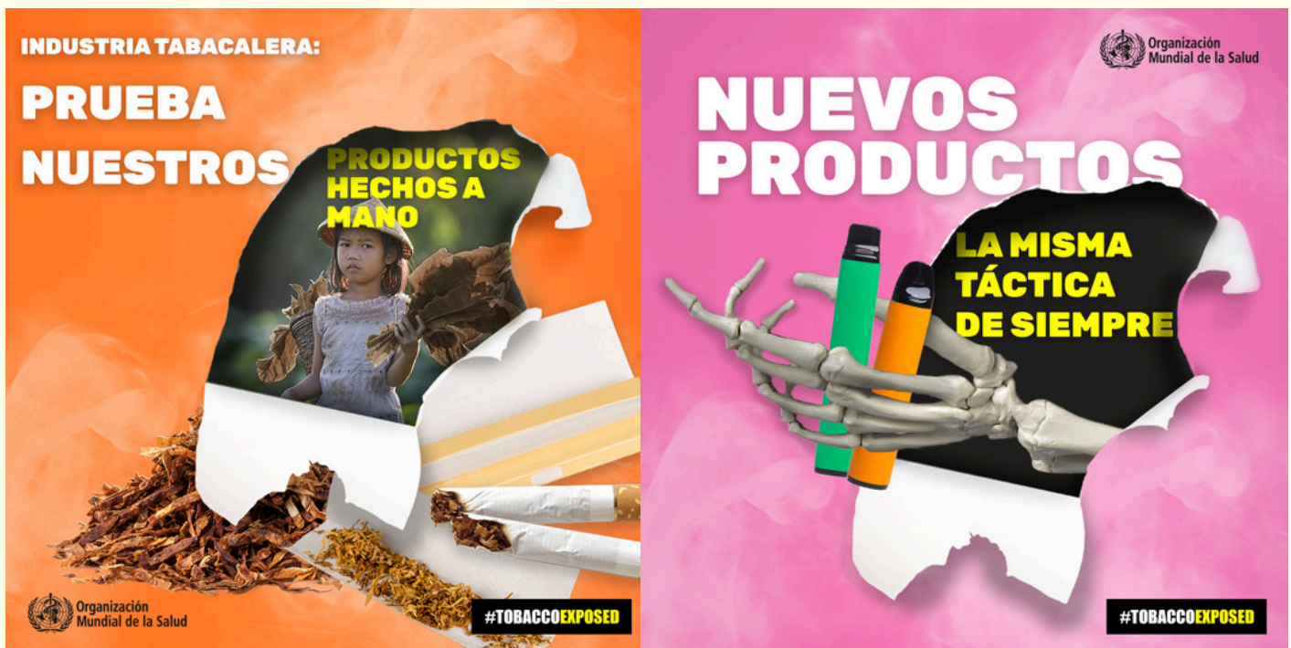
Carteles de la campaña de la OMS para el Día Mundial sin Tabaco 2024

Dirección General de Salud Pública Departamento de Sanidad