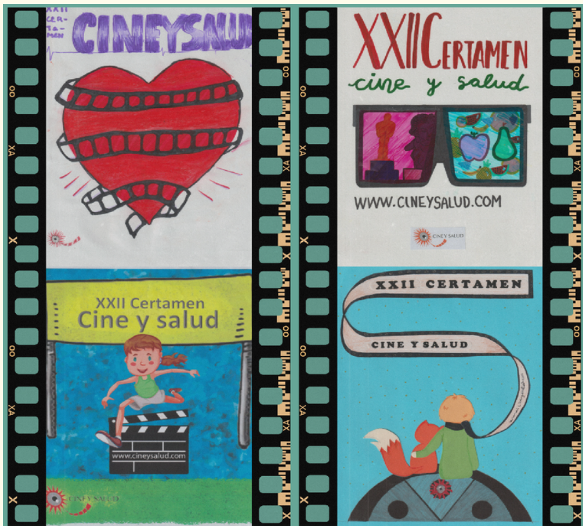
Carteles finalistas del Concurso de Cine y Salud 2024

Dirección General de Salud Pública Departamento de Sanidad