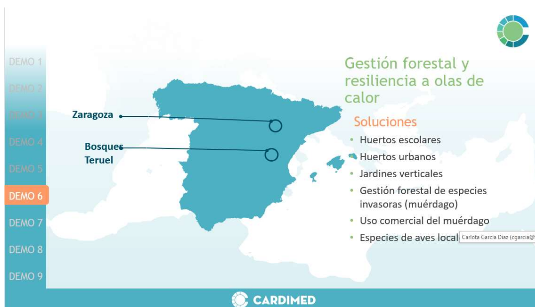
Ilustración 1- Localización del demostrador y soluciones previstas