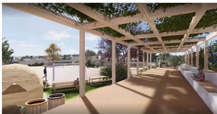
Ilustración 2- Propuesta de intervención en escuela participante en la iniciativa Patios X El Clima.