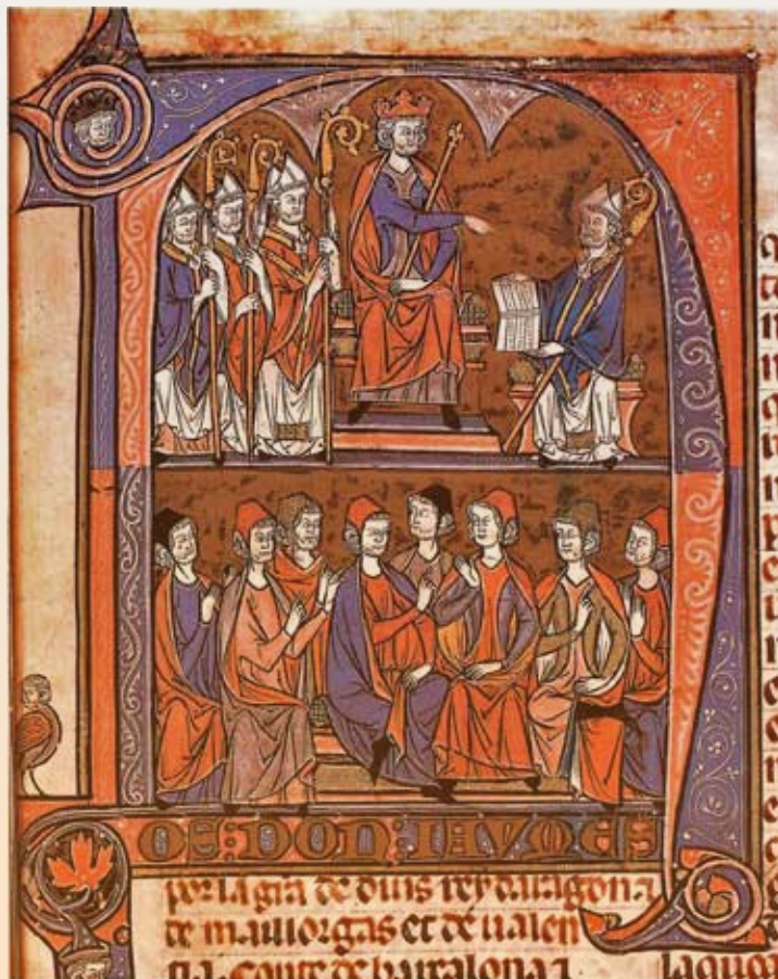
Miniatura del Vidal Mayor que muestra al rey Jaime I (arriba en el centro) ordenando la compilación de los fueros aragoneses al obispo de Huesca Vidal de Canellas. Esta compilación de leyes sentó las bases del derecho civil aragonés.

El Derecho civil aragonés ha sido el elemento principal de la formación, permanencia y continuidad de la identidad aragonesa hasta nuestros días, con manifestaciones propias tan arraigadas en Aragón como la libertad de pacto, las relaciones entre padres e hijos (custodia compartida), el régimen económico matrimonial, el usufructo de viudedad o la sucesión de los bienes en caso de muerte.