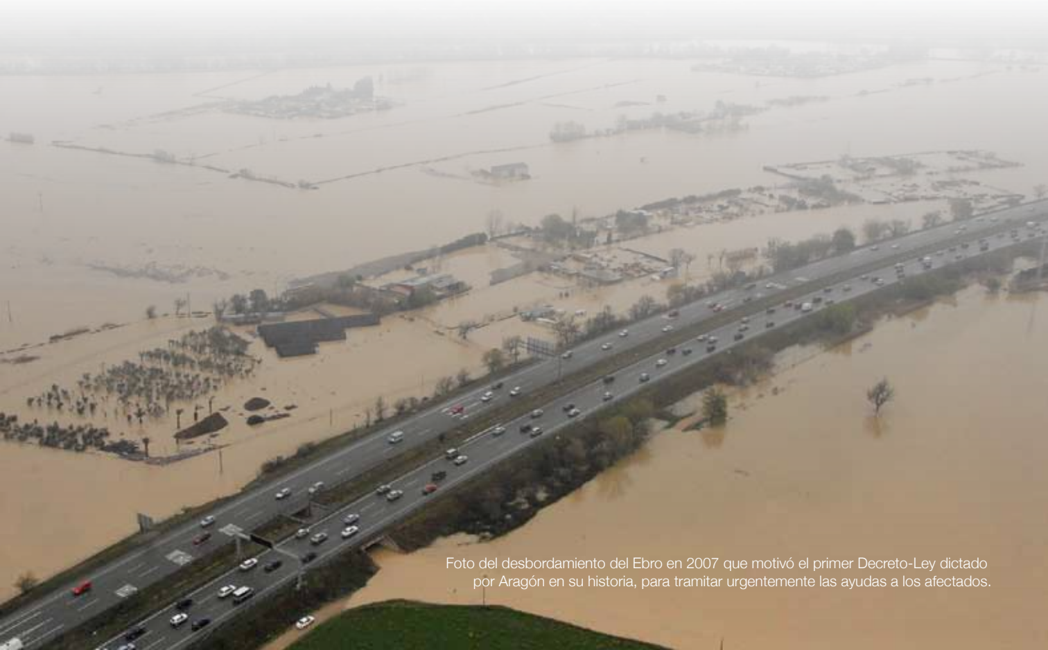
Foto del desbordamiento del Ebro en 2007 que motivó el primer Decreto-Ley dictado por Aragón en su historia, para tramitar urgentemente las ayudas a los afectados.

Se incorporan al ordenamiento aragonés los Decretos-Leyes. Se trata de “leyes urgentes” que aprueba el Gobierno de Aragón para dar una respuesta rápida a problemas concretos de los aragoneses, y que posteriormente son controlados por las Cortes.