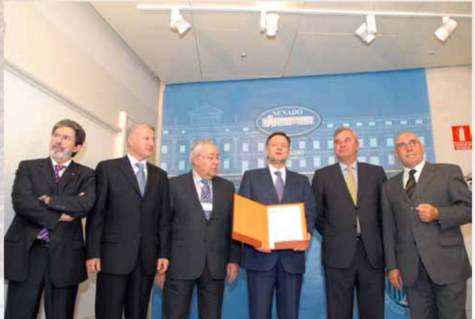
El 18 de abril de 2007 fue aprobada en el Senado la reforma del Estatuto de Autonomía de Aragón.

Todos estos elementos constituyen la base de los llamados derechos históricos de Aragón, que podrán actualizarse para afirmar y proteger la identidad aragonesa.