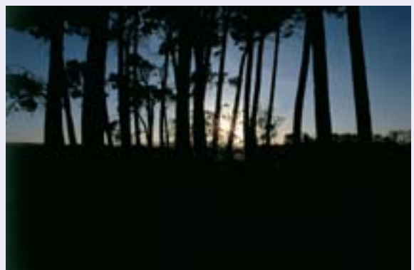
Tercer Premio: Pilar Usón Gracia.