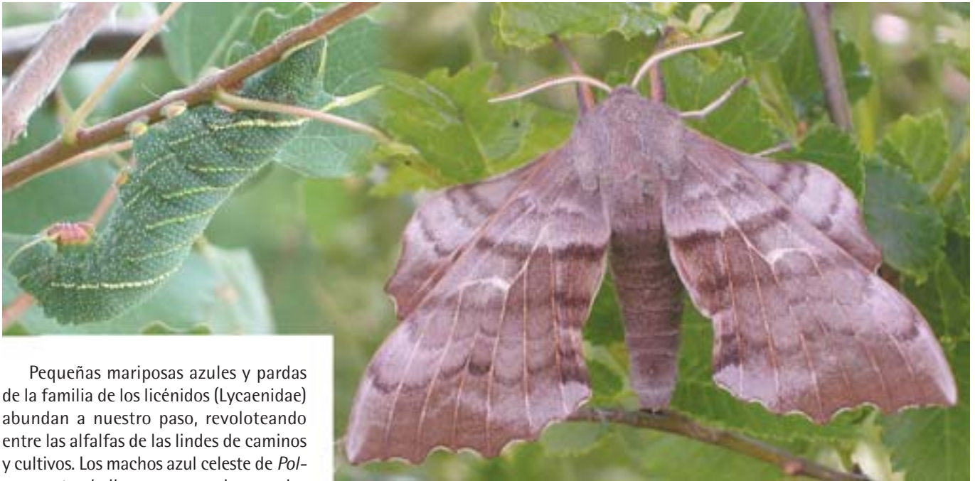
Oruga y adulto de Esfinge del Chopo.

El itinerario aquí expuesto está idealizado, atravesando los diferentes hábitats de la Reserva y se desarrolla, sobre todo, a finales de la primavera (mayo-junio), cuando se pueden observar más especies diurnas.