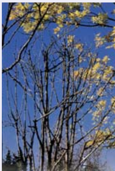
Tercer Premio: Julio Ortigosa Cresco.