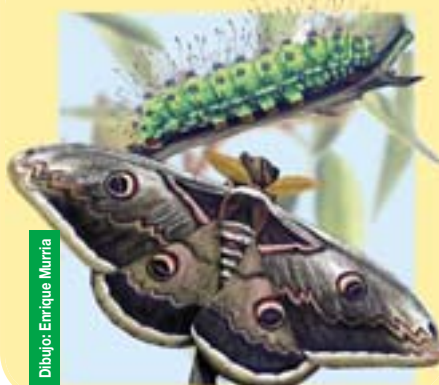
Dibujo: Enrique Murría

La Gran Pavón es el lepidóptero más grande de Europa. Aparece en la Reserva desde finales de abril hasta finales de mayo, volando de noche entre las copas de los árboles y reposando de día en los troncos o entre la vegetación. Los insectos adultos no se alimentan y viven escasos días, dos o tres los machos y algo más las hembras, ya que necesitan de un tiempo extra para poner sus numerosos huevos (hasta 200). Su presencia es cada vez menor en la Reserva por las razones antes apuntadas, y actualmente debe considerarse una especie en serio peligro de extinción en todo el valle medio del Ebro.