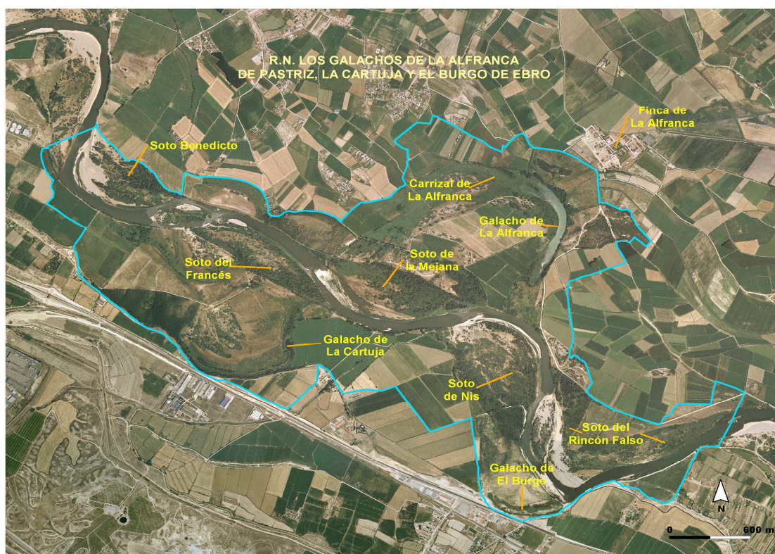
Foto aérea de la Reserva Natural

La Reserva Natural de los Galachos de La Alfranca de Pastriz, La Cartuja y El Burgo de Ebro se declaró por la Ley 5/1991 1 , de 8 de abril, de las Cortes de Aragón y fue reclasificada como Reserva Natural Dirigida mediante la Ley 6/1998 2 .