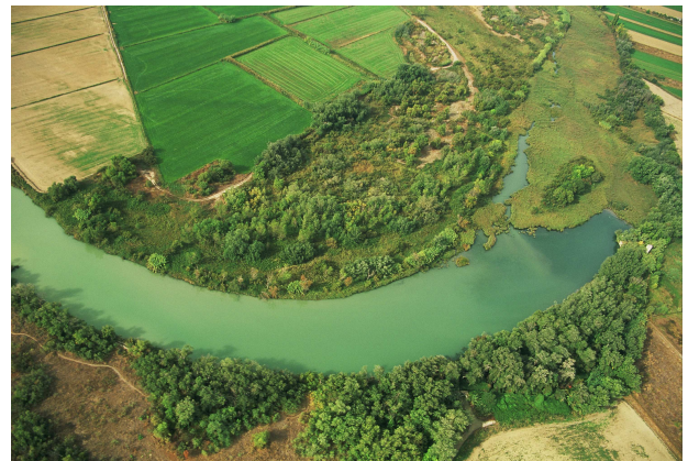
Foto aérea del Galacho de La Alfranca

En la época invernal, los patos cucharas, ánades frisos y silbones o cercetas comunes se refugian en los remansos del río o en los galachos, hasta la llegada de la primavera.