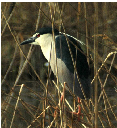
Martinete común ( Nycticorax nycticorax )

Estos bosques se distribuyen de manera paralela a la orilla aluvial. En las orillas, la vegetación ripícola predominante es la formada por saucedas de orla y tamarizales, formaciones de crecimiento rápido y resistentes al paso de las aguas. Más alejados de la orilla y en zonas sin la acción directa de las corrientes e inundaciones menos frecuentes, se encuentran árboles como el álamo blanco y el negro. El olmo y el fresno, de crecimiento más lento, viven en zonas inundadas esporádicamente. Estos bosques tienen una gran importancia como corredores ecológicos y sirven de refugio para numerosos animales tales como el azor, grajilla, pito real, curruca capirotada, mirlo común, tejón, zorro, gineteta y ratón de campo, entre otros.