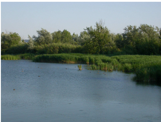
Galacho de La Alfranca

En las orillas se localizan céspedes de Paspalum paspaloides que las fijan y estabilizan protegiéndolas de la erosión mediante sus rizomas. Por ello, también favorecen el desarrollo de rodales de tamariz al proteger sus raíces de la excavación del lecho, permitiendo así la evolución hacia comunidades vegetales más complejas.