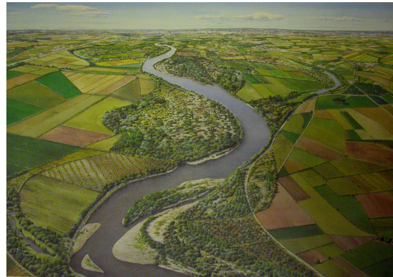
Pintura de la Reserva Natural de La Alfranca de Pastriz, La Cartuja y El Burgo del Ebro

La zona presenta una morfología fluvial característica del valle medio del Ebro, con su dinámica meandriforme divagante, que da lugar a la formación de galachos, madres, mejanas, etc., dominados por un paisaje predominante de bosque de ribera dispuesto en bandas de vegetación y zonas con extensiones importantes de carrizal.