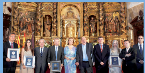
Foto de grupo de los Aragoneses de mérito 2012.