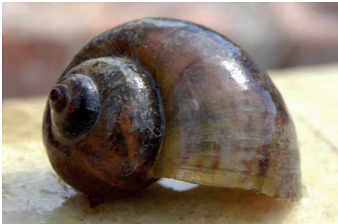
Foto 1. Concha de adulto de P. maculata .