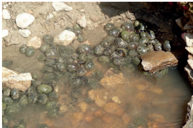
Foto 6. Caracoles manzana en acequia.