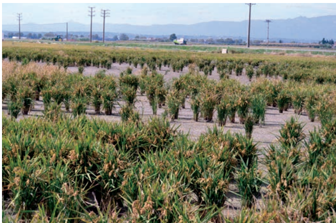
Foto 5. Daños de caracol manzana.