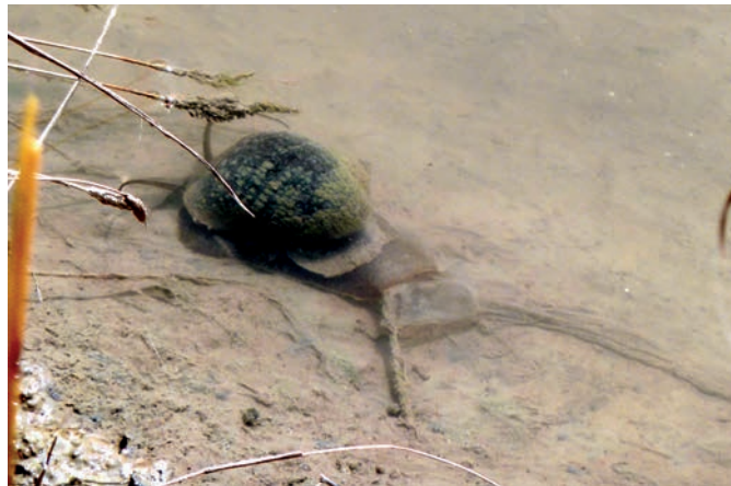
Foto 2. Adulto de P. maculata bajo el agua.