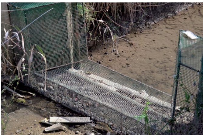
Foto 7. Trampa para evitar la propagación del caracol manzana.