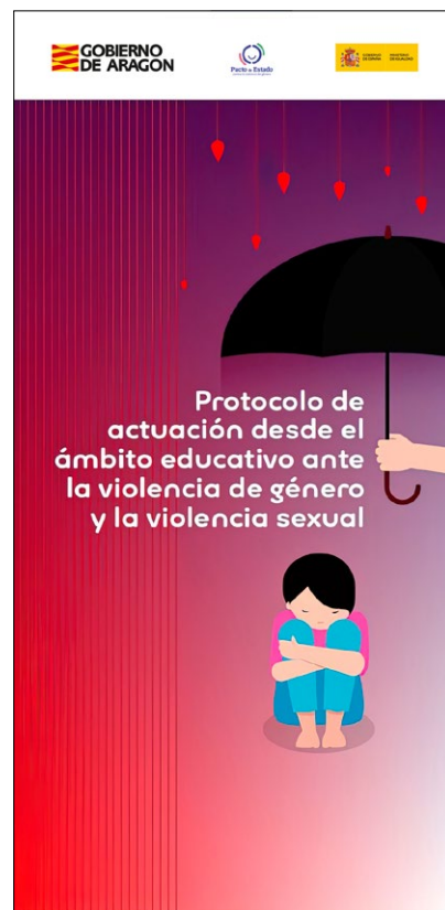
Publicidad en prensa. Faldón