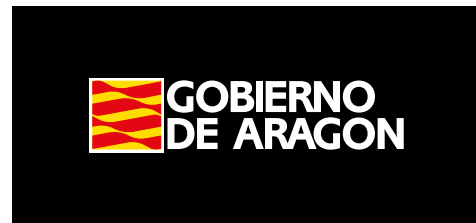
La logomarca en colores corporativos. Fondo negro.