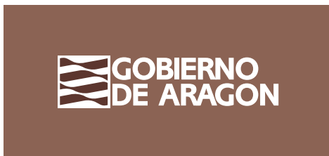
La logomarca en color corporativo tierra. Fondo 70% color corporativo tierra.