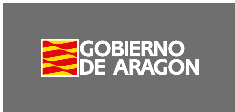
La logomarca en colores corporativos. Fondo 70% de negro.

Para mejorar la percepción de la logomarca, en estos casos, el símbolo se ribeteará con un filete blanco de grosor equivalente a la veintava parte del lado de su cuadrado.