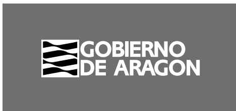
La logomarca a una tinta: negro. Fondo 70% de negro.