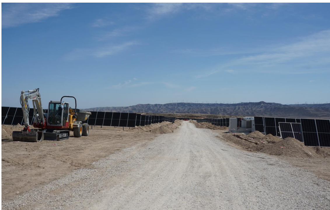
Figura 2a Excavación de zanjas en zona norte de Plana de la Pena 1

La continuación de los trabajos de excavación de zanjas para la distribución de la red eléctrica soterrada del parque y su posterior relleno, iniciada en marzo en Plana de la Pena 1, ha ocupado buena parte de los trabajos desarrollados durante el mes de abril.