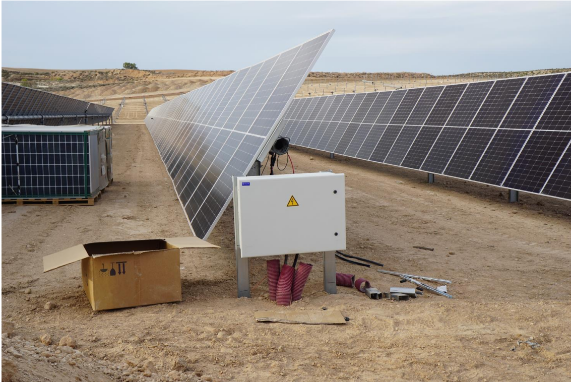
Figura 2b Instalación de cuadros eléctricos en Plana de la Pena 1