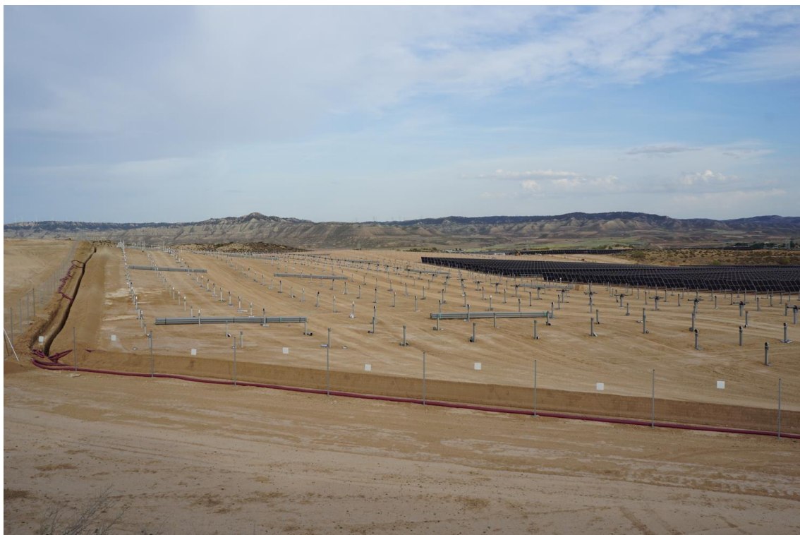
Figura 6 Situación de los trabajos al sur de Plana de la Pena 1 a final de abril