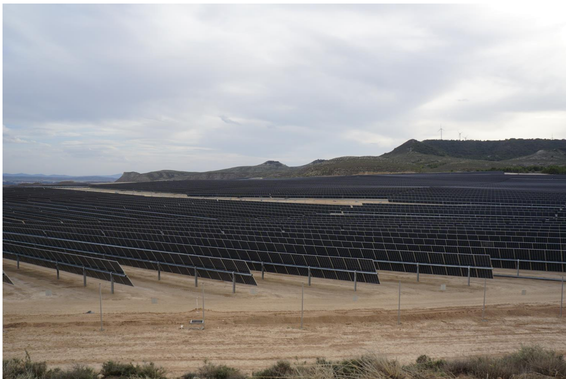
Figura 2c Vista general de la zona norte en Plana de la Pena 1