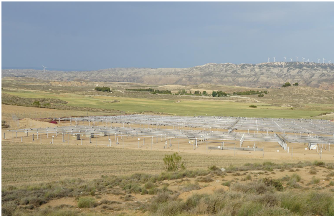
Figura 5 Zona aislada al norte de Plana de la Pena 1

El presente anexo se compone de un número representativo de fotografías del total realizado durante el periodo evaluado, escogidas por su relevancia y/o carácter explicativo para la correcta comprensión del presente informe.