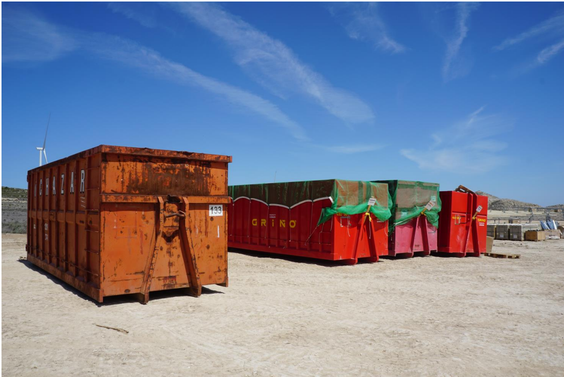
Figura 8 Contenedores industriales junto a zona norte de taller en Plana de la pena 1