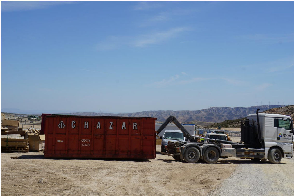
Figura 3 Gestión de residuos industriales