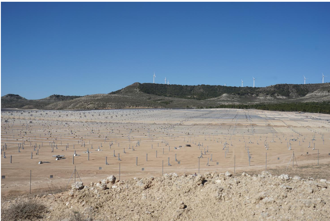
Figura 9 Vista general Plana de la Pena 1, primera quincena de abril, zona norte.