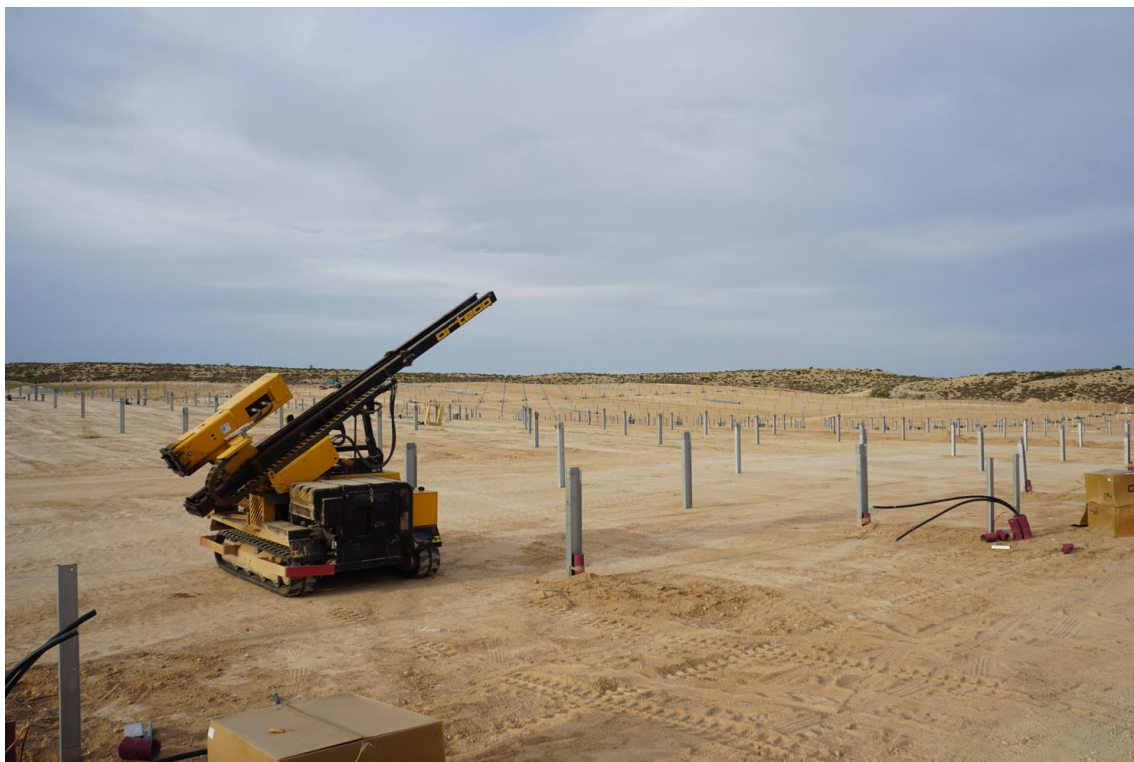
Figura 7 Hincado de soportes para instalación de cuadros eléctricos