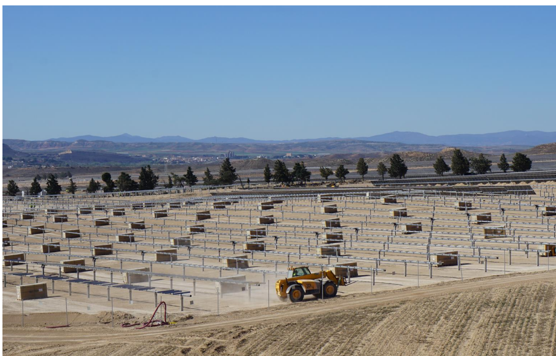
Figura 4 Vista general Plana de la Pena 1 a primeros de abril

Los distintos acopios de material de construcción y zonas de parking de vehículos y maquinaria se han realizado en zonas destinadas para la labor y sobre terreno de cultivo.