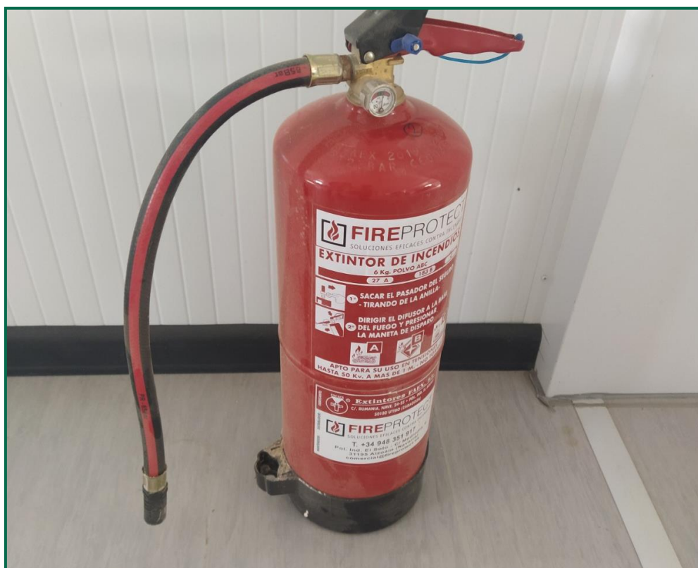
Fotografía 5. Extintor.