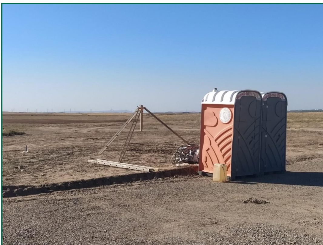
Fotografía 4. Baños químicos temporales.