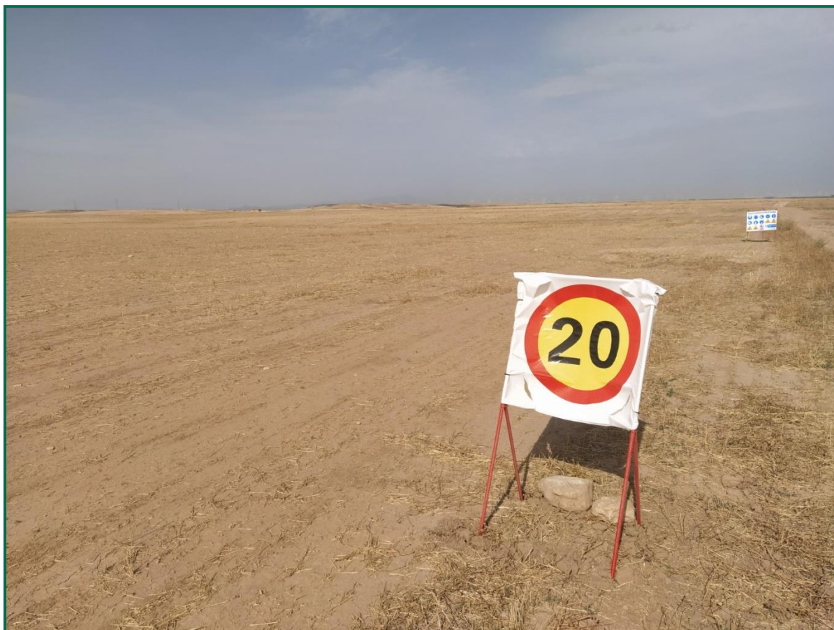
Fotografía 2. Señal de limitación de velocidad.

Se restringe de la velocidad de circulación por todo el recorrido de la obra a para minimizar la producción de polvo.