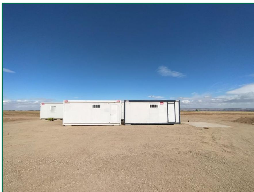
Fotografía 3. Zona de casetas de obra.

Se va a habilitar una zona para el lavado de canaletas de hormigoneras en planta, que contará con un plástico para evitar infiltraciones, además de un punto limpio para la separación de residuos. Se van a instalar baños en una de las casetas, con una fosa séptica estanca enterrada, y un depósito de agua, por el momento se han colocado dos baños químicos para su uso temporal.