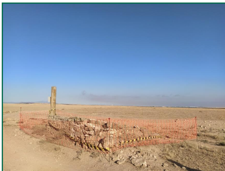
Fotografía 6. Muella de carga

Ya se ha procedido al balizado del citado elemento arqueológicos, a continuación, se muestran fotografía de este balizado: