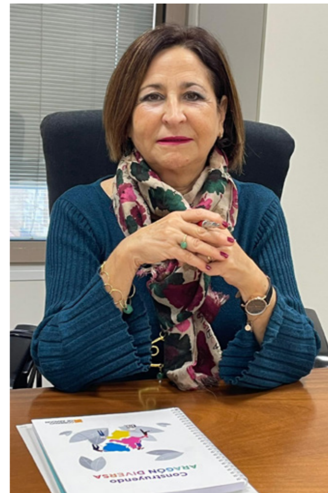
La Directora General de Igualdad y Familias

Diseño, maquetación e impresión: IdeasAmares