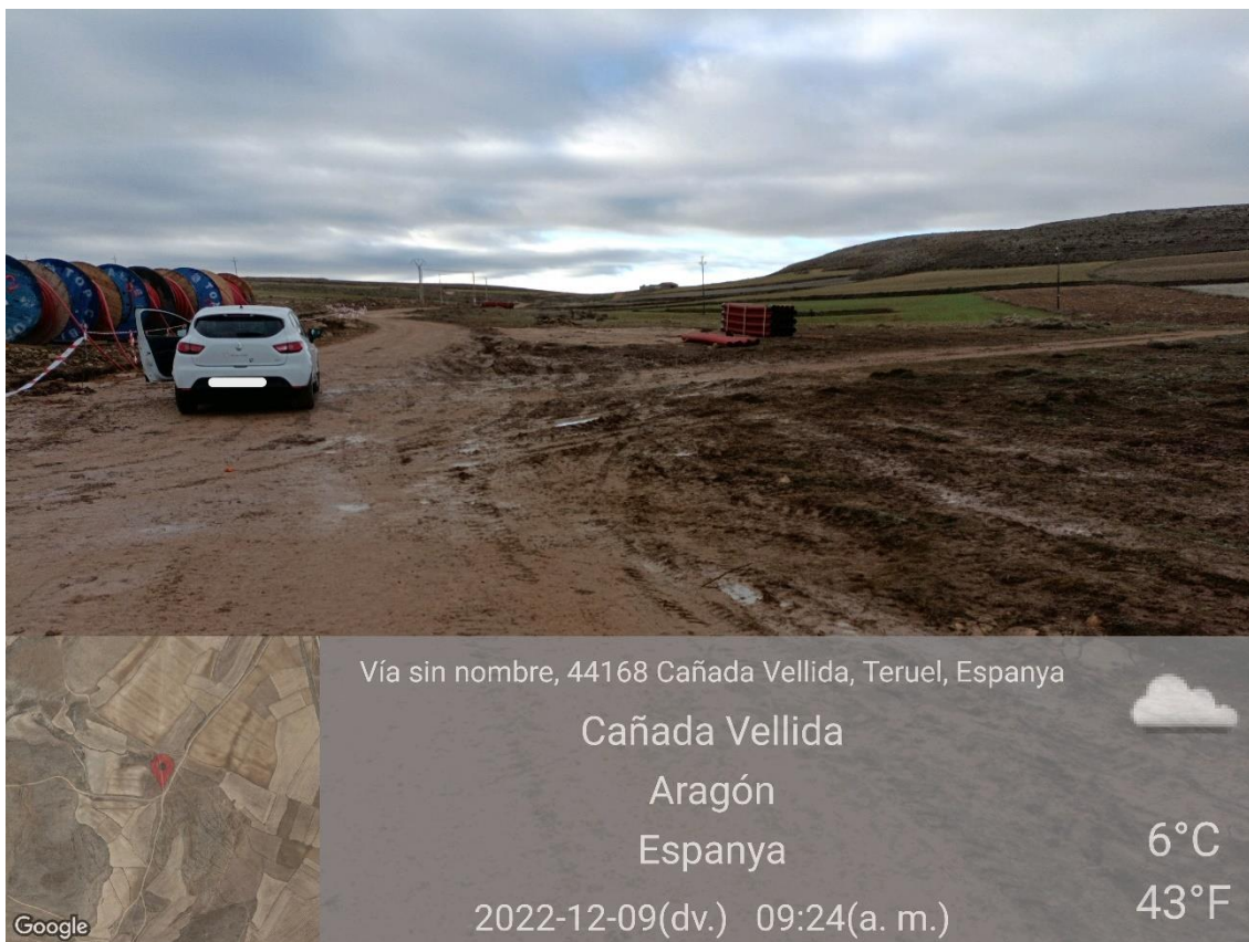
Ilustración 5. Afectación zonas de vegetación natural del hábitat de la alondra ricotí en la zona de trabajo de la línea eléctrica.