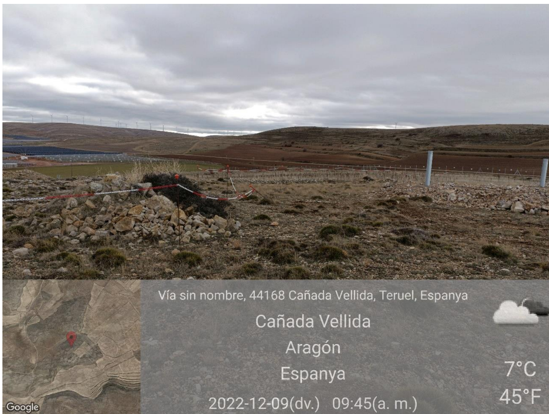
Ilustración 6. Piqueta doblada en las trincheras de la zona 4.