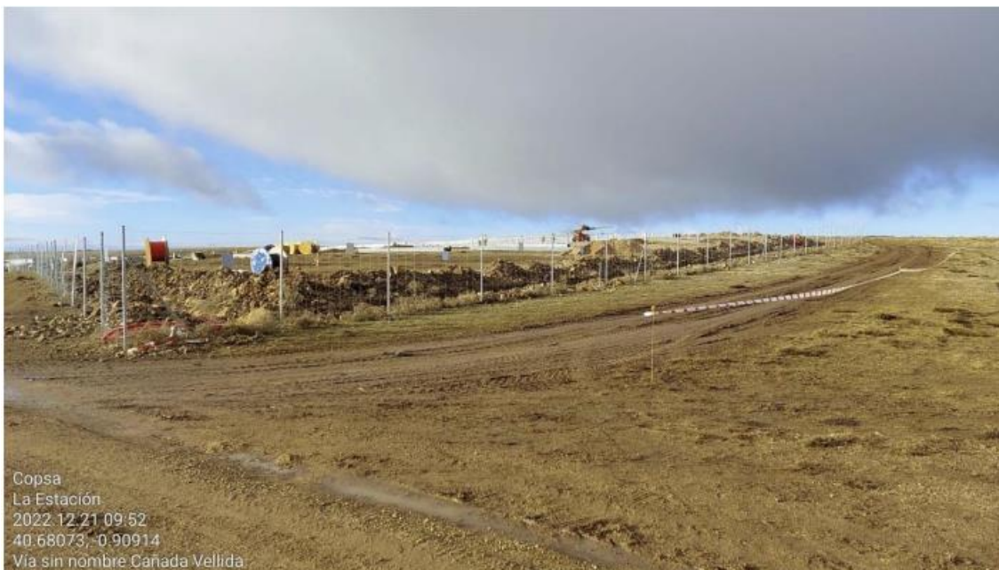
Ilustración 19. Balizado longitudinal vial zona 5