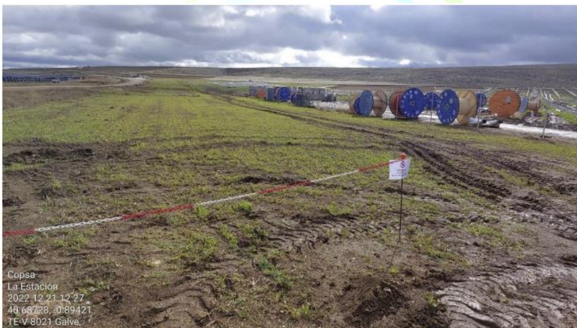
Ilustración 18. Balizado rodamientos en zona 3