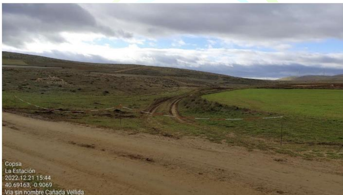
Ilustración 20. Balizado vial abierto en tramo de línea de evacuación soterrada