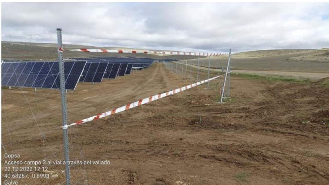
Ilustración 17. Balizado apertura vallado zona 3