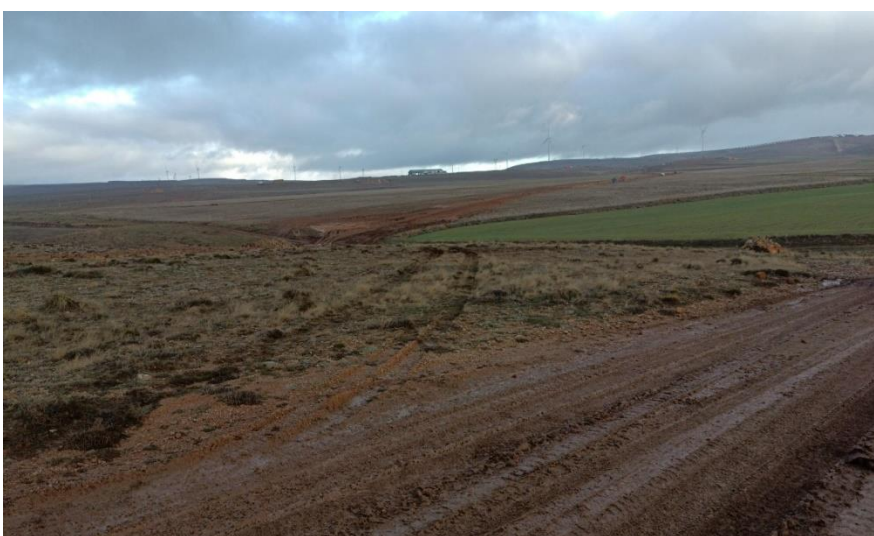
Ilustración 10. Rodamiento perpendiculares al vial central adecuado para la línea