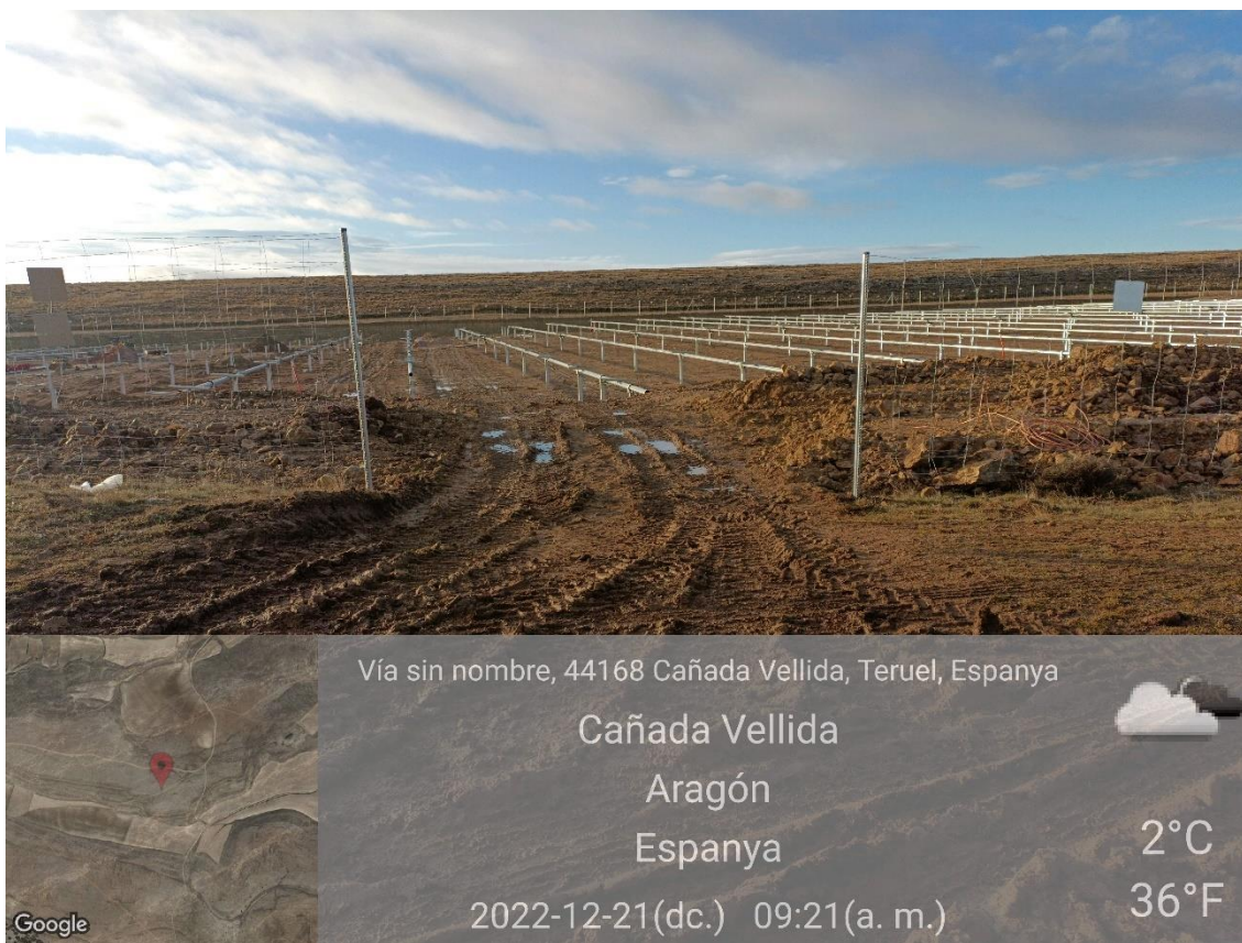
Ilustración 13. Apertura vallado zona 5