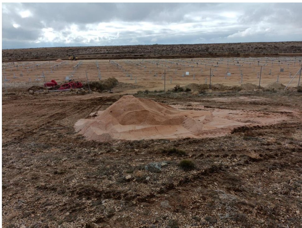
Ilustración 4. Acopio fuera del vallado de la zona 5.