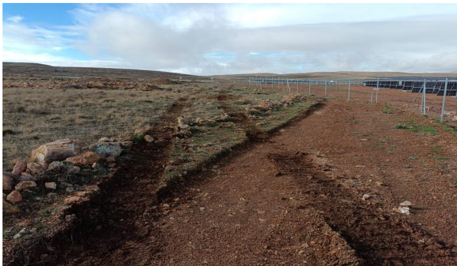
Ilustración 11. Rodamientos en los vallados de la zona 2 (arriba) y zona 3 (abajo)