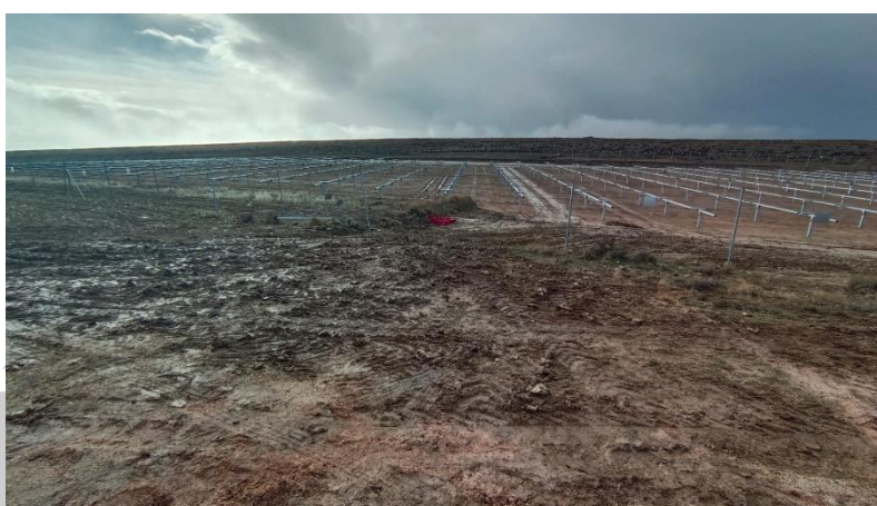
Ilustración 8. Apertura vallados en zona 5 y afectación a la vegetación por trasiego de vehículos