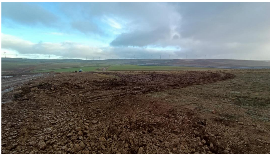
Ilustración 12. Afectación a zonas de vegetación natural de la alondra ricotí en las zonas de la línea de evacuación