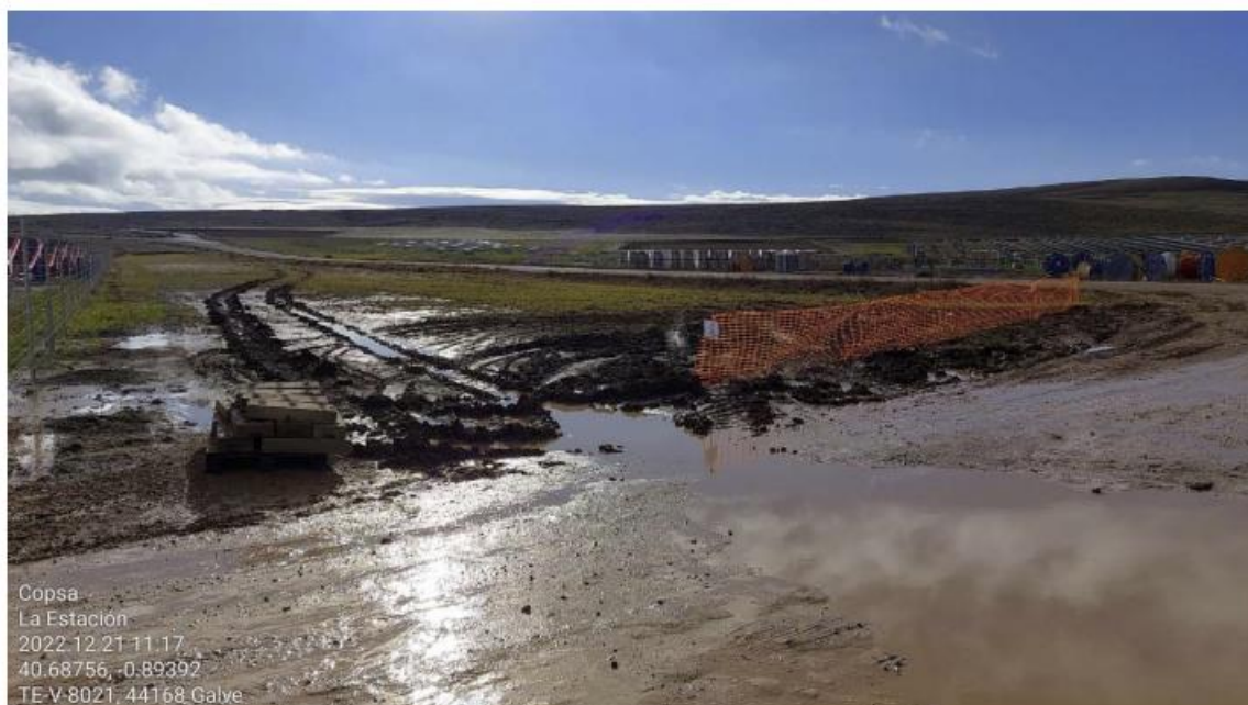
Ilustración 16. Balizado rodamientos en zona 2