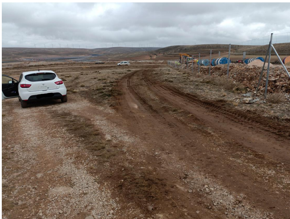
Ilustración 2. Apertura de vial no autorizado por tránsito inadecuado junto al vallado de la zona 5