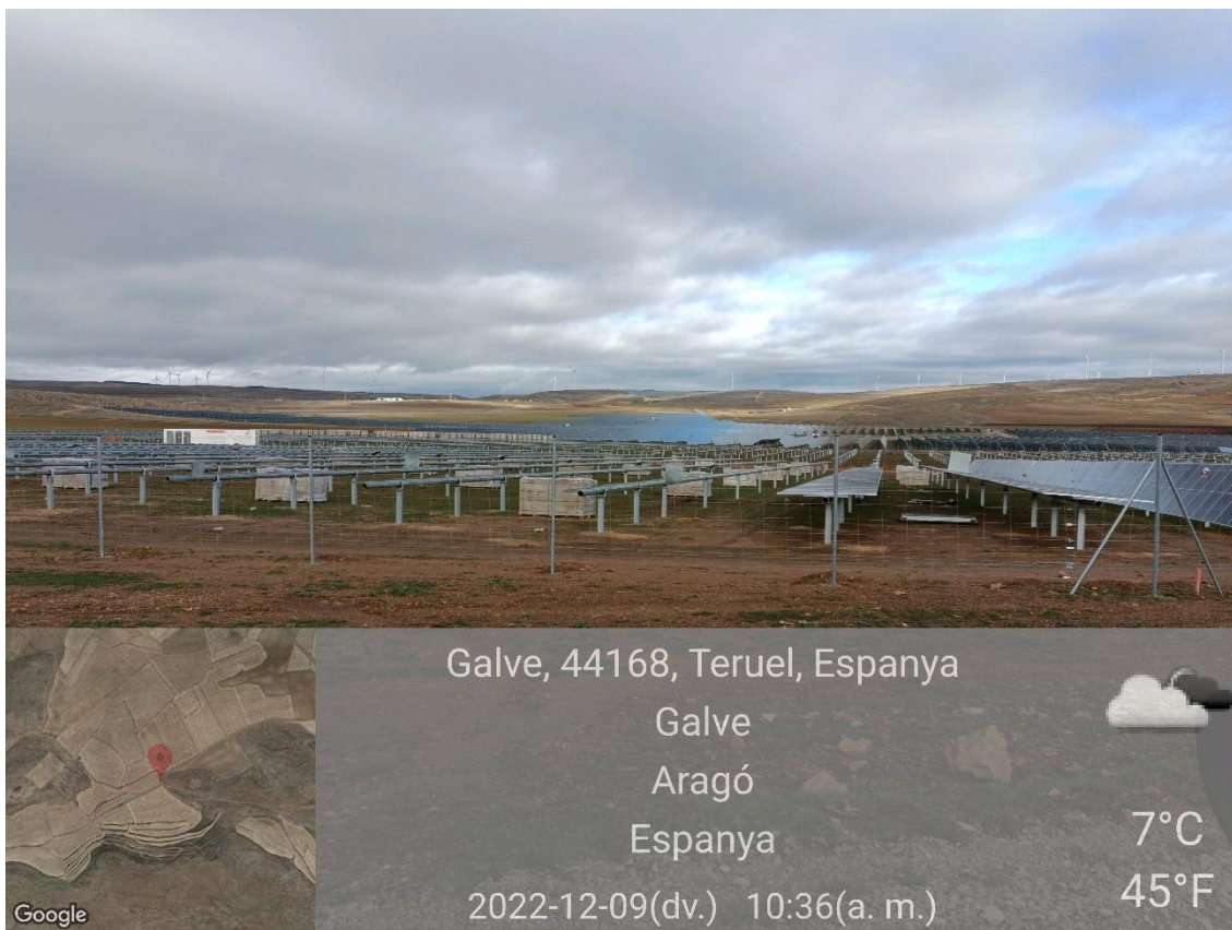
Ilustración 7. Montaje de placas en los vallados de forma correcta