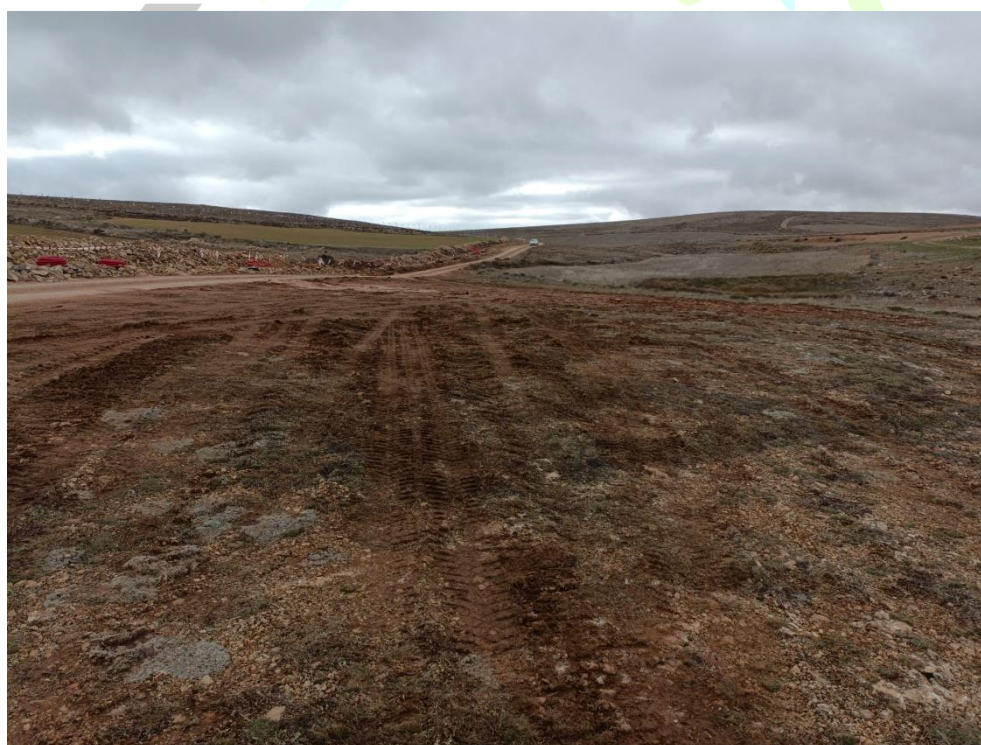
Ilustración 3. Afectación a zonas con vegetación natural por tránsito inadecuado en zonas colindantes al vial que presenta la zanja de la línea de evacuación