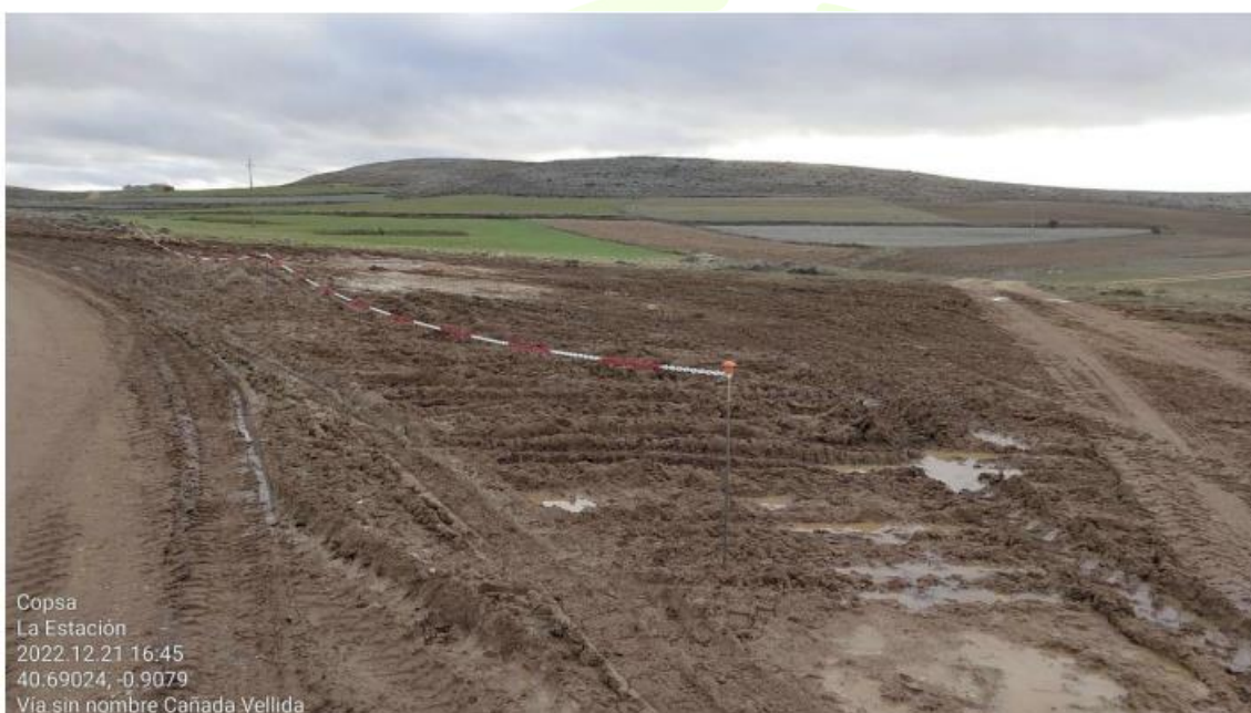
Ilustración 21. Balizado vial abierto en tramo de línea de evacuación soterrada