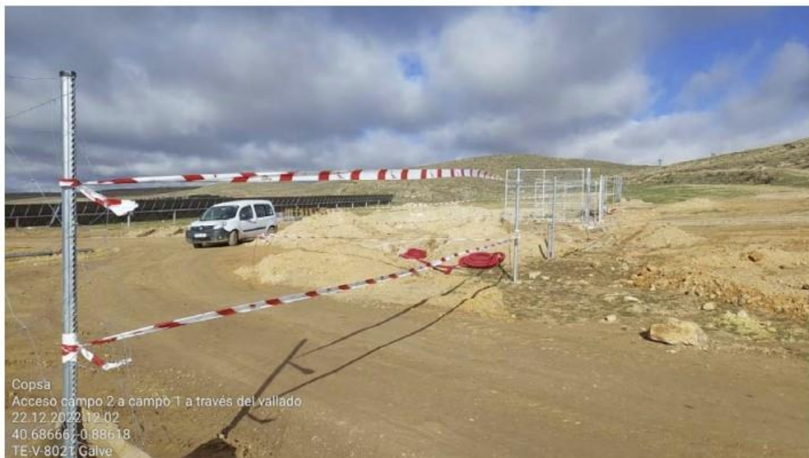
Ilustración 15. Balizado apertura vallado zona 2

Todas las zonas afectadas por la ejecución de la línea de evacuación quedarán incluidas en el Plan de Restauración Final del Proyecto.