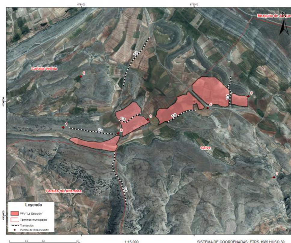
Ilustración 22: Puntos de observación y transectos para el informe preliminar de avifauna.

Las especies más abundantes han sido pequeñas aves propias de hábitats agro-esteparios y hábitats de secano con matorral bajo tales como pardillo común ( Linaria cannabina ) gorrión chillón ( Petronia petronia ), colirrojo tizón ( Phoenicurus ochruros ) o cogujada común ( Galerida cristata )