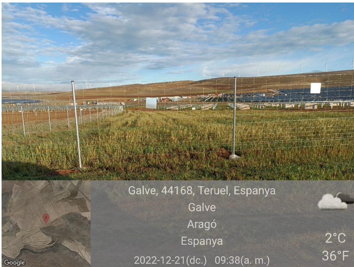
Ilustración 14. Crecimiento vegetación natural espontánea en zona 3.