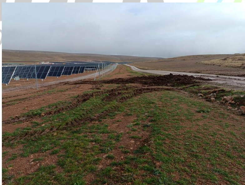
Ilustración 9. Afectación a zonas con vegetación natural por tránsito inadecuado en zonas colindantes al vial que presenta la zanja de la línea de evacuación