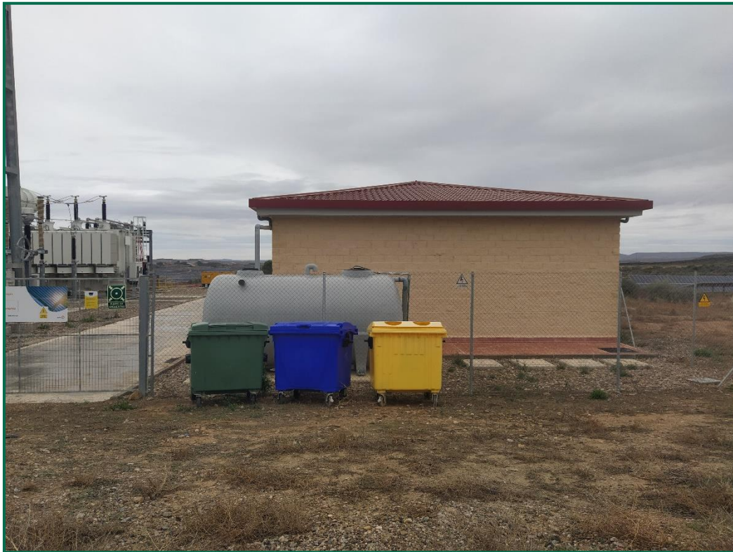
Fotografía 8. Contenedores de residuos no peligrosos en exterior de la subestación.