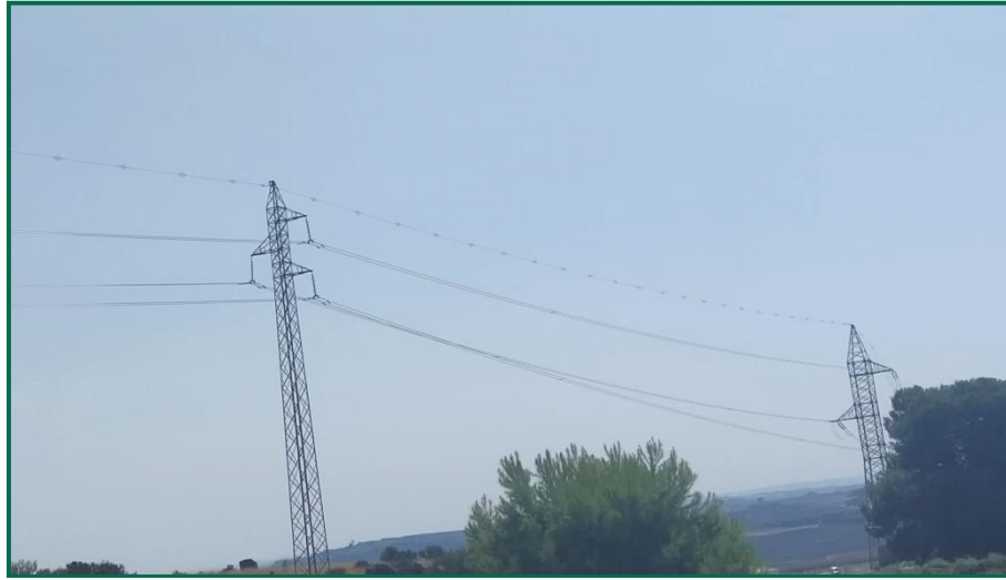
Fotografía 3. Línea eléctrica con balizas salvapájaros

Respecto al vallado perimetral, se ha utilizado malla cinagética que permite el paso de fauna de pequeño tamaño. Este vallado mide 2 metros de altura total y está formado por una serie de alambres verticales y horizontales, con una separación entre los verticales de 30cm, y entre los horizontales de mínimo 15cm en la línea inferior. En la planta fotovoltaica, esta malla está colocada dejando 15 cm libres desde el suelo al primer alambre. Se trata de un vallado con permeabilidad para la fauna, no presenta elementos cortantes ni punzantes.