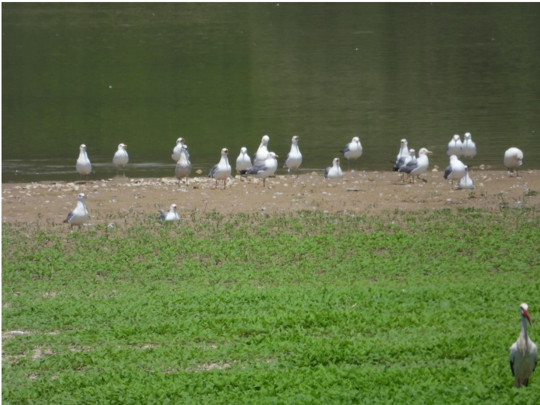
Fotografía 7. Gaviotas y cigüeñas en el Regallo.