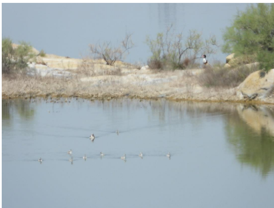
Fotografía 5. Tarros blancos con crías en las Saladas.