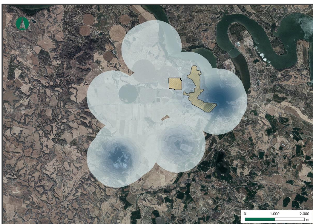
Figura 1. Uso del espacio por aves de mayor envergadura.

Los resultados se pueden ver en la siguiente figura, donde se representa el uso del espacio de todas las aves de gran envergadura, incluyendo aves acuáticas, muy abundantes en la zona debido a la gran cantidad de láminas de agua presentes, sin embargo, son y las aves rapaces y córvidos las que realizan mayor cantidad de desplazamientos y vuelos de prospección. Estas rapaces también suelen sobrevolar las láminas de agua, donde tienen mayor disponibilidad de presas potenciales.