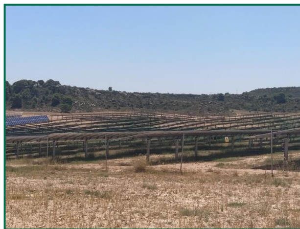
Fotografías 1 y 2. Vegetación entre placas actualmente.

Se ha realizado un seguimiento de la evolución de las revegetaciones realizadas durante 2020. Estas plantas se desarrollaron hasta finales de 2021, cuando tuvo lugar el arado de gran parte del perímetro de las PFVs y zonas adyacentes por parte de un agricultor de la localidad, por cuenta propia y sin relación alguna con las Plantas solares ni las empresas que en ellas trabajan, esta