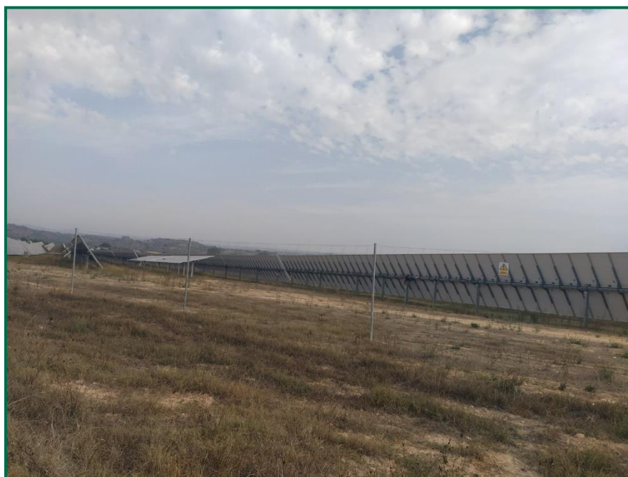
Fotografía 2. Estado actual.

Actualmente, sobre la tierra que fue arada esta volviendo a crecer vegetación de forma espontánea, esta vegetación, si bien será efectiva para prevenir la erosión no ejercerá funciones de pantalla vegetal ya que se trata de especies de poco porte y de carácter anual o bianual.