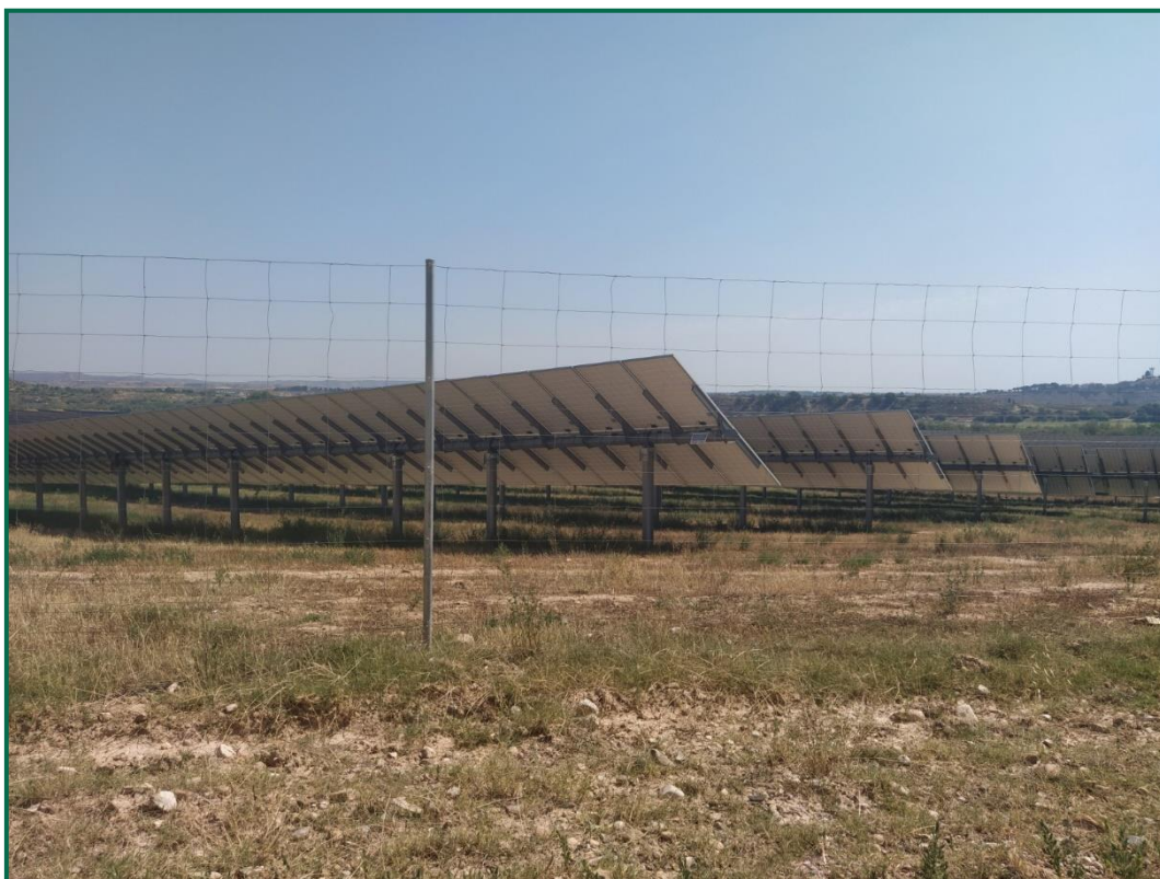
Fotografía 4. Vallado perimetral.

Con objeto de realizar un seguimiento de fauna en explotación se han realizado las siguientes acciones: