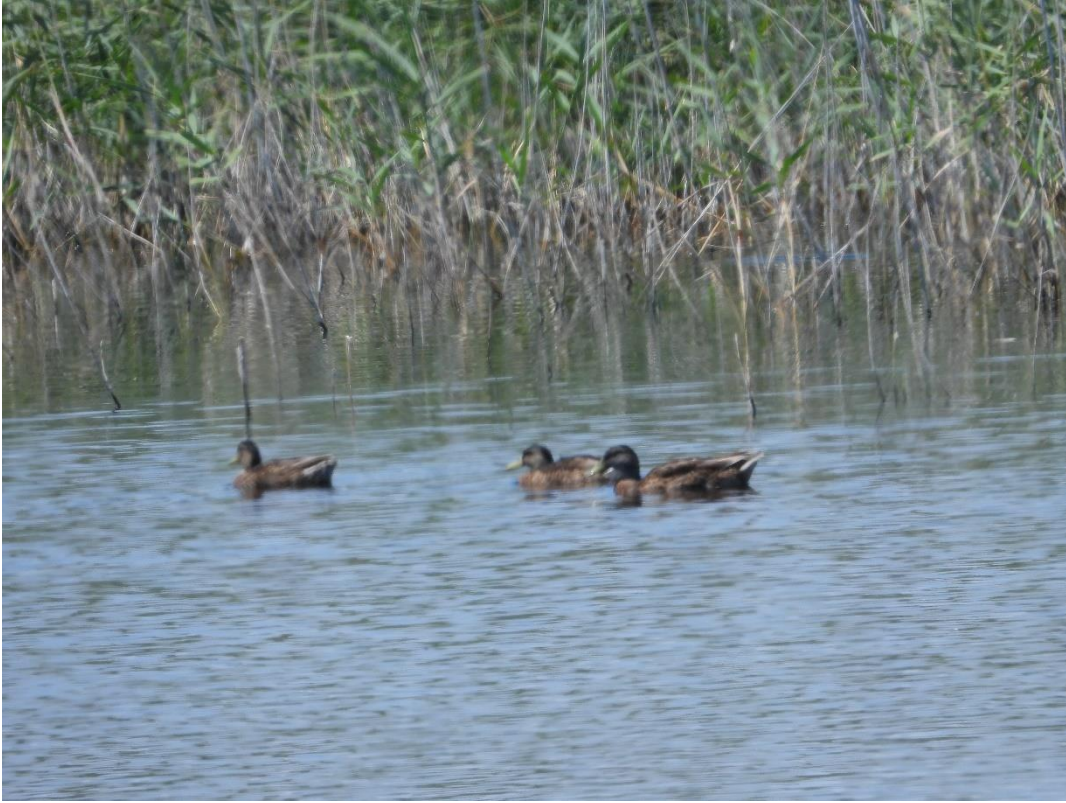
Fotografía 6. Grupo de ánades no reproductivos en Blasé.