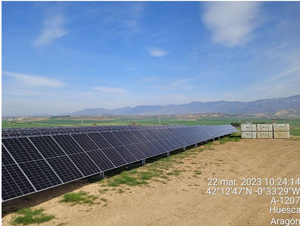
Imagen 5. Palets con los módulos fotovoltaicos esperando para ser instalados.