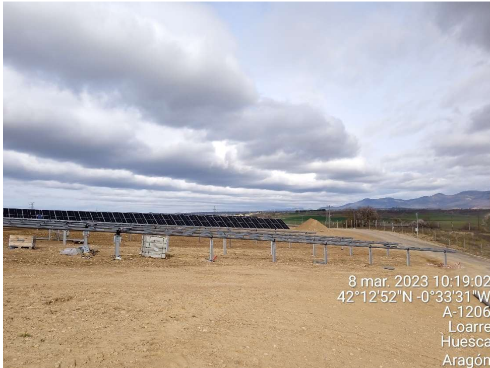
Imagen 5.- Trabajos de montaje de módulos fotovoltaicos.