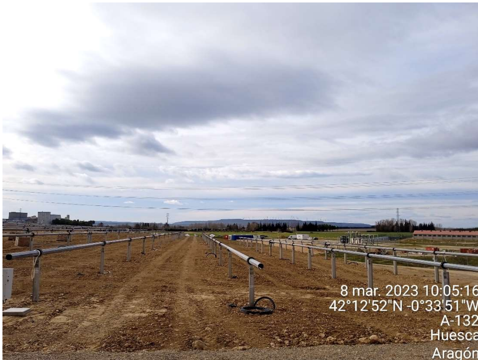
Imagen 4.- Montaje de los últimos seguidores.