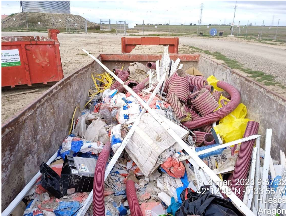
Imagen 11.- Contenedor de plásticos en el Punto limpio de Residuos no peligrosos.