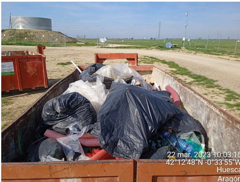
Imagen 10.- Contenedor de plásticos en el Punto limpio de Residuos no peligrosos.