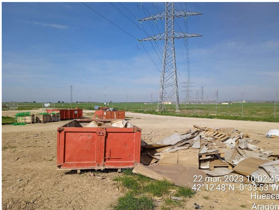
Imagen 12.- Contenedor para cartones del Punto limpio de Residuos no peligrosos.