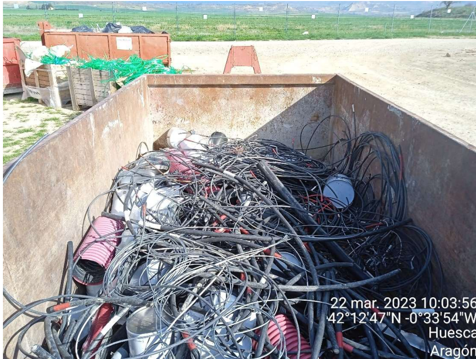
Imagen 11. Contenedor para metal del Punto limpio de Residuos no peligrosos.