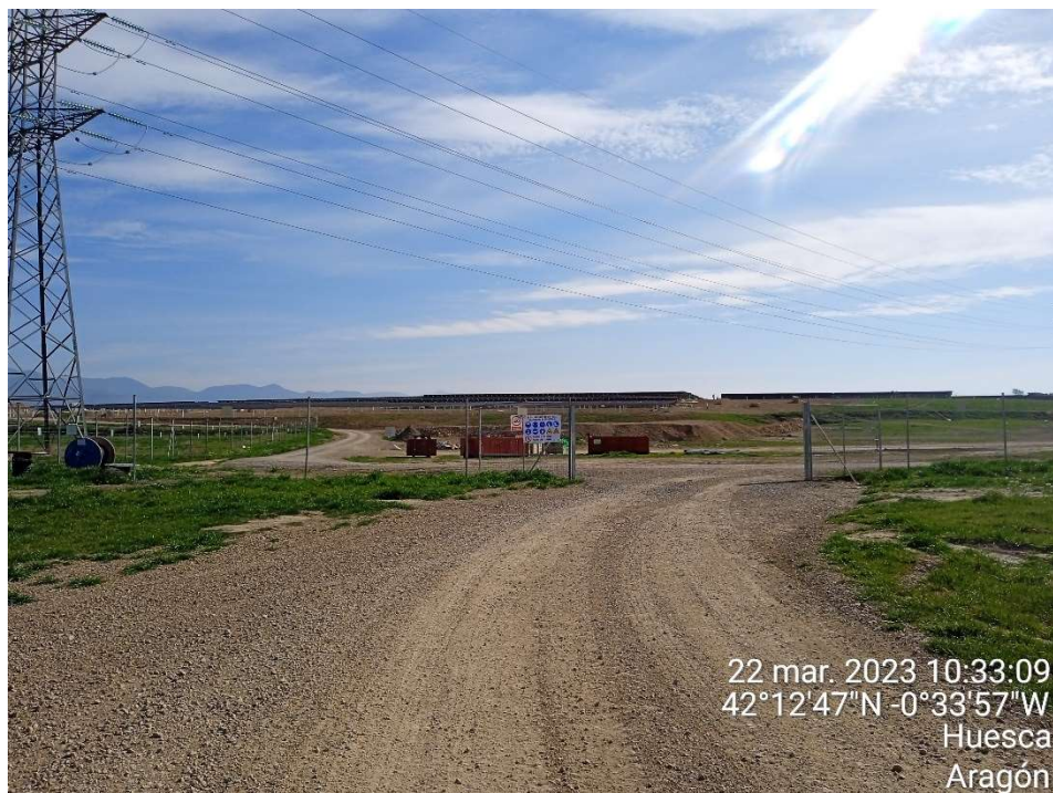
Imagen 2.- Vista de la entrada a la planta fotovoltaica por el acceso oeste.