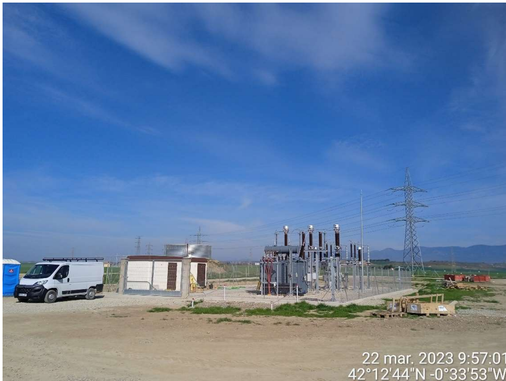
Imagen 8. Trabajos en la Subestación de Transformación.