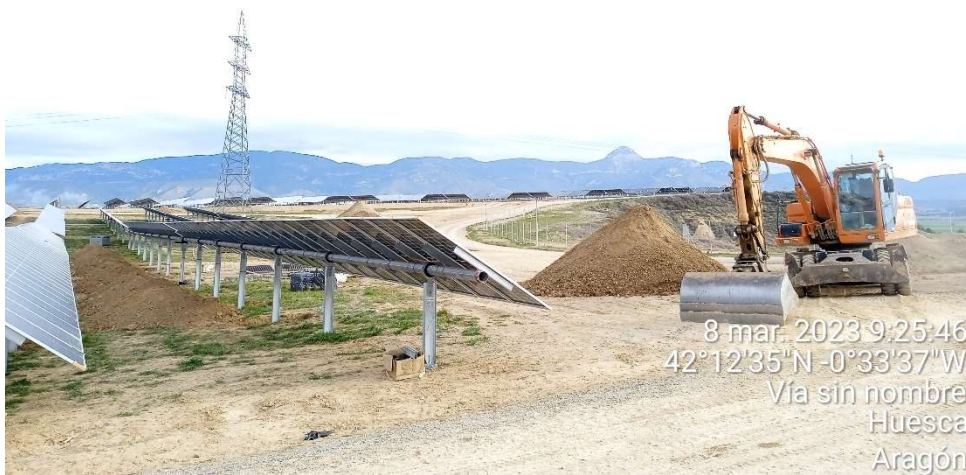
Imagen 3.- Trabajos de extendido de tierra vegetal.