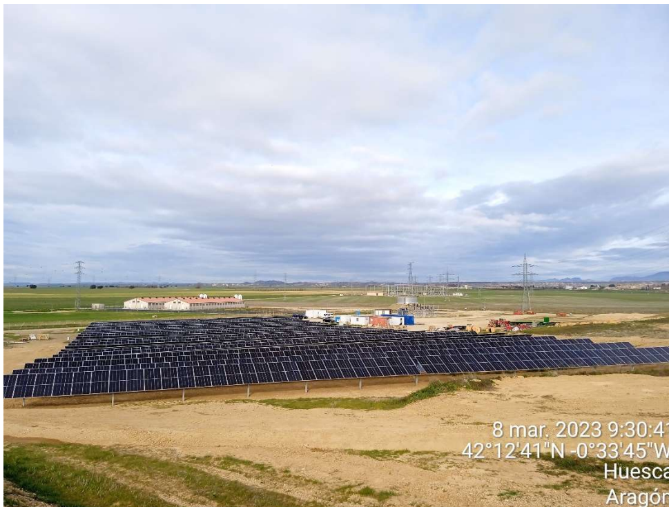
Imagen 8. Módulos fotovoltaicos instalados, con la Zona de instalaciones auxiliares y S.E.T. detrás.