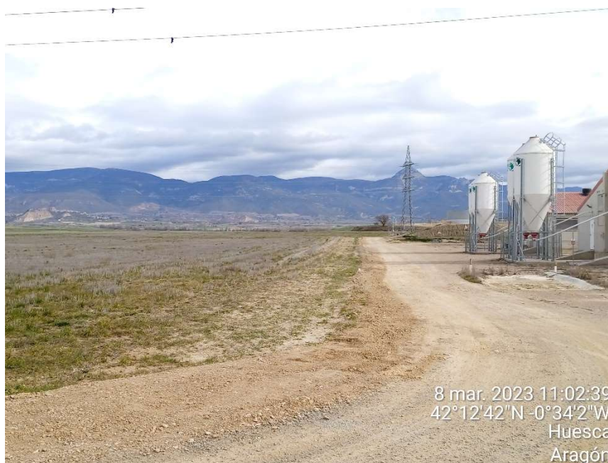
Imagen 2.- Situación final de las obras de tendido de la línea de evacuación de la planta fotovoltaica. Vista hacia la entrada de la planta solar.