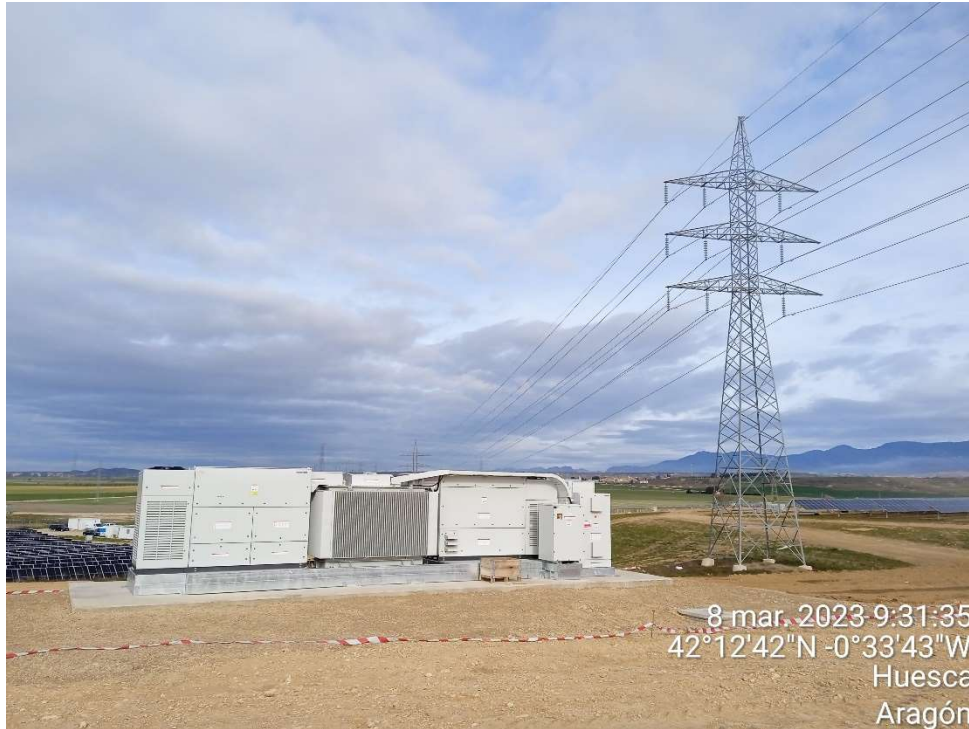
Imagen 7. Vista de uno de los tres Centros de Transformación.