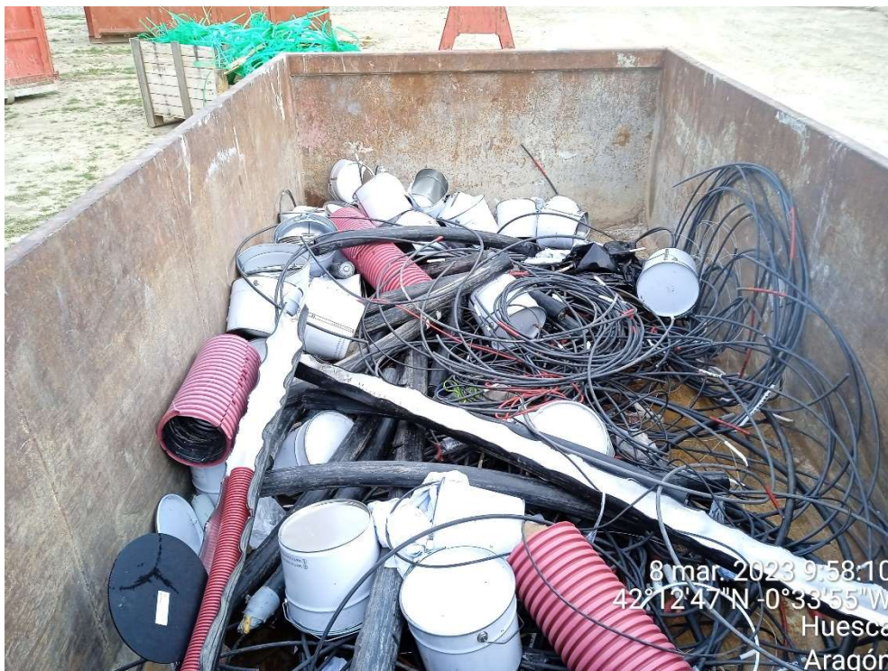
Imagen 12. Contenedor para metal del Punto limpio de Residuos no peligrosos.