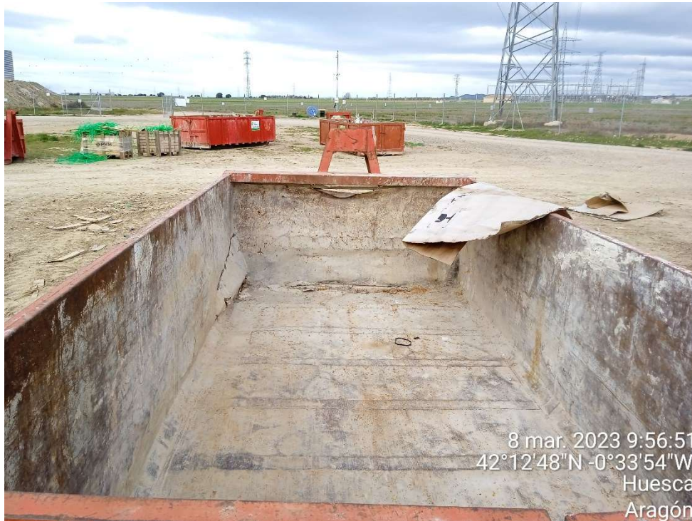
Imagen 13.- Contenedor para cartones del Punto limpio de Residuos no peligrosos.