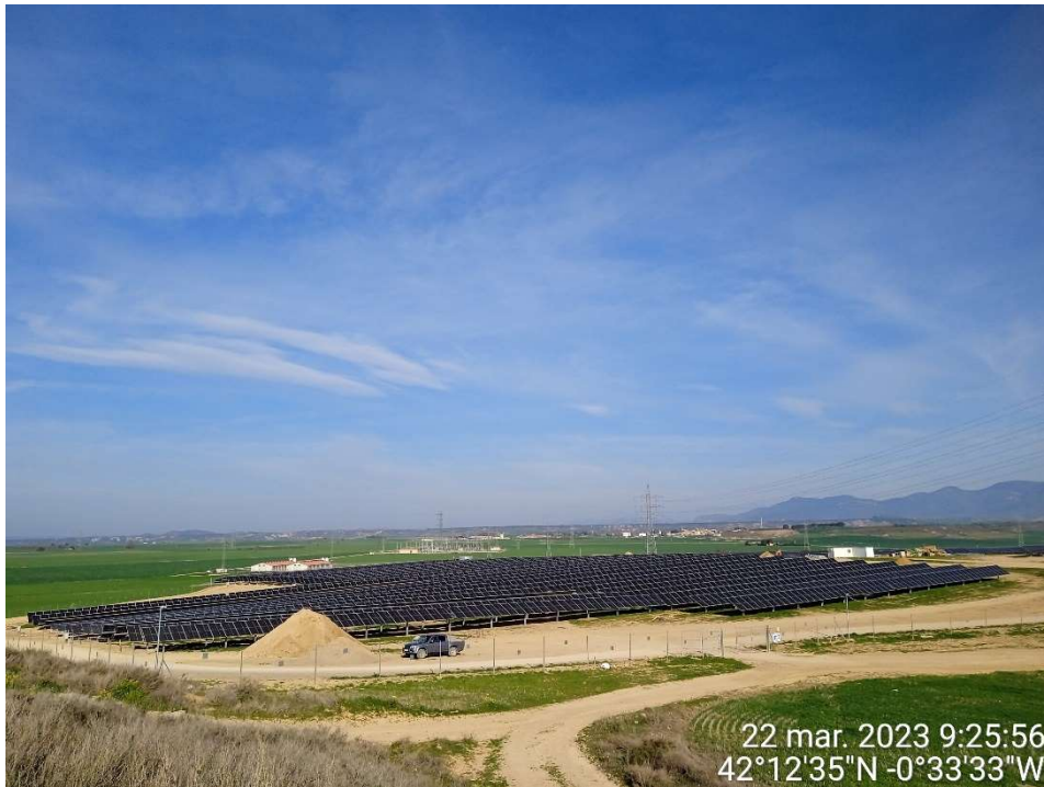
Imagen 1.- Vista de la entrada a la planta fotovoltaica por el acceso este.