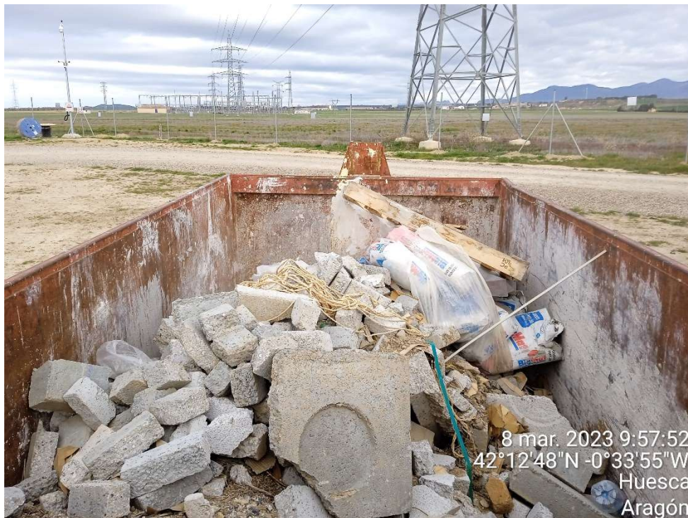
Imagen 14.-Contenedor para residuos de hormigón.