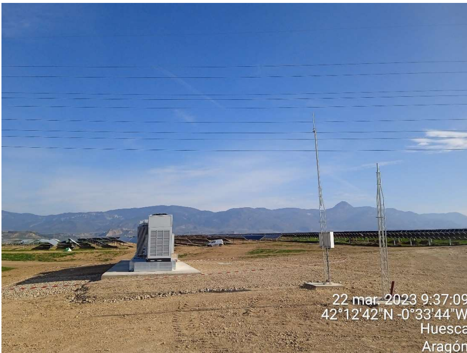
Imagen 6. Vista de uno de los tres Centros de Transformación.