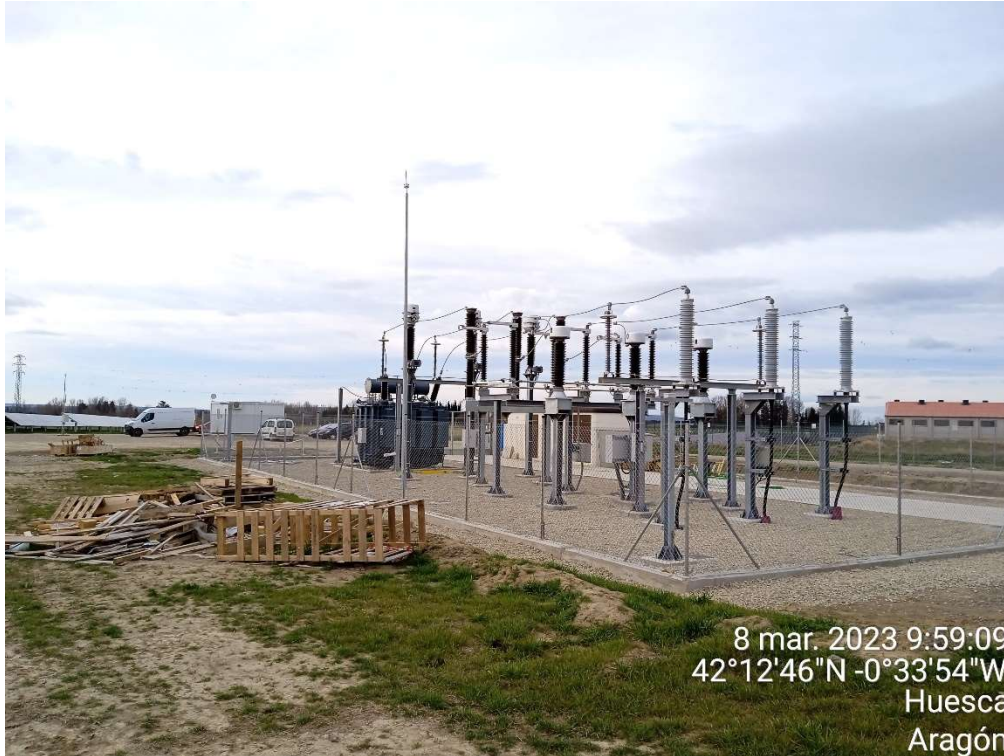
Imagen 9. Trabajos en la Subestación de Transformación.