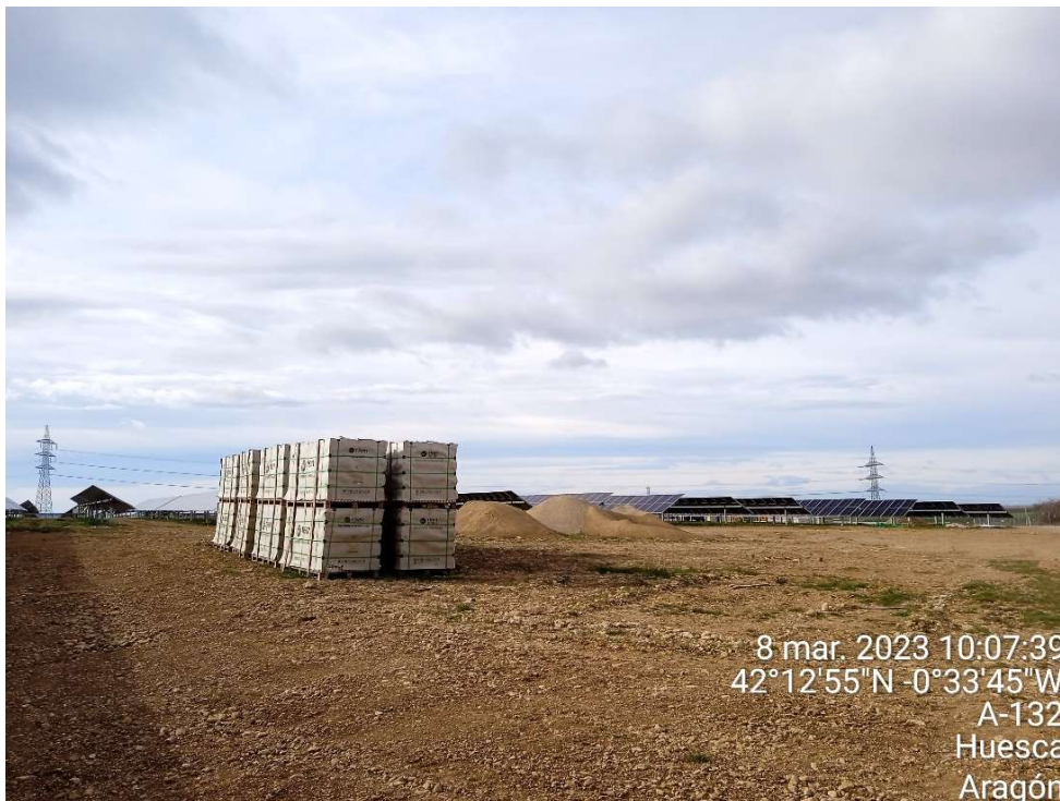
Imagen 6. Palets con los módulos fotovoltaicos esperando para ser instalados.