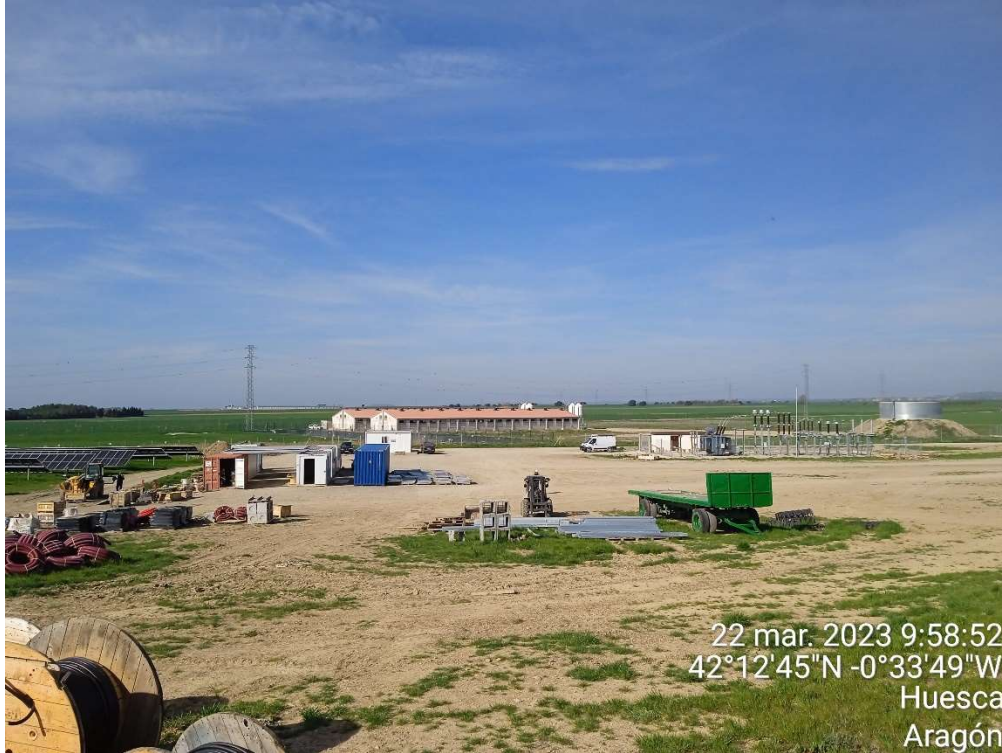
Imagen 7. Zona de instalaciones auxiliares y S.E.T..