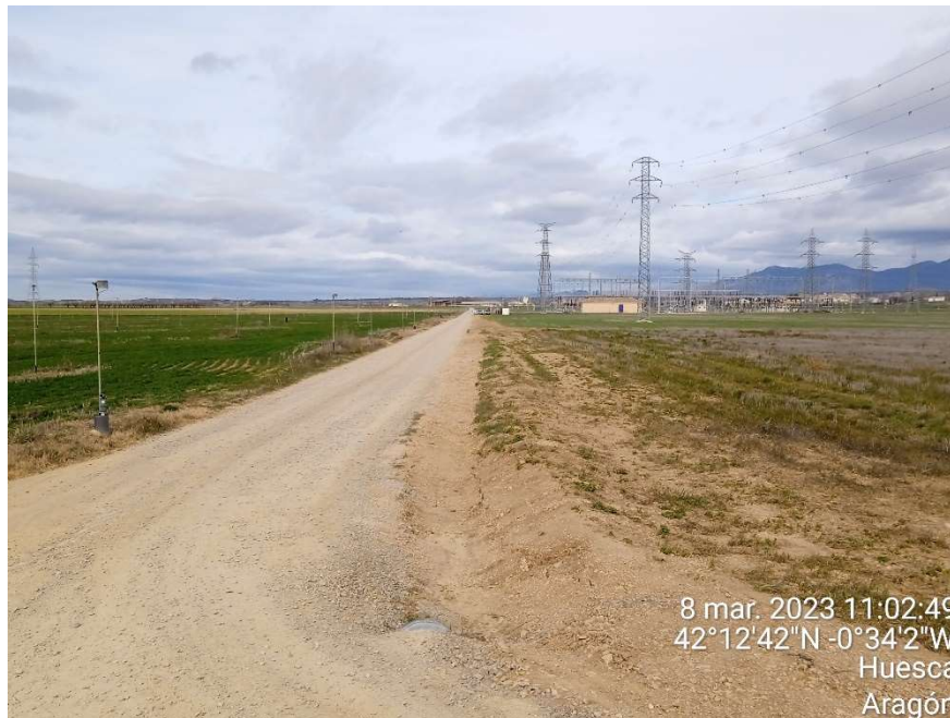
Imagen 1.- Situación final de las obras de tendido de la línea de evacuación de la planta fotovoltaica. Vista hacia la SET 132kV Esquedas.