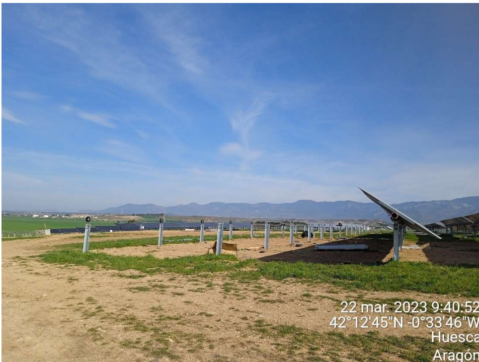
Imagen 4.- Montaje de los últimos seguidores.