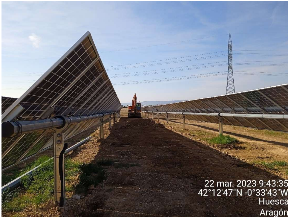
Imagen 3.- Trabajos de extendido de tierra vegetal.