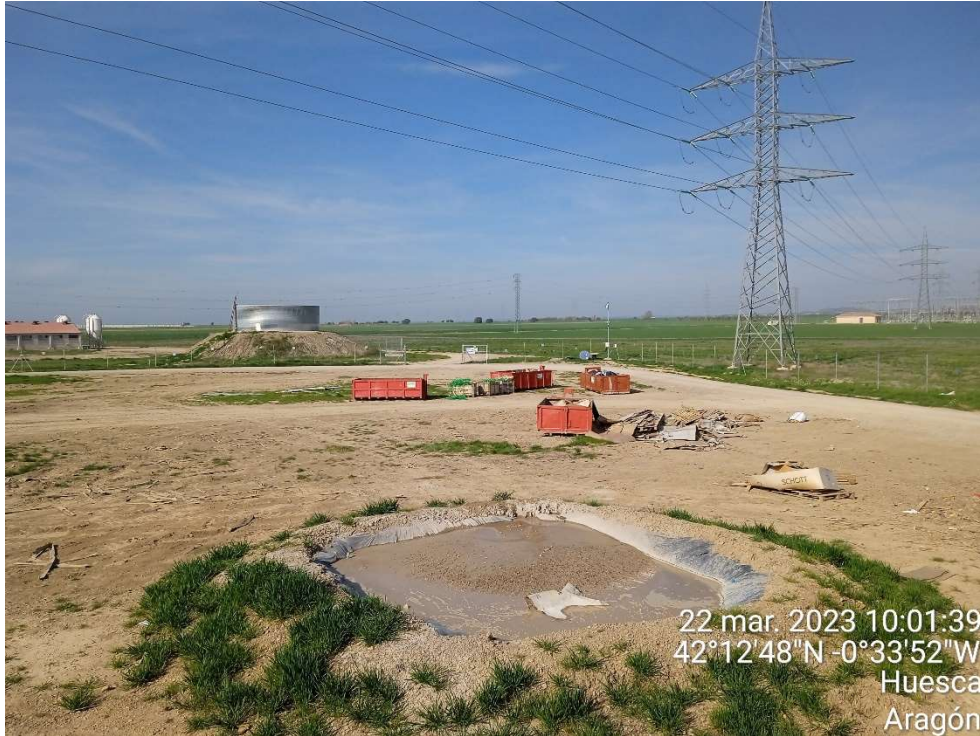
Imagen 9.- Punto limpio de Residuos no peligrosos.