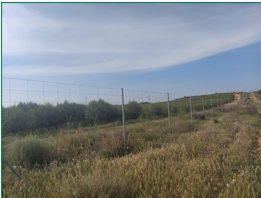
Fotografía 3. Vallado perimetral.

Con objeto de realizar un seguimiento de fauna se han realizado las siguientes acciones: