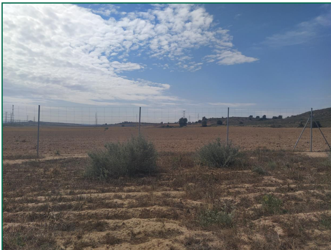
Fotografía 2. Zona revegetada.