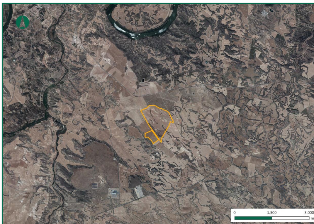
Figura 2. Localización de la zona de estudio.

Se accede al emplazamiento a través de la carretera autonómica A-221, que comunica Escatrón con Caspe, y a partir de esta por caminos rurales que dan acceso a las parcelas.