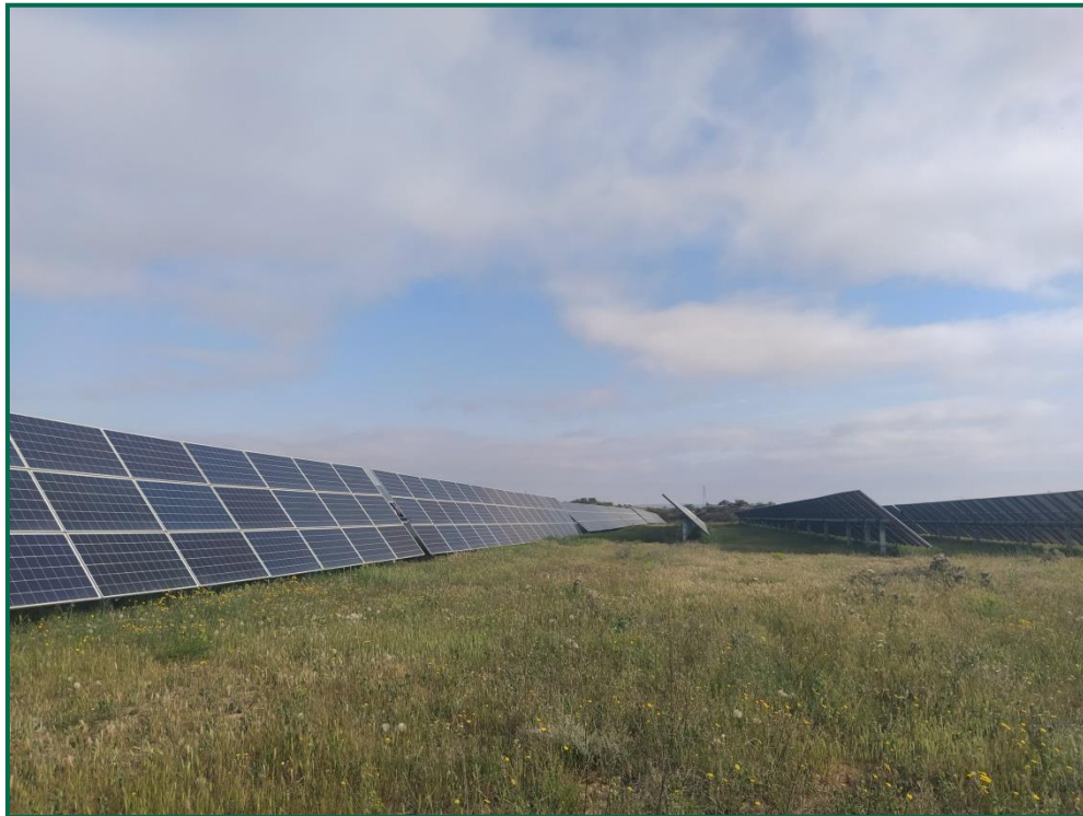
Fotografía 1. Vegetación entre placas actualmente.

Se ha realizado un seguimiento de la evolución de las revegetaciones realizadas durante los meses de invierno de 2020. Estas plantas se desarrollan, aunque se ha observado la desaparición de ejemplares. Durante la primavera se produce un desarrollo de la vegetación espontánea de la zona, que en ocasiones compite con la vegetación plantada. En todo caso esta proliferación vegetal contribuye a evitar la erosión.