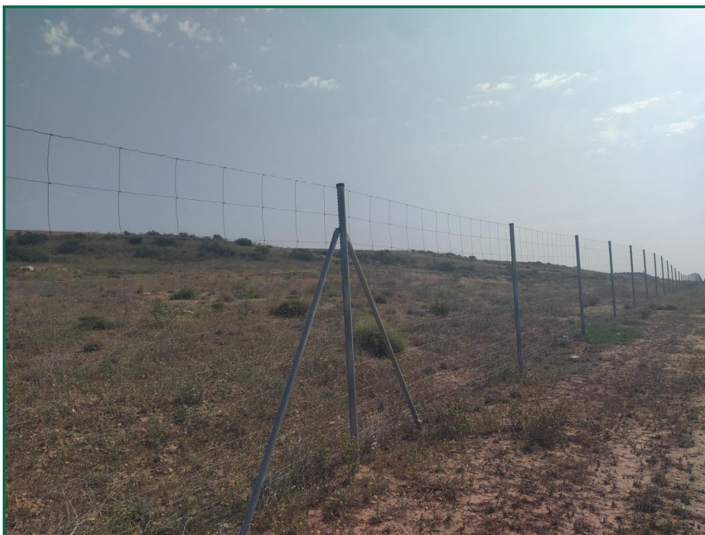
Fotografía 3. Vallado perimetral.

Con objeto de realizar un seguimiento de fauna se han realizado las siguientes acciones: