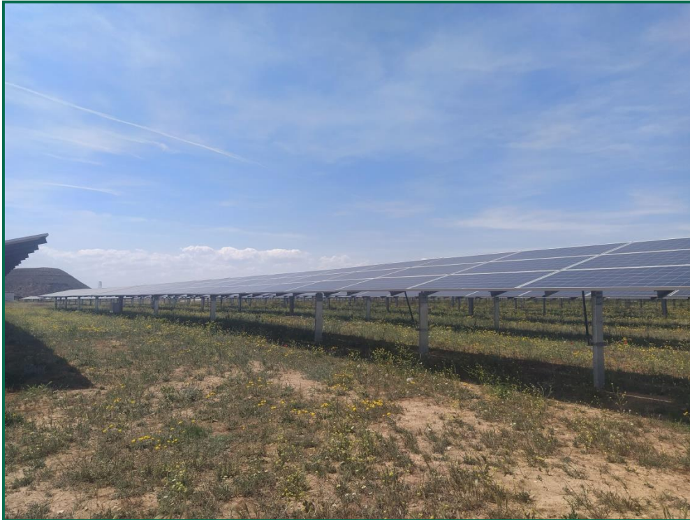
Fotografía 1. Vegetación entre placas actualmente.

Se ha realizado un seguimiento de la evolución de las revegetaciones realizadas durante los meses de invierno de 2020. Estas plantas se desarrollan, aunque se ha observado la desaparición de ejemplares. Durante la primavera se produce un desarrollo de la vegetación espontánea de la zona, que en ocasiones compite con la vegetación plantada. En todo caso esta proliferación vegetal contribuye a evitar la erosión.