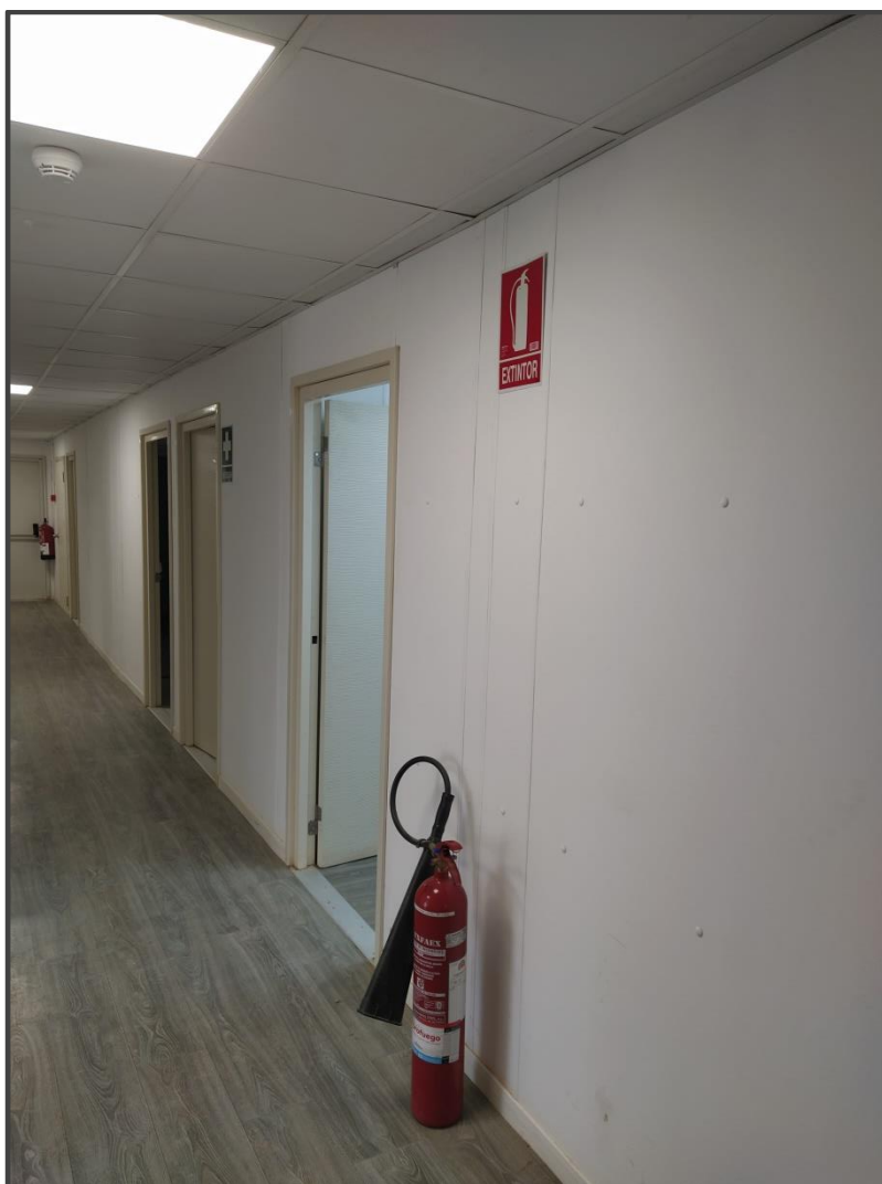
Fotografía 14. Extintores en edificio de control.