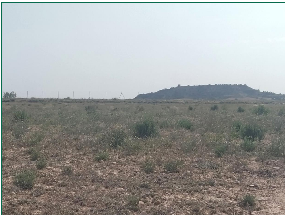
Fotografía 2. Zona revegetada.