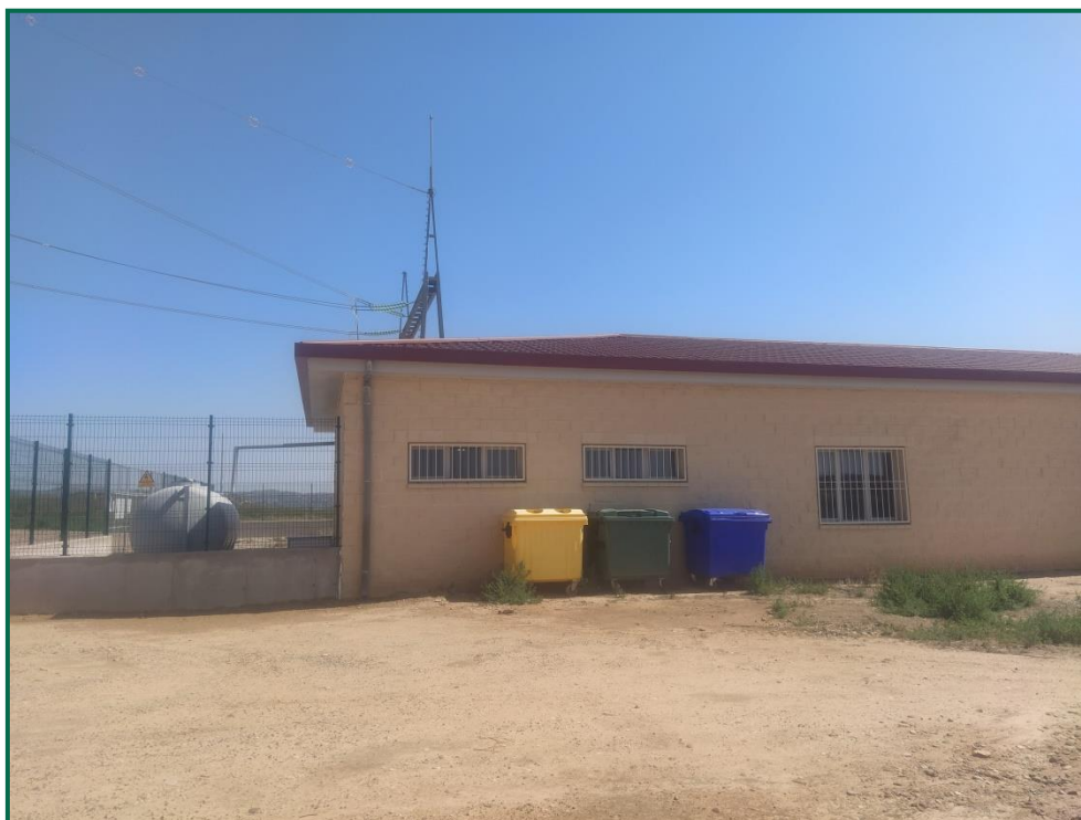
Fotografía 22. Contenedores de residuos no peligrosos en exterior de la subestación.