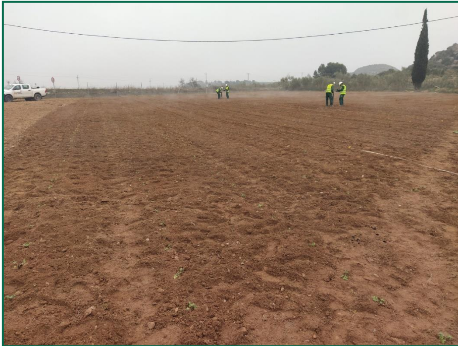
Fotografía 2. Proceso de plantación.