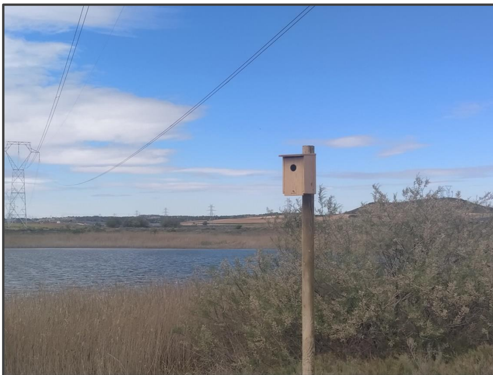
Fotografía 19. Caja para carraca junto a Hoya de Blase.