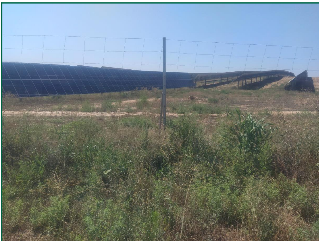
Fotografía 10. Vallado perimetral.

Con objeto de realizar un seguimiento de fauna en explotación se han realizado las siguientes acciones: