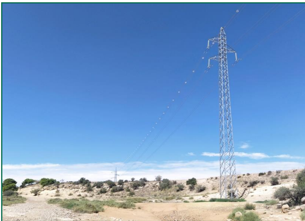
Fotografía 9. Línea eléctrica con balizas salvapájaros

Respecto al vallado perimetral, se ha utilizado malla cinagética que permite el paso de fauna de pequeño tamaño. Este vallado mide 2 metros de altura total y está formado por una serie de alambres verticales y horizontales, con una separación entre los verticales de 30cm, y entre los horizontales de mínimo 15cm en la línea inferior. En la planta fotovoltaica, esta malla está colocada dejando 15 cm libres desde el suelo al primer alambre. Se trata de un vallado con permeabilidad para la fauna, no presenta elementos cortantes ni punzantes.