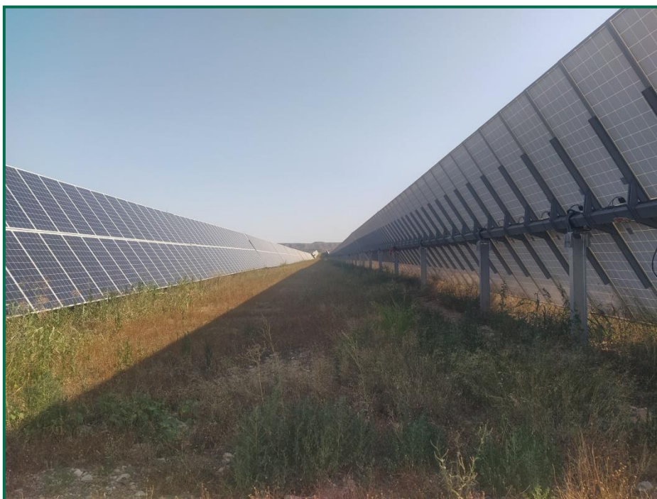
Fotografía 1. Vegetación entre placas actualmente.

En el periodo que abarca este informe no se han realizado podas mecánicas, se ha introducido ganado ovino en todas las plantas solares con objeto de recortar esta vegetación, a la vez que aportan nutrientes al suelo. No se han utilizado herbicidas.