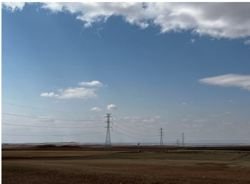
Figura 2 LAAT SET Valdompere-SET Fuentes

El presente anexo se compone de un número representativo de fotografías del total realizado durante el periodo evaluado, escogidas por su relevancia y/o carácter explicativo para la correcta comprensión del presente informe.