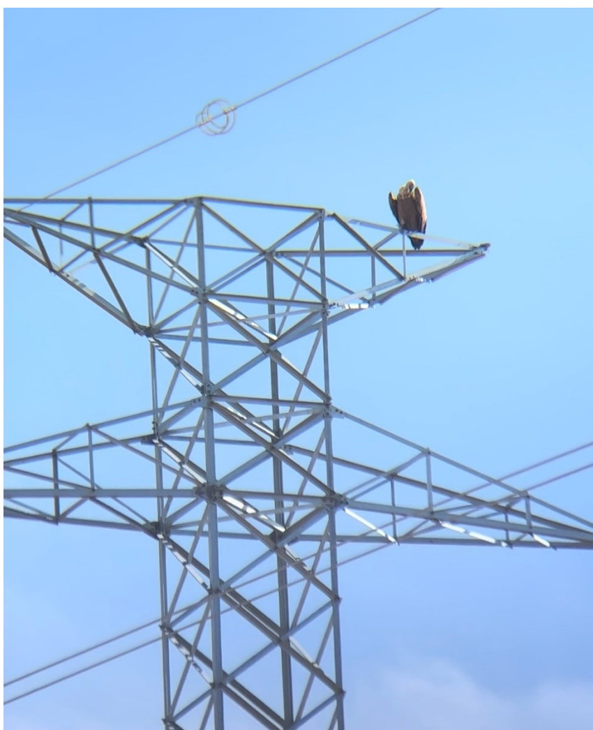
Figura 2 Buitre leonado (Gyps fulvus)

El presente anexo se compone de un número representativo de fotografías del total realizado durante el periodo evaluado, escogidas por su relevancia y/o carácter explicativo para la correcta comprensión del presente informe.