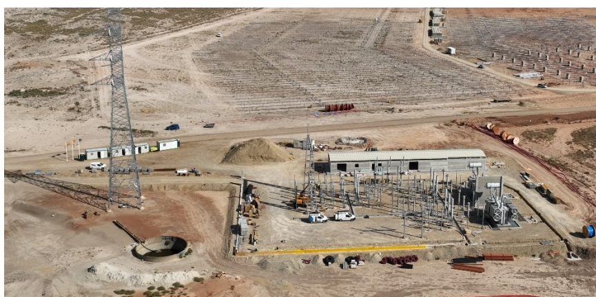
Figura 5 Vista aérea de la SET Valdompere