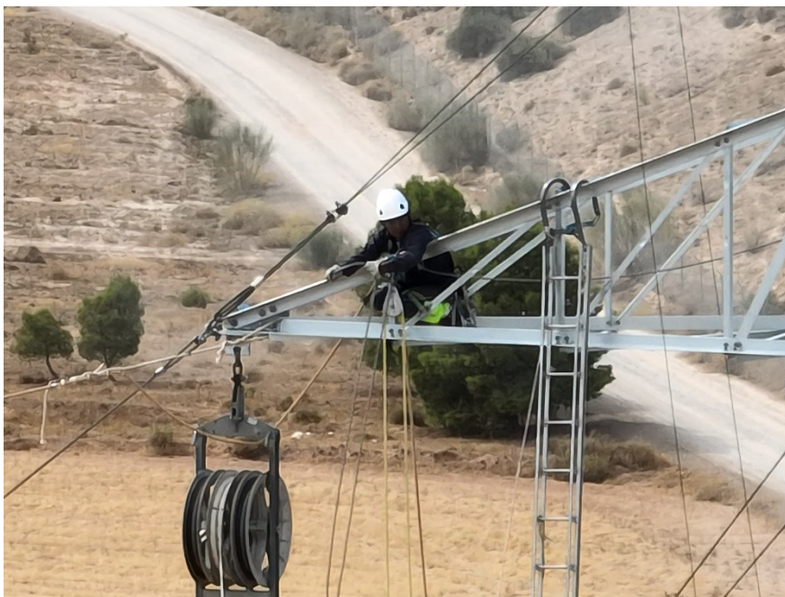
Figura 4 Colocación de las poleas para la tirada de cable

El presente anexo se compone de un número representativo de fotografías del total realizado durante el periodo evaluado, escogidas por su relevancia y/o carácter explicativo para la correcta comprensión del presente informe.