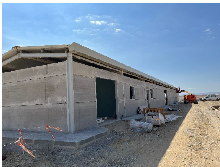
Figura 2 Cimentaciones de la SET

Durante este mes, también se han avanzado con estos trabajos, realizando labores de cimentación de alguno de los apoyos (Figura 3).