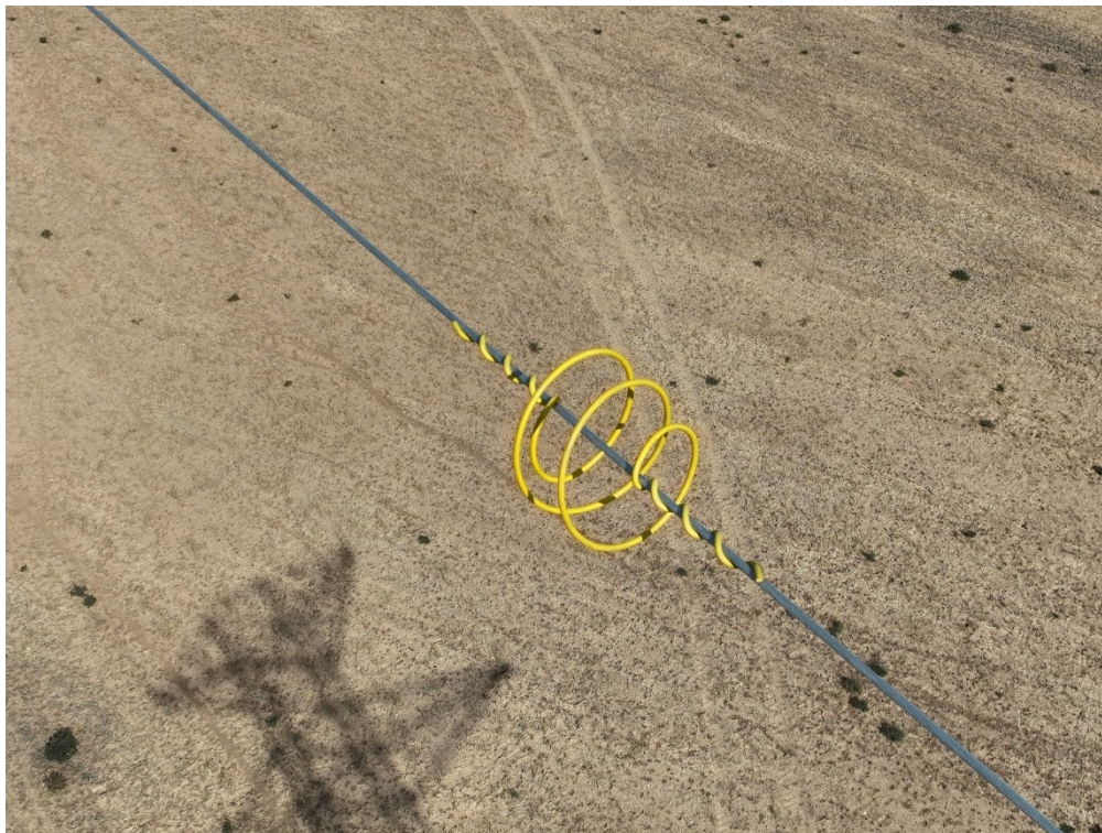
Figura 6 Colocación de las espirales anticollisión