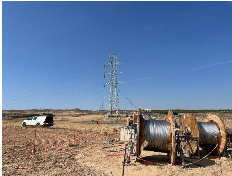
Figura 3 Tirada de cable de alta tensión