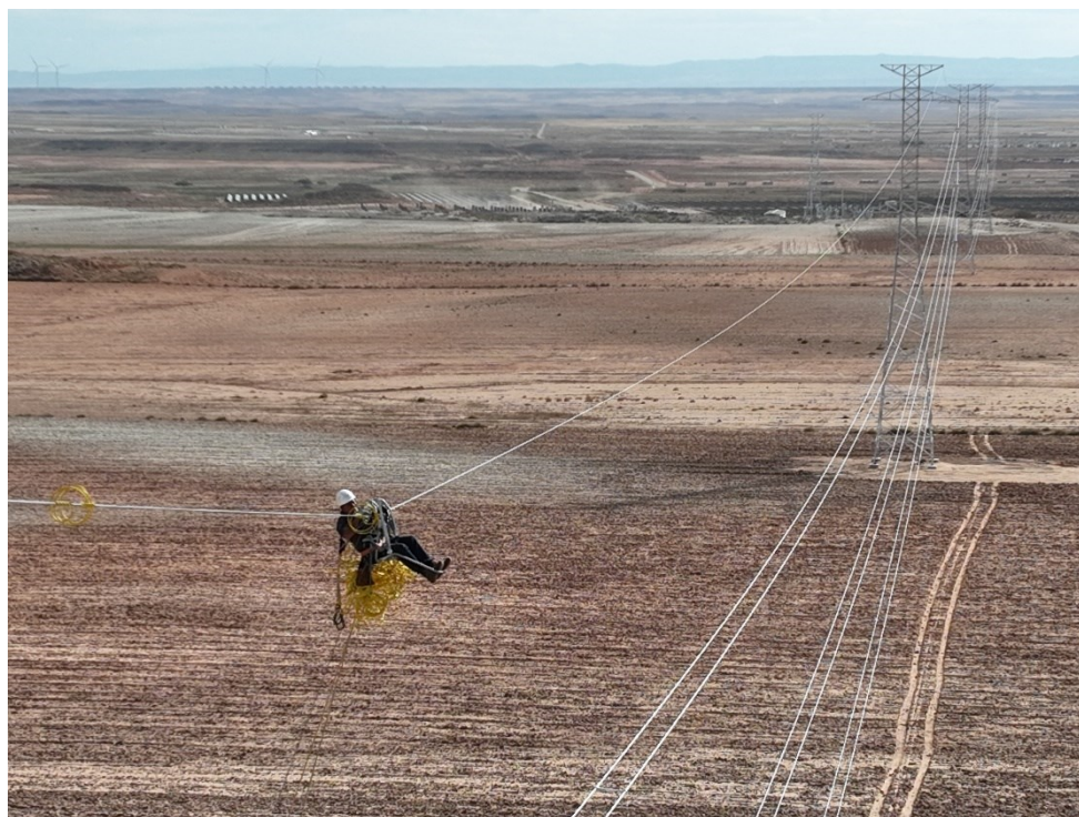
Figura 7 Colocación de los protectores anticollisión