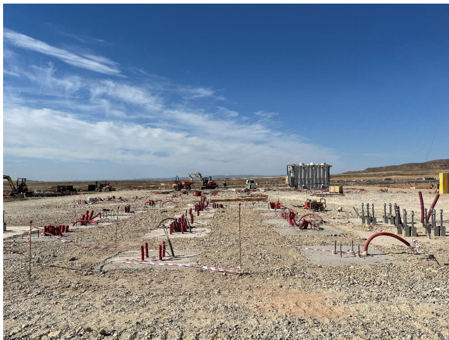
Figura 5 SET Valdompere

El presente anexo se compone de un número representativo de fotografías del total realizado durante el periodo evaluado, escogidas por su relevancia y/o carácter explicativo para la correcta comprensión del presente informe.