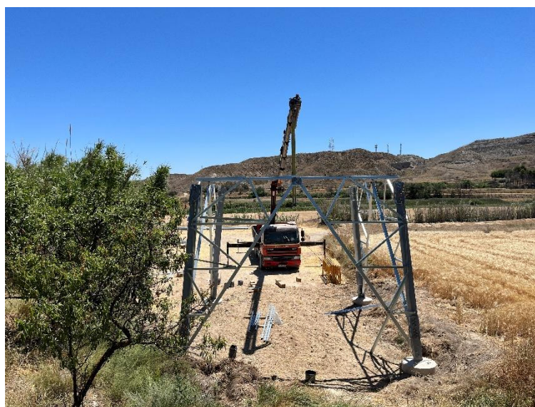
Figura 4 Montaje de la estructura apoyo 34

Así mismo, continúan los trabajos de montaje (Figura 4) e izado de los apoyos, todos estos trabajos han respetado las áreas de ocupación y no se han detectado afecciones. También se han comenzado con la colocación del cable de alta tensión.