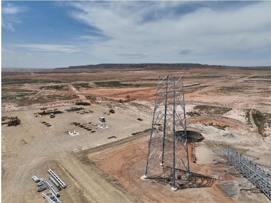
Figura 9 Vista aérea SET Valdompere y el apoyo 1