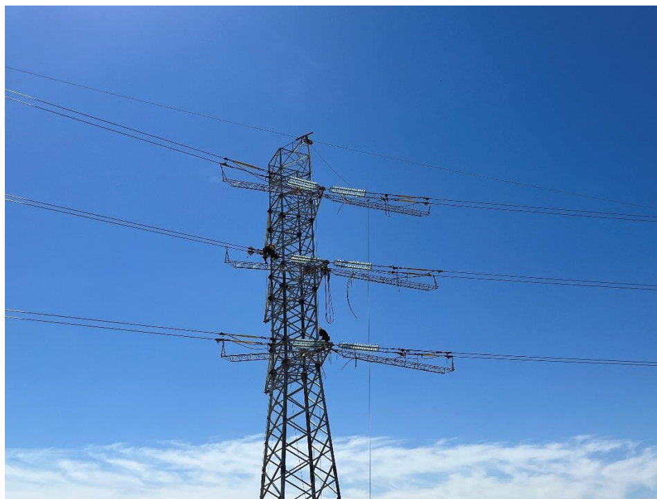
Figura 8 Tendido de cable de alta tensión