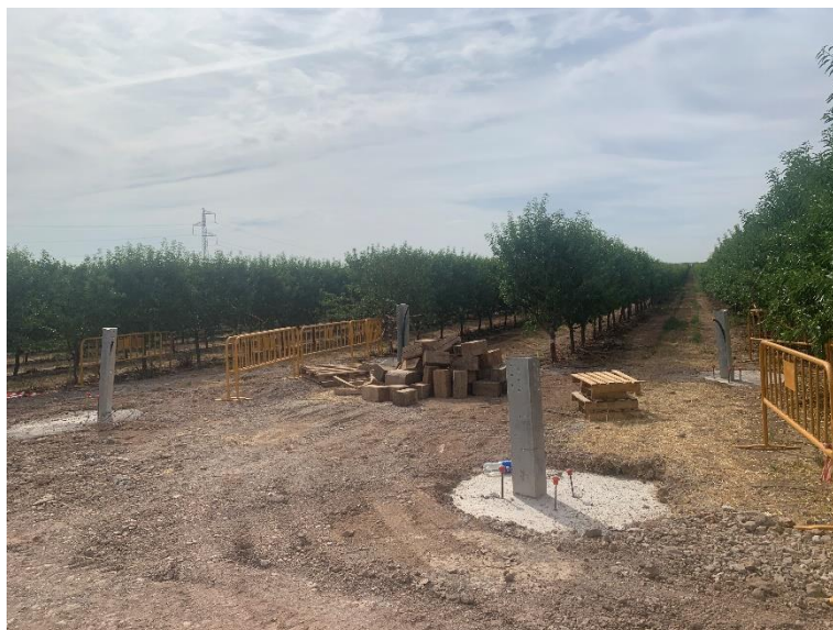
Figura 3 Apoyo 17 cimentado

Durante este mes, también se han avanzado con estos trabajos, realizando labores de cimentación de alguno de los apoyos (Figura 3).