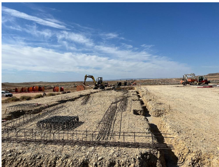
Figura 6 SET Valdompere