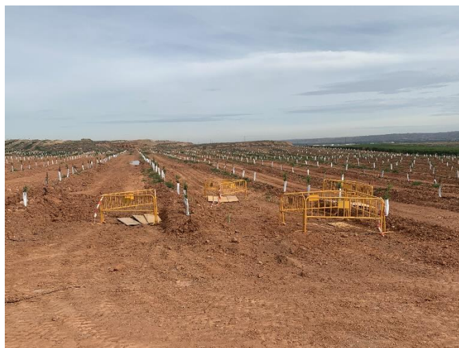
Figura 2 Excavación de los cimientos del apoyo 15

Esta actividad se ha desarrollado principalmente con la excavación de los cimientos de los apoyos (Figura 2) para su posterior hormigonado y en la apertura de los accesos.