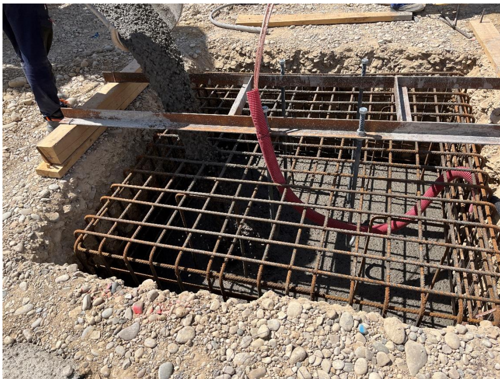
Figura 7 Cimentación SET Valdompere