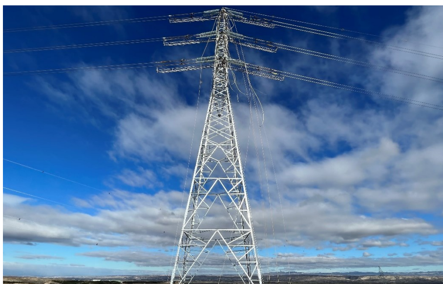
Figura 6 Ap. 32