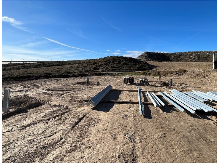
Figura 2 Ap. 35

Se ha tapado la excavación realizada en el apoyo 35 tras su cimentación.