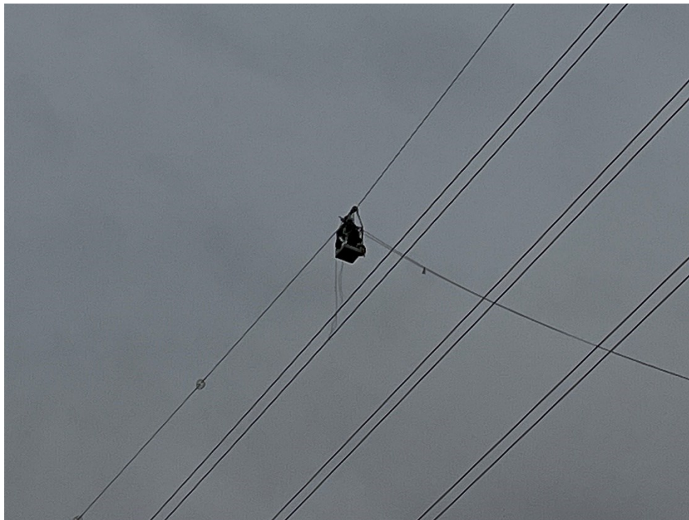
Figura 9 Colocación de las espirales anticollisión para pájaros