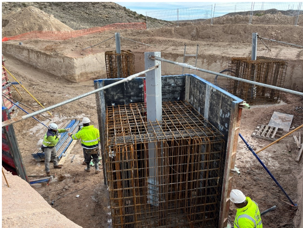
Figura 8 Encofrado Ap. 35