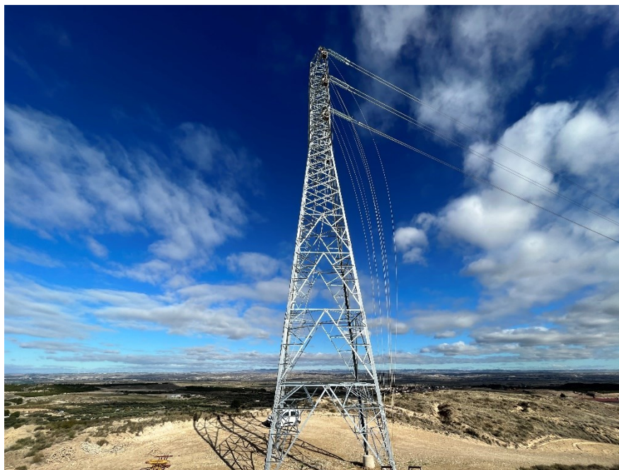
Figura 5 Fijación de cable Ap. 33

El presente anexo se compone de un número representativo de fotografías del total realizado durante el periodo evaluado, escogidas por su relevancia y/o carácter explicativo para la correcta comprensión del presente informe.