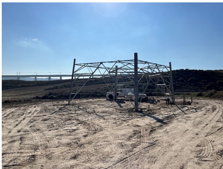
Figura 4 Montaje estructura apoyo 35

Así mismo, continúan los trabajos de montaje (Figura 4). Se han izado los apoyos 31, 32 y 33, y se ha montado la estructura del Ap. 35. Todos estos trabajos han respetado las áreas de ocupación y no se han detectado afecciones. También se han continuado con la colocación del cable de alta tensión, los protectores para aves y los separadores.