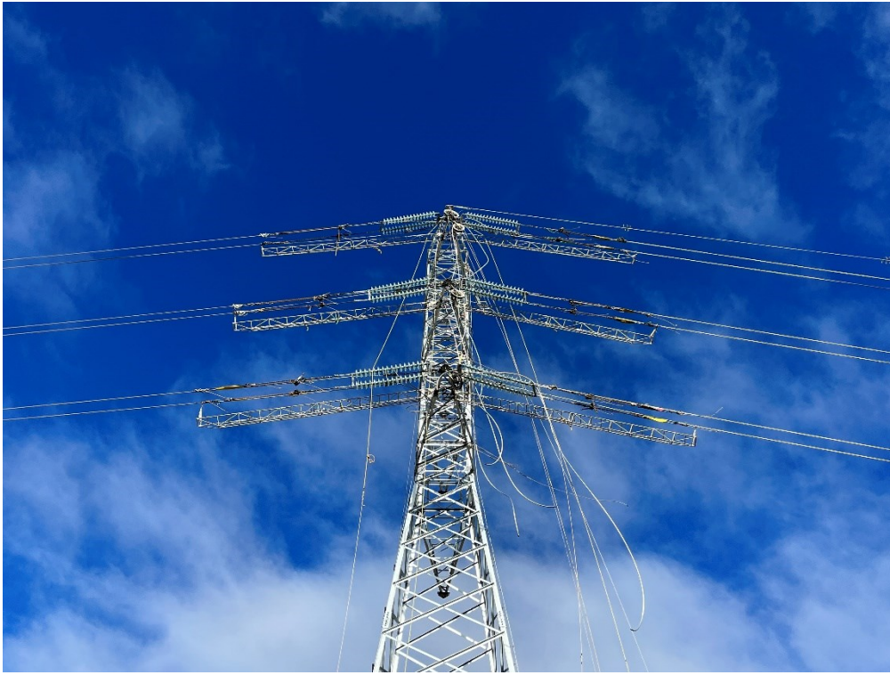
Figura 7 Fijación cable de alta tensión Ap. 31