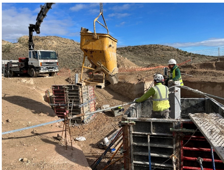
Figura 3 Cimentación del Ap. 35

Durante este mes, también se han avanzado con estos trabajos, realizando labores de cimentación de la Set Valdompere y en el apoyo 35.