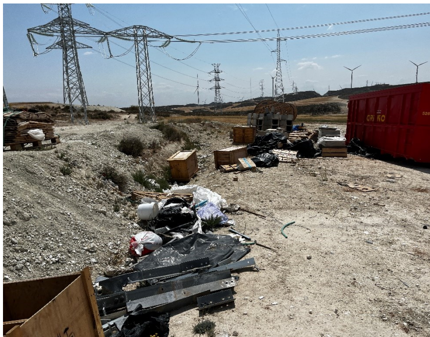
Figura 2 Restos de material de construcción

El presente anexo se compone de un número representativo de fotografías del total realizado durante el periodo evaluado, escogidas por su relevancia y/o carácter explicativo para la correcta comprensión del presente informe.