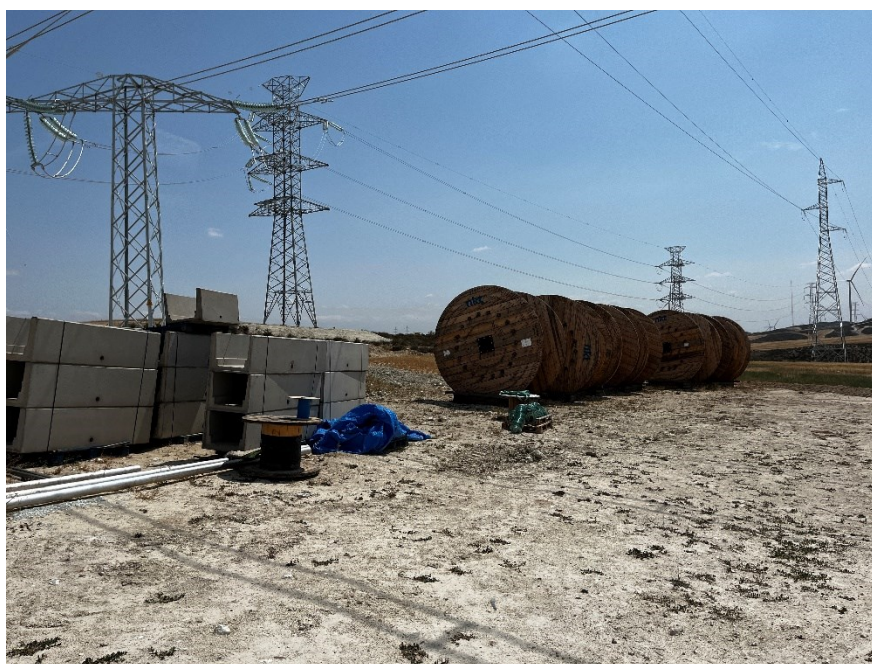
Figura 3 Acopio de material de construcción