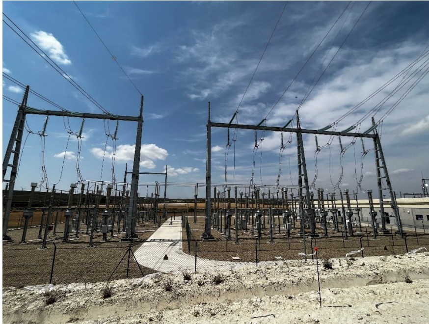
Figura 4 CS Ave