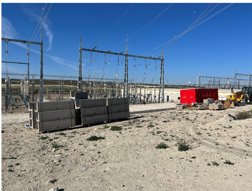
Figura 3 Acopio de material de construcción