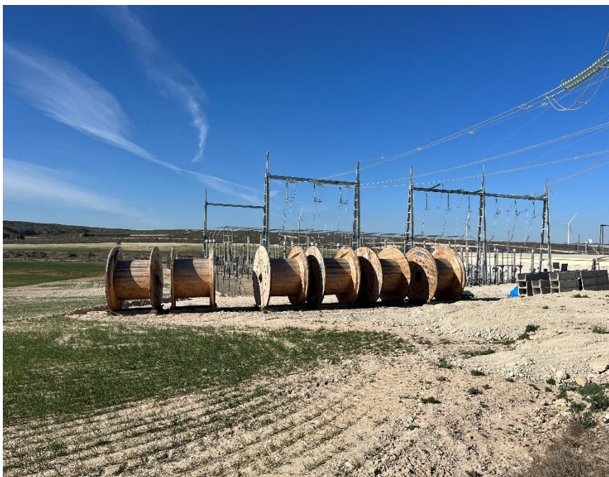
Figura 2 Restos de material de construcción

El presente anexo se compone de un número representativo de fotografías del total realizado durante el periodo evaluado, escogidas por su relevancia y/o carácter explicativo para la correcta comprensión del presente informe.