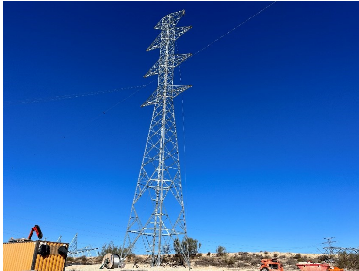
Figura 2 Apoyo 2 CS Ave-SET Ave

Este mes se ha realizado el montaje de la estructura del apoyo 1 y 2 de CS Ave-SET Ave