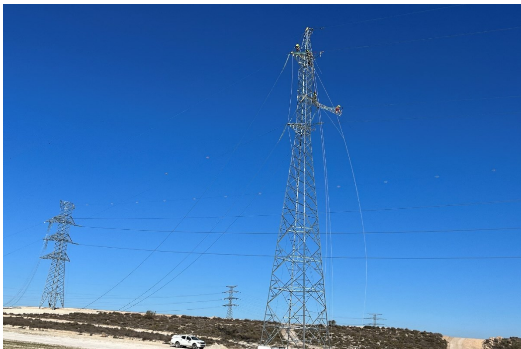
Figura 7 Cableado del Apoyo 99