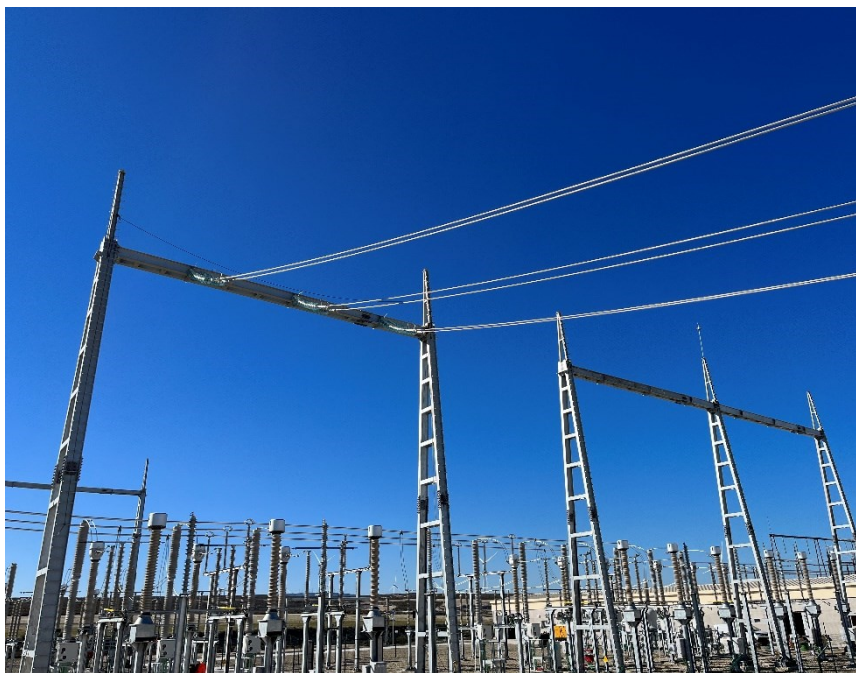
Figura 4 Tendido cable de alta tensión pórtico CS Ave

El presente anexo se compone de un número representativo de fotografías del total realizado durante el periodo evaluado, escogidas por su relevancia y/o carácter explicativo para la correcta comprensión del presente informe.