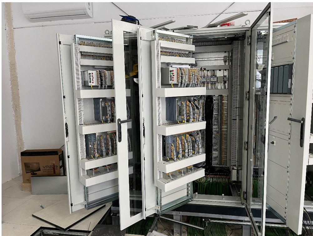
Figura 6 Cableado de los armarios CS Ave