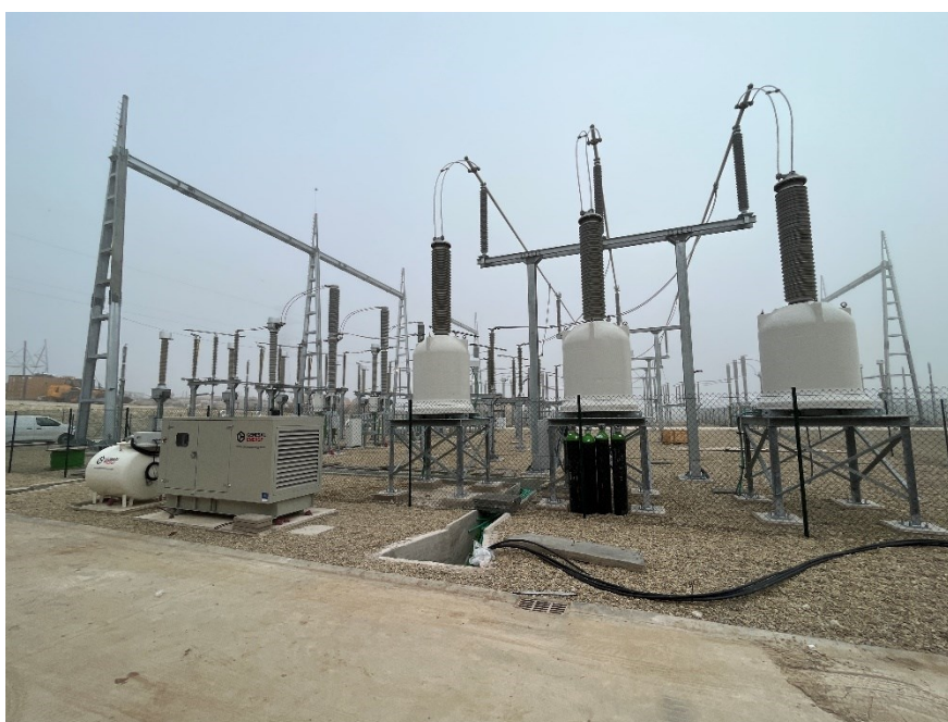
Figura 5 CS Ave