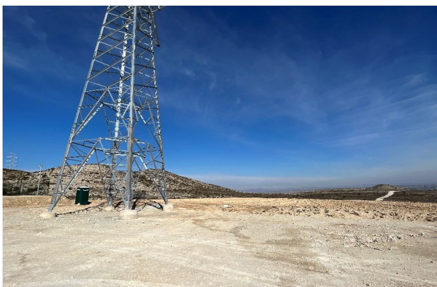
Figura 3 Retirada del acopio temporal de RNP de la SET Fuentes

Se mantiene un nivel de orden y limpieza óptimo, tras el acopio de materiales para la fase de construcción se está realizando dentro de las zonas delimitadas.