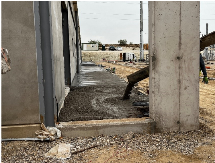
Figura 2 CS Ave

Durante este mes, también se han avanzado con estos trabajos, realizando labores de cimentación en las subestaciones.