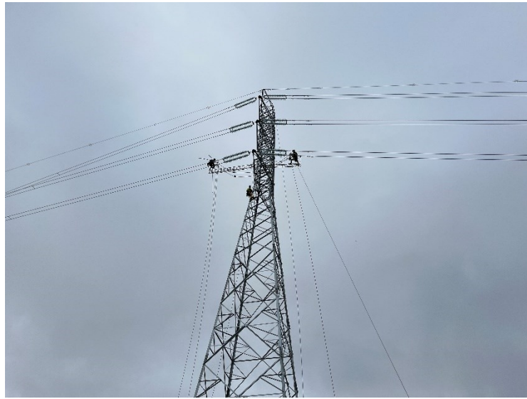
Figura 3 Fijado del cable de alta tensión