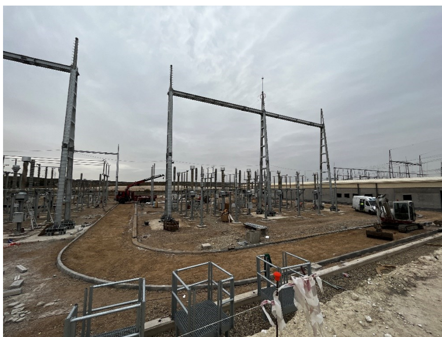
Figura 6 CS Ave