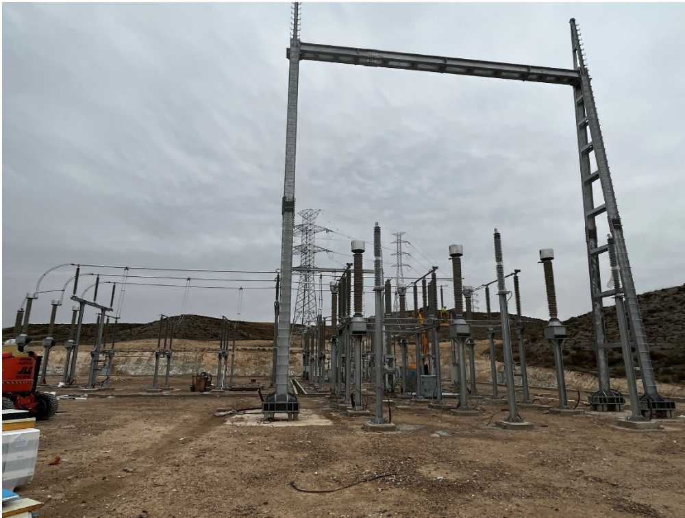
Figura 7 SET Fuentes