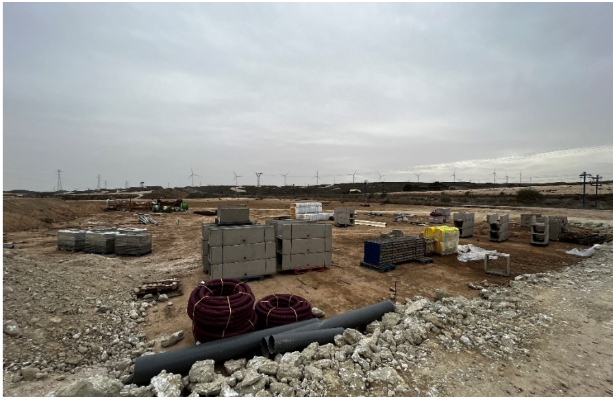
Figura 4 Material de construcción CS Ave

Se mantiene un nivel de orden y limpieza óptimo, tras el acopio de materiales para la fase de construcción se está realizando dentro de las zonas delimitadas.