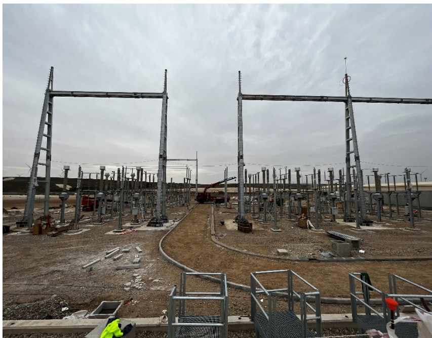
Figura 5 CS Ave

El presente anexo se compone de un número representativo de fotografías del total realizado durante el periodo evaluado, escogidas por su relevancia y/o carácter explicativo para la correcta comprensión del presente informe.