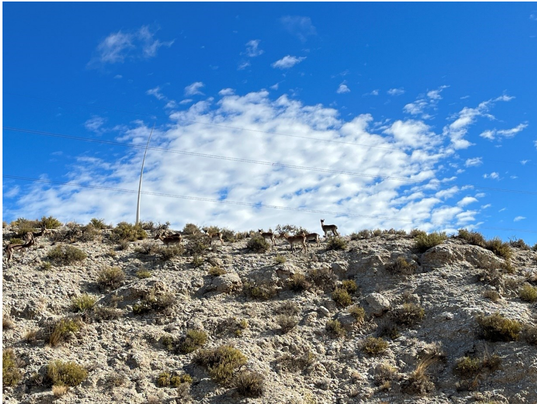
Figura 11 Grupo de cabras montesas