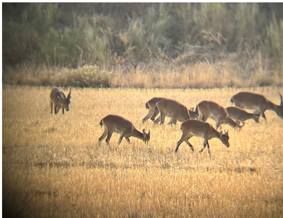
Figura 10 Grupo de cabras montesas