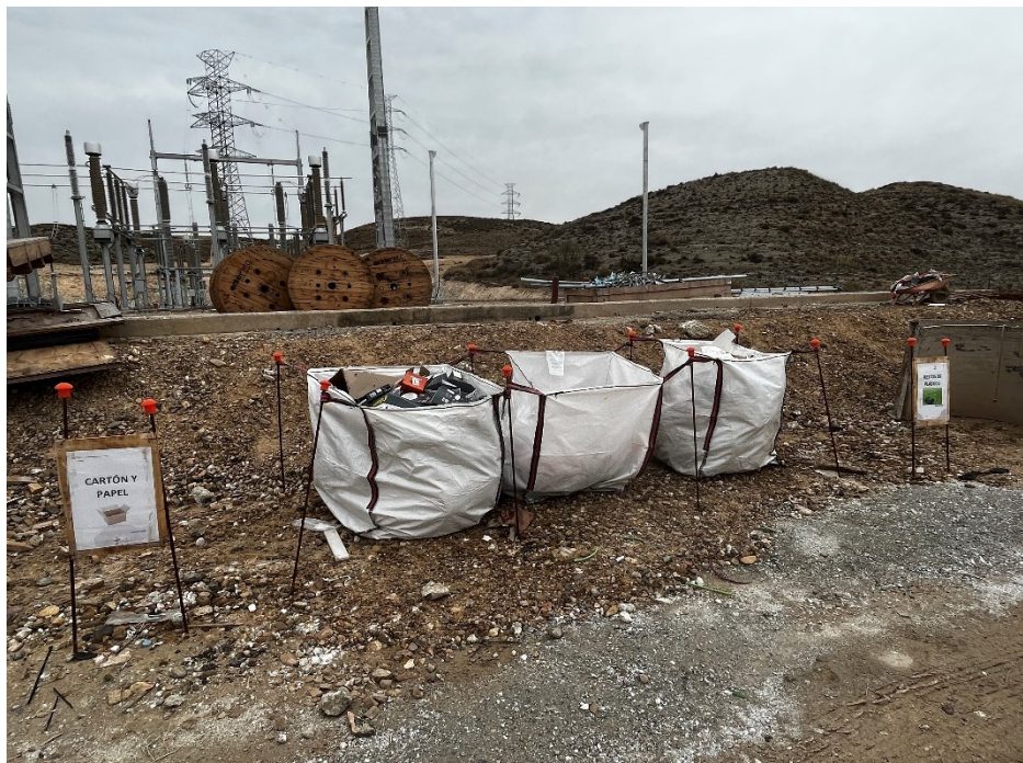
Figura 9 Punto limpio de RNP Set Fuentes