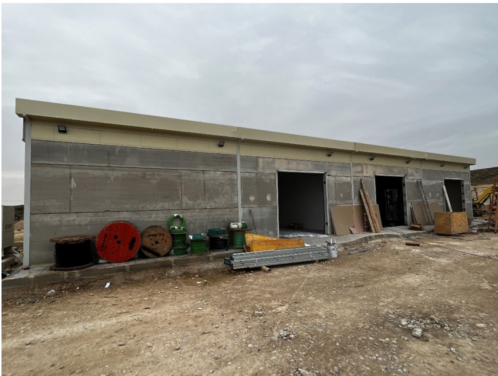
Figura 8 SET Fuentes