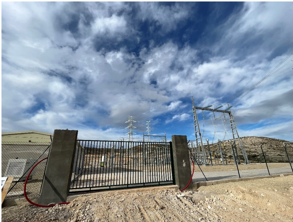
Figura 6 SET Fuentes