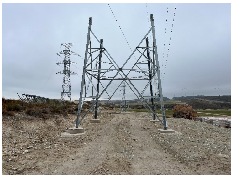
Figura 2 Apoyo 2 CS Ave-SET Fuentes

Este mes se ha realizado el montaje de la estructura del apoyo 1 y 2 de CS Ave-SET Ave