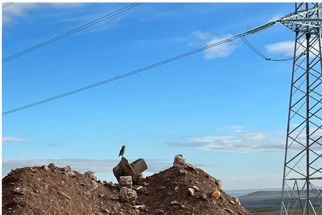
Figura 7 Mochuelo común (Athene noctua)