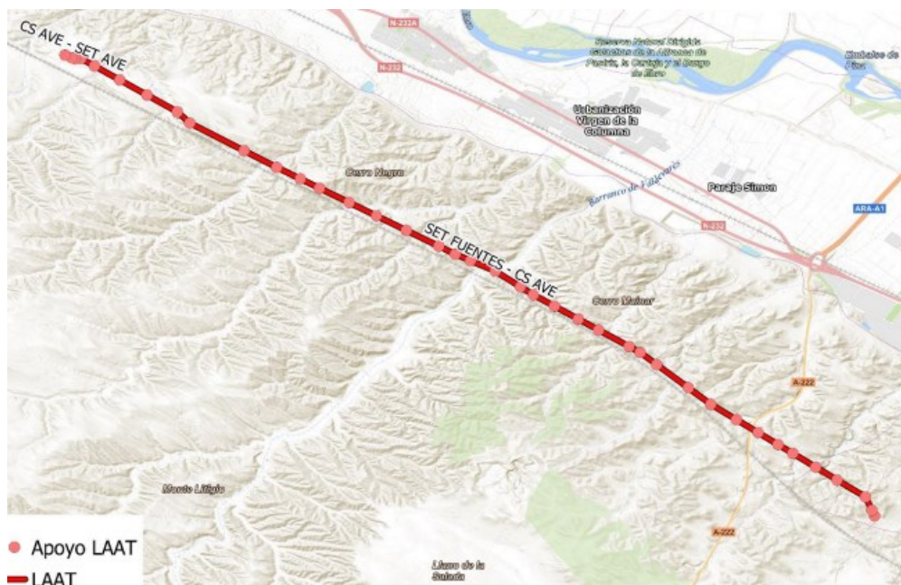
Figura 1 Localización de la LAAT