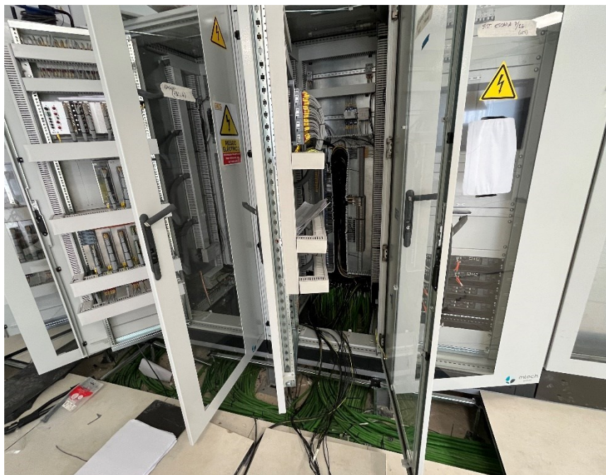
Figura 4 Cableado de los armarios CS Ave

El presente anexo se compone de un número representativo de fotografías del total realizado durante el periodo evaluado, escogidas por su relevancia y/o carácter explicativo para la correcta comprensión del presente informe.