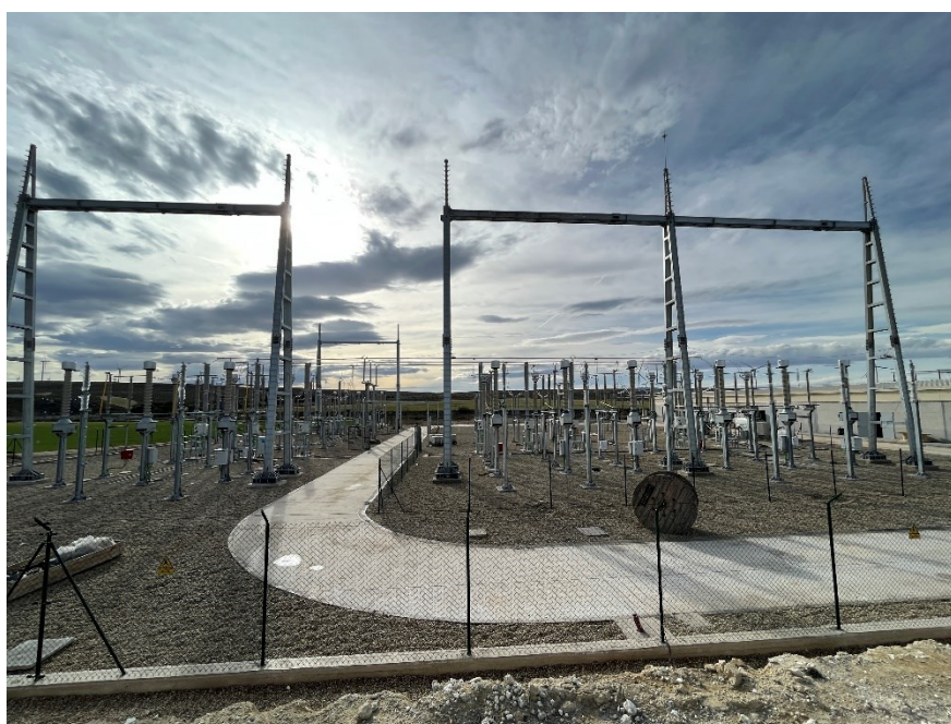
Figura 5 CS Ave