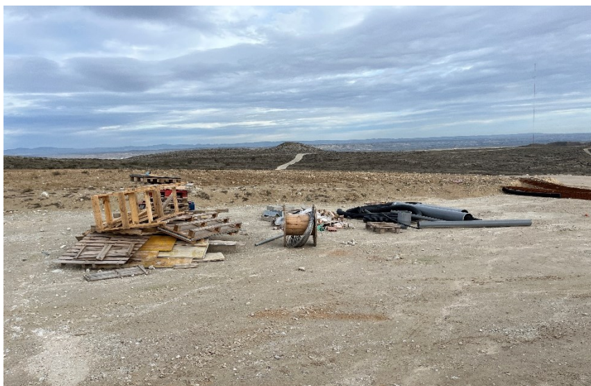
Figura 3 Punto limpio de residuos no peligrosos SET Fuentes

Se mantiene un nivel de orden y limpieza óptimo, tras el acopio de materiales para la fase de construcción se está realizando dentro de las zonas delimitadas.