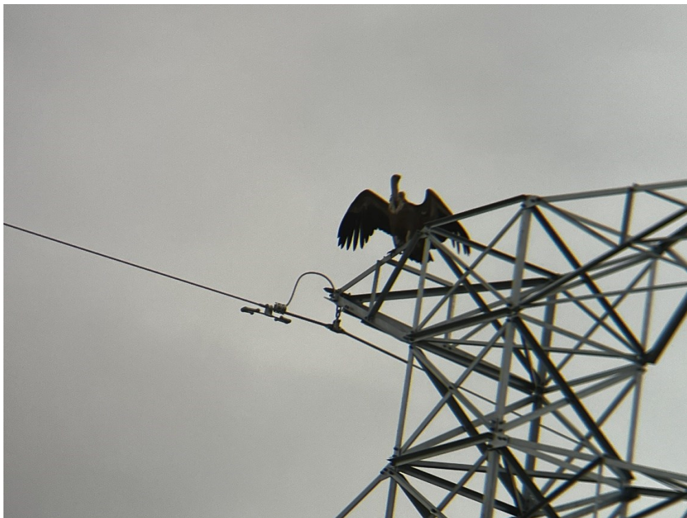
Figura 8 Buitre leonado (Gyps fulvus)