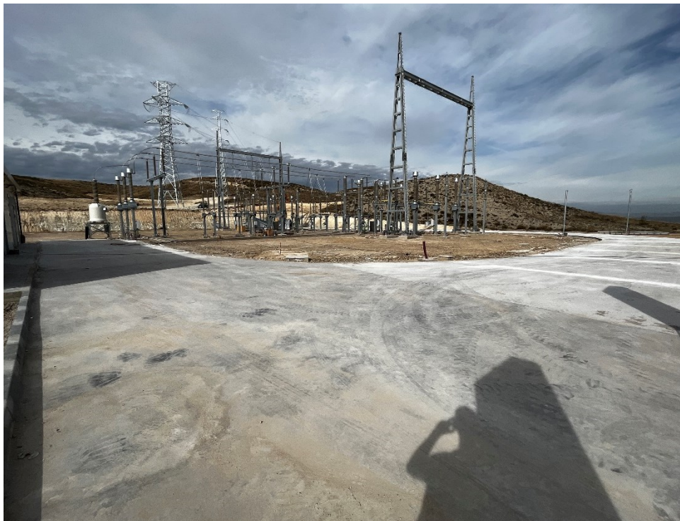
Figura 10 SET Fuentes