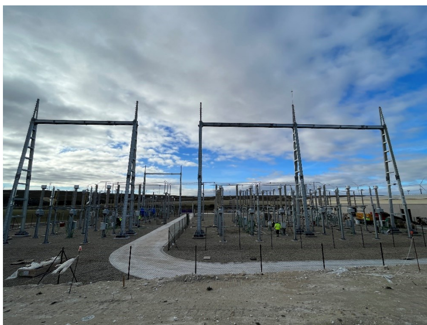
Figura 6 CS Ave