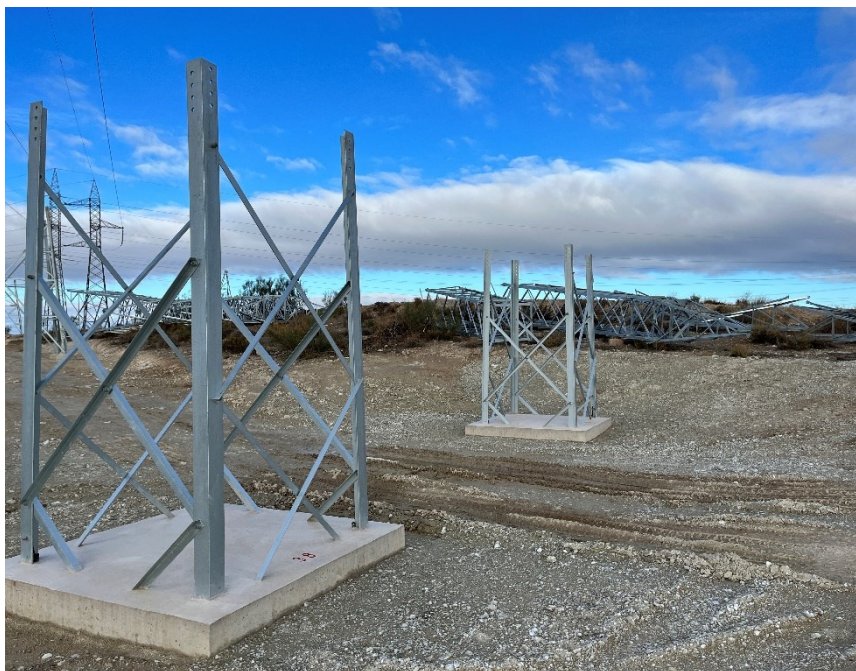
Figura 5 Ap. 38

El presente anexo se compone de un número representativo de fotografías del total realizado durante el periodo evaluado, escogidas por su relevancia y/o carácter explicativo para la correcta comprensión del presente informe.