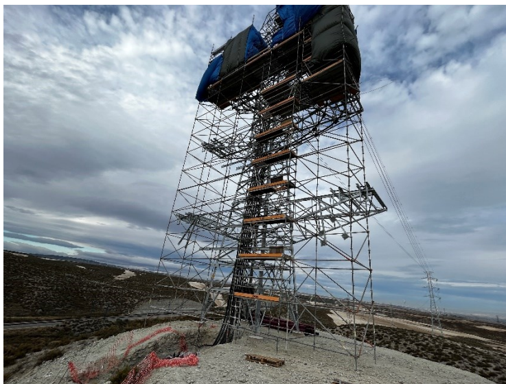
Figura 3 Fijado del cable de alta tensión