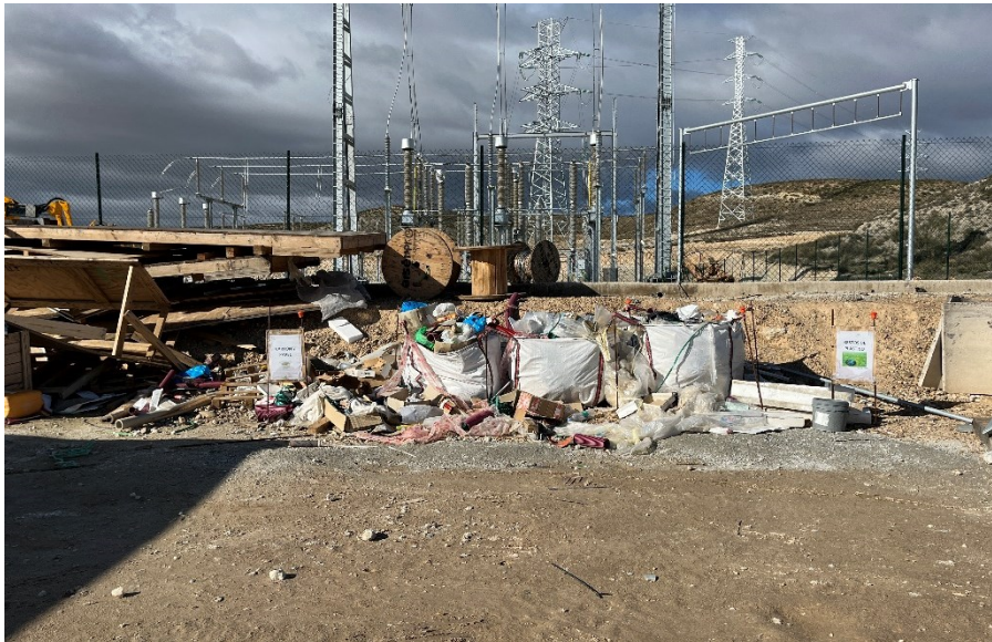
Figura 4 Punto limpio de residuos no peligrosos SET Fuentes

Se mantiene un nivel de orden y limpieza óptimo, tras el acopio de materiales para la fase de construcción se está realizando dentro de las zonas delimitadas.