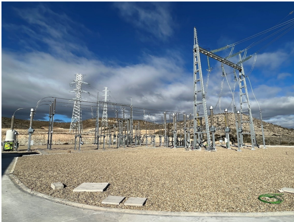
Figura 7 SET Fuentes