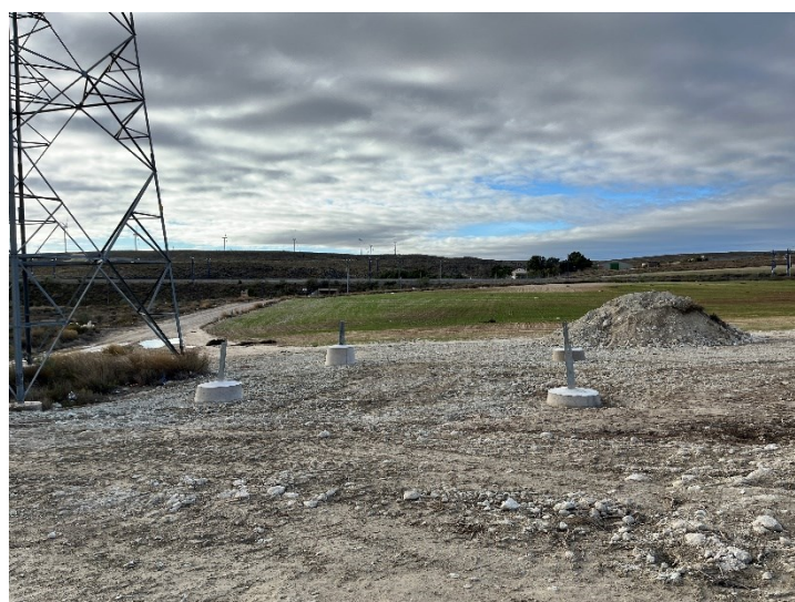
Figura 2 Apoyo 99 cimentado

Durante este mes, también se han avanzado con estos trabajos, realizando labores de cimentación en las subestaciones y de Apoyo 99.