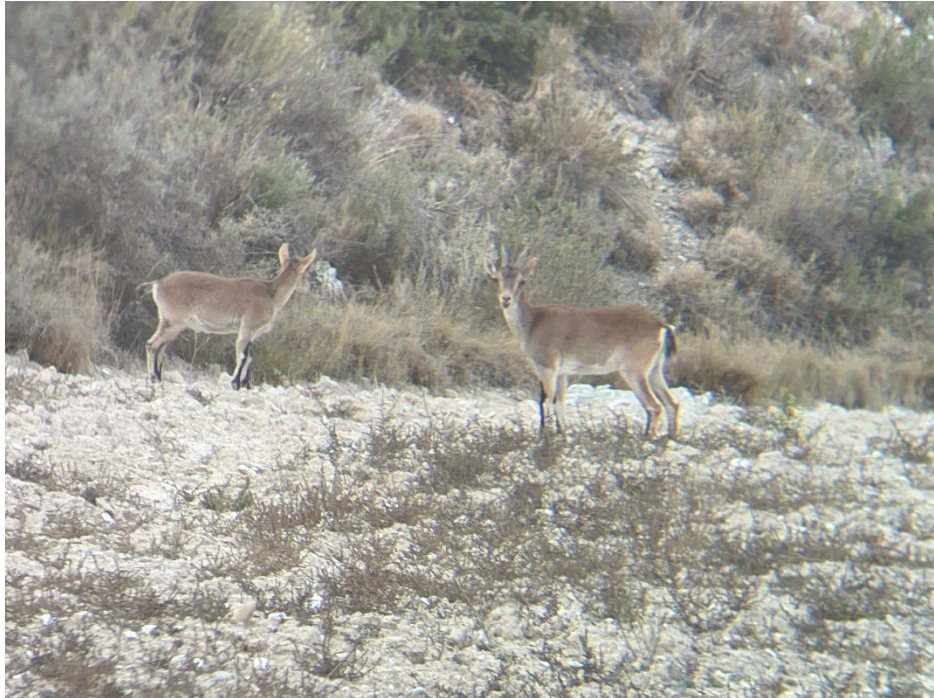
Figura 9 Pareja de cabras montesas