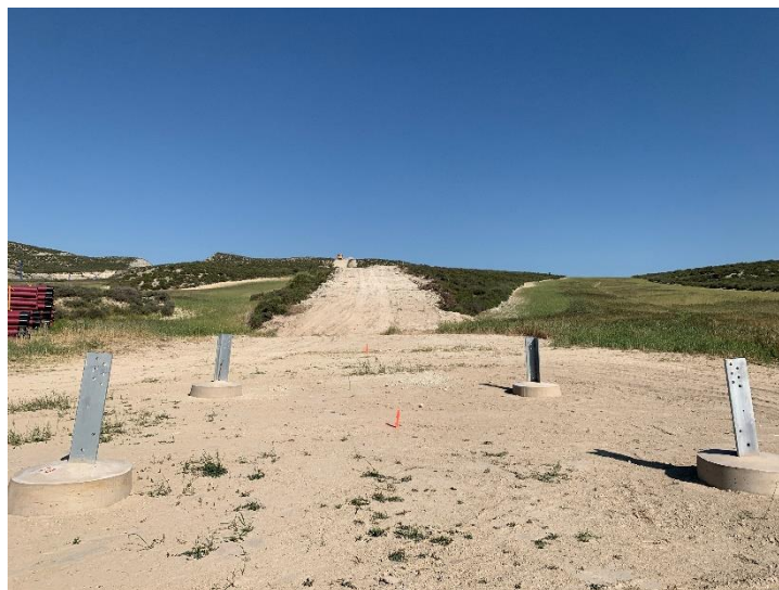
Figura 3 Apoyo 32 hormigonado

Durante este mes, también se han avanzado con estos trabajos, realizando labores de cimentación de alguno de los apoyos (Figura 3).