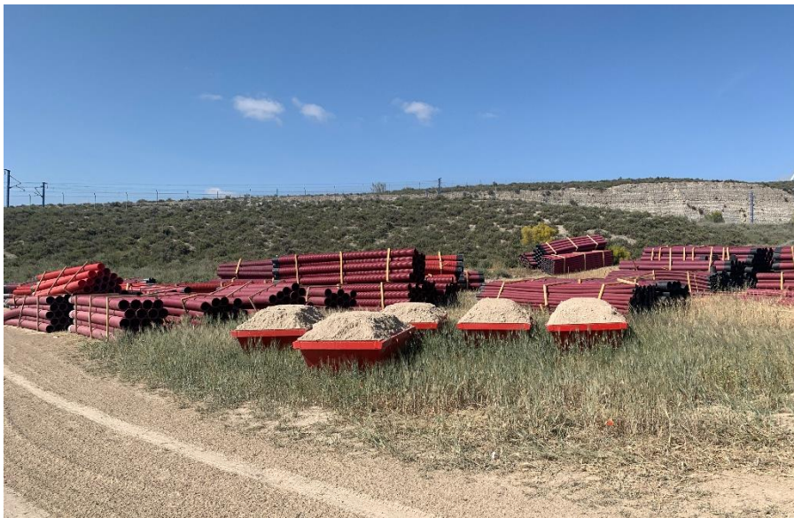
Figura 6 Orden y limpieza

Se mantiene un nivel de orden y limpieza óptimo, tras el acopio de materiales para la fase de construcción se está realizando dentro de las zonas delimitadas.