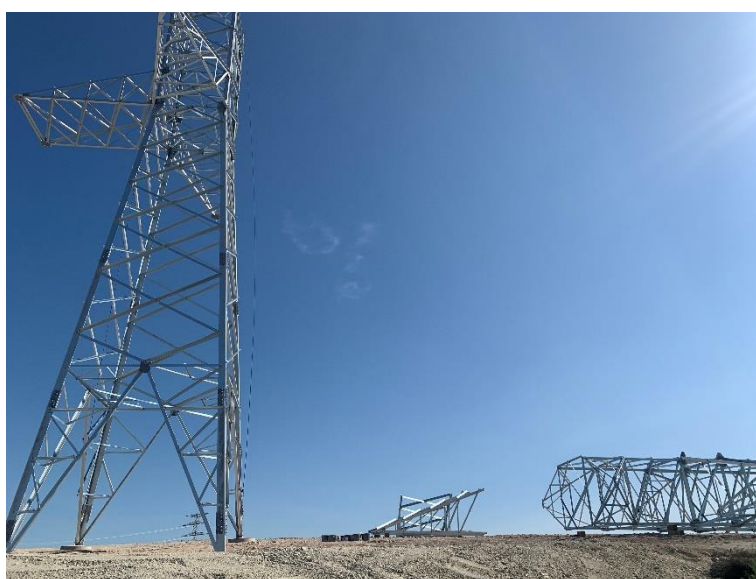
Figura 4 Montaje de los apoyos

Así mismo, se han iniciado los trabajos de montaje e izado de los apoyos (Figura 4), todos estos trabajos han respetado las áreas de ocupación y no se han detectado afecciones.