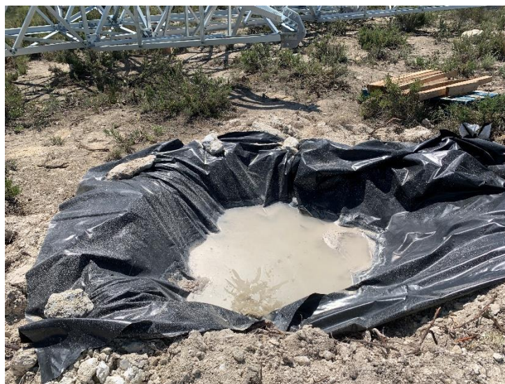
Figura 5 Lavadero de cubas

Se ha comprobado que se ha llevado a cabo la separación de tierra vegetal (Figura 5) y estériles de forma correcta, acopiándolo en ubicación diferentes. También se ha habilitado en cada uno de los apoyos una zona para la limpieza de cubas de hormigón. Que consiste en la colocación de un geotextil sobre el acopio de áridos.