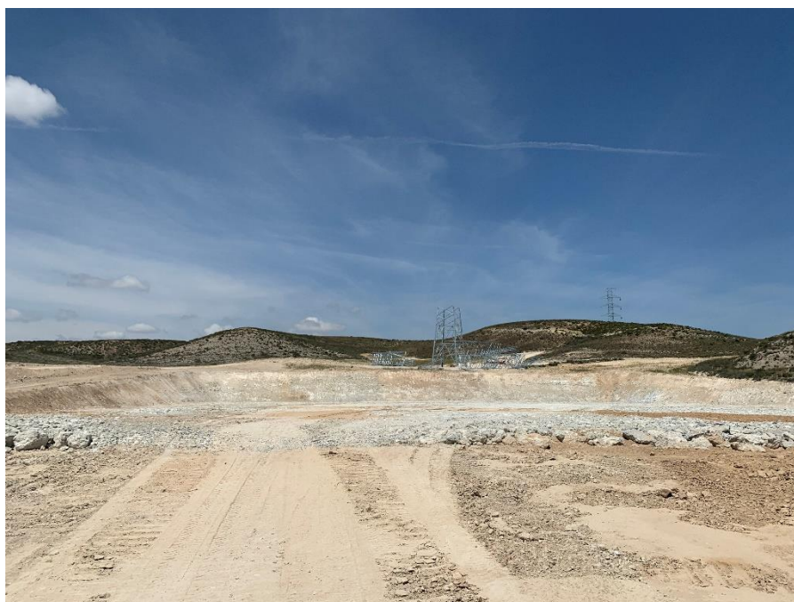
Figura 8 SET Fuentes