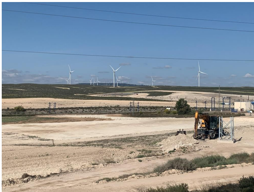
Figura 7 CS Ave

El presente anexo se compone de un número representativo de fotografías del total realizado durante el periodo evaluado, escogidas por su relevancia y/o carácter explicativo para la correcta comprensión del presente informe.