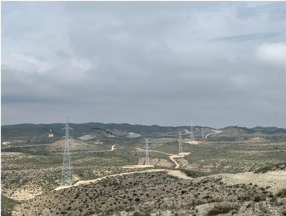
Figura 9 Apoyos izados