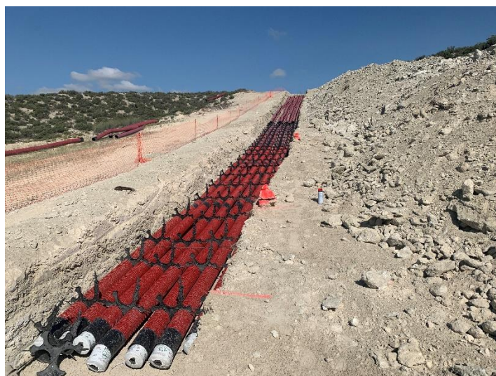
Figura 2 Excavación apoyo para soterrar apoyo 31

Esta actividad se ha desarrollado principalmente con la excavación de los cimientos de los apoyos (Figura 2) para su posterior hormigonado y en la apertura de los accesos.