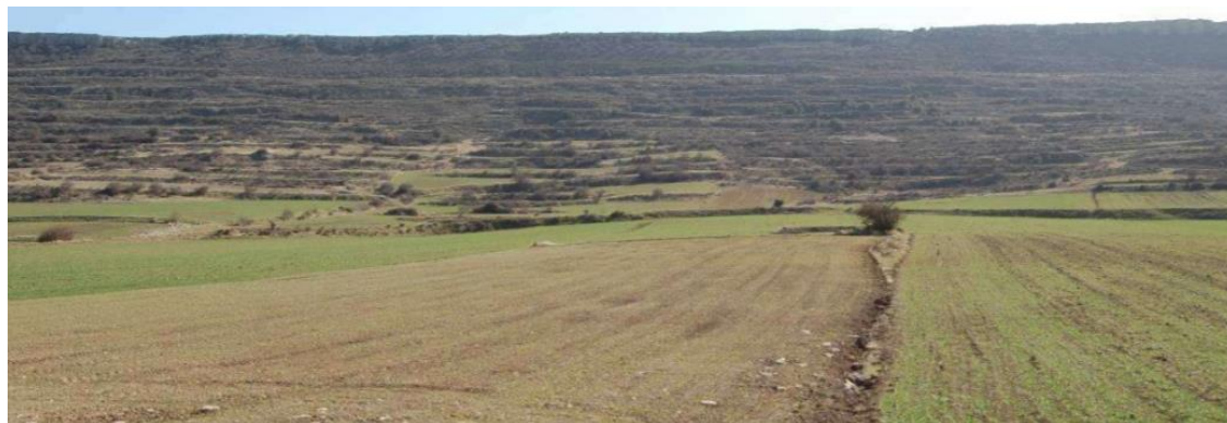
Campo dedicado al monocultivo de cereal, el paisaje más recurrente a lo largo de la LAT.

chamomilla , etc. Se trata mayoritariamente de especies de dicotiledóneas de carácter anual y en, menor medida, especies bianuales o perennes. No obstante, las labores y el empleo de herbicidas limitan la presencia de especies vegetales arvenses a la periferia de las parcelas, márgenes de caminos, linderos, etc.